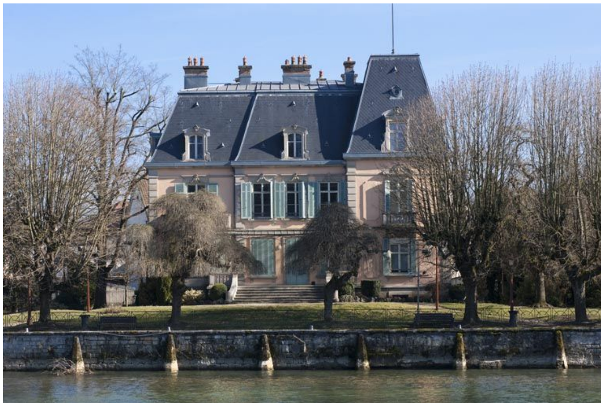
Vue d'ensemble depuis la rive gauche du Doubs.