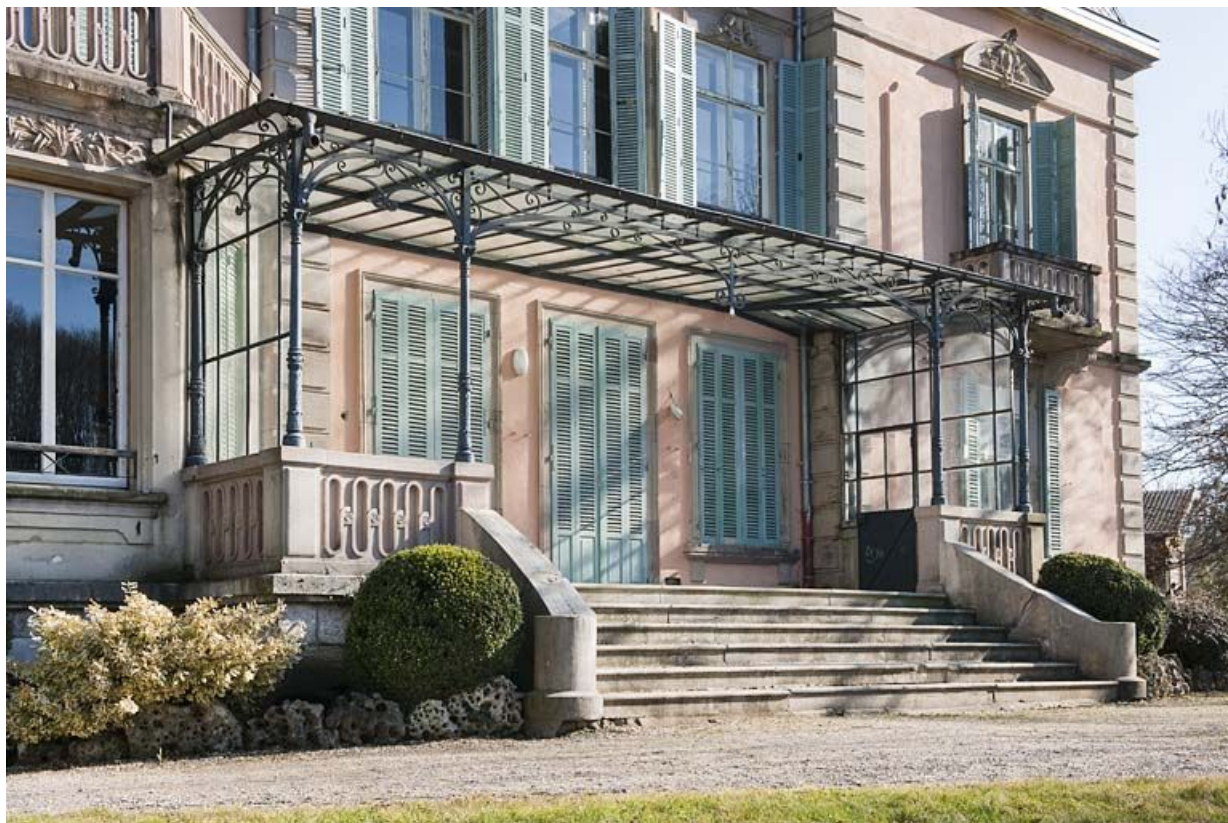
Le perron et la marquise de la façade ouest.