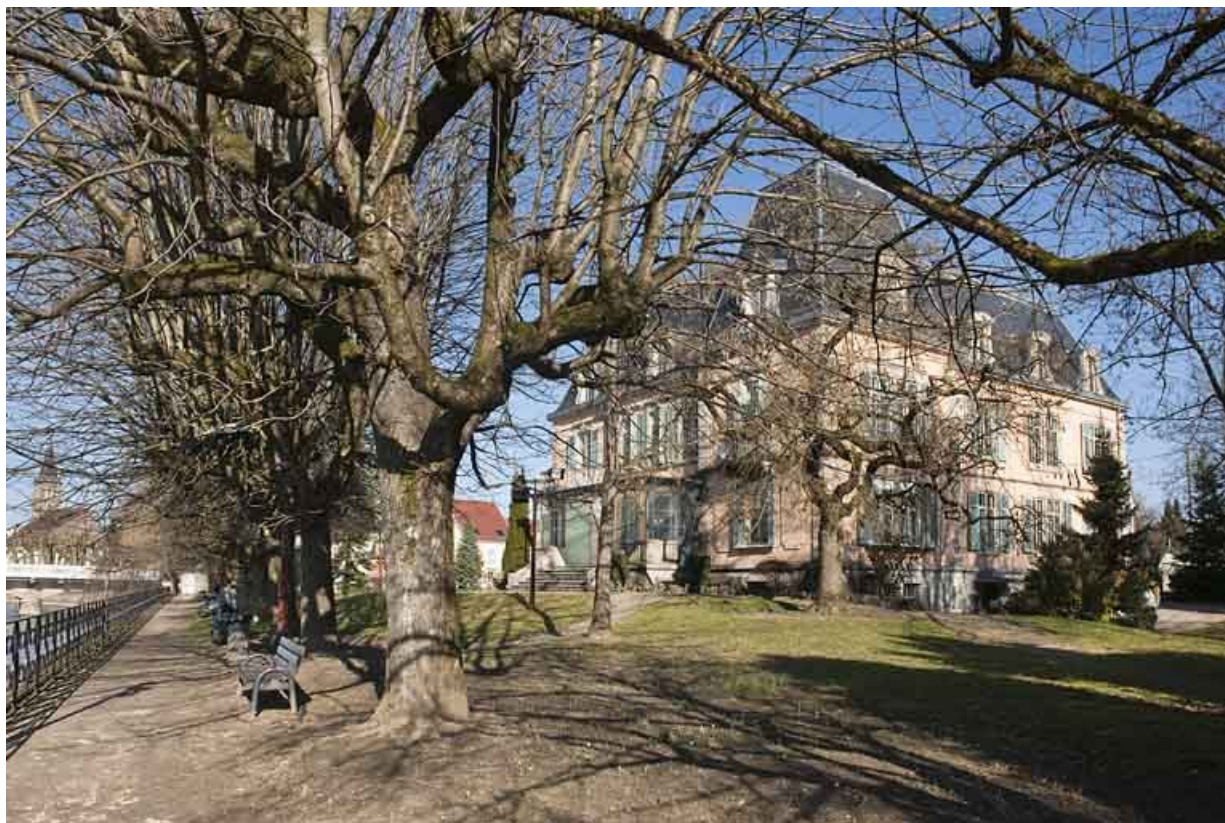
Vue de trois quarts depuis le parc.