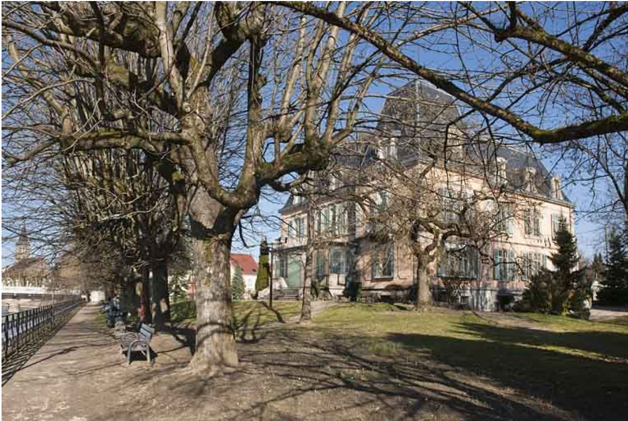
Vue de trois quarts depuis le parc.