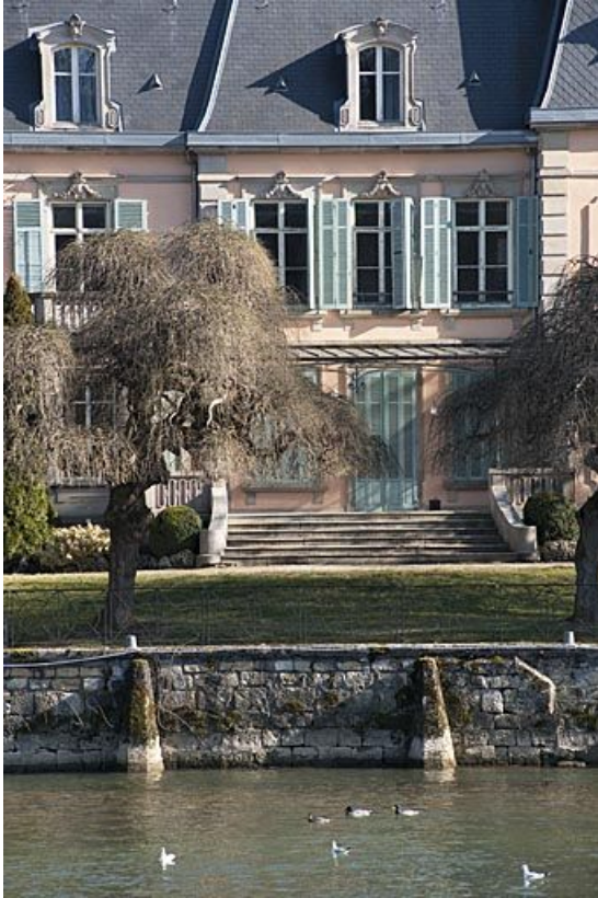
Détail de la façade ouest.