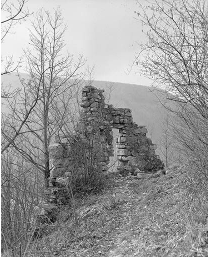
Détail : face interne de l'enceinte.