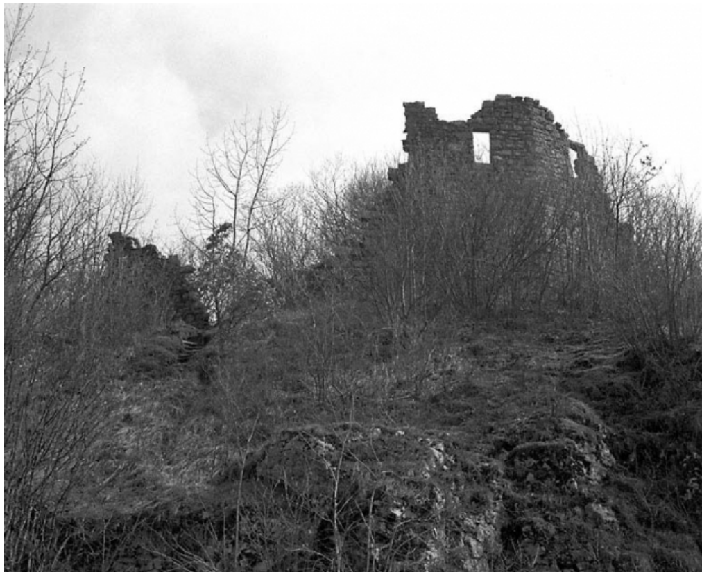
Elévation du côté de la vallée.