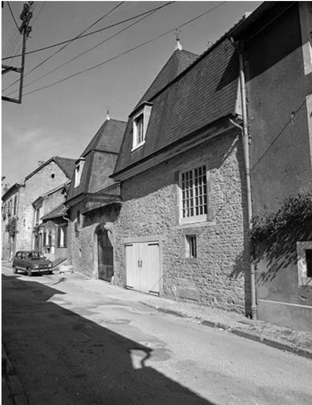
Vue générale depuis la rue. 25, Vuillafans