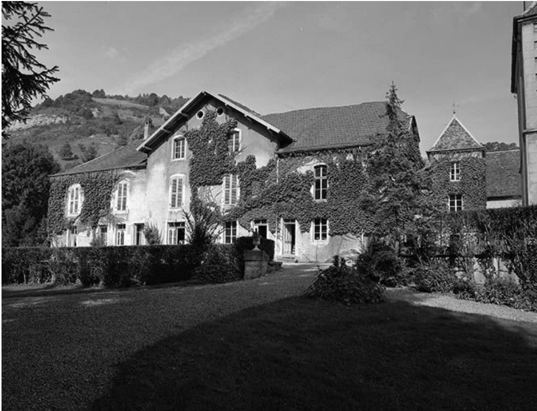
Façade antérieure du logement du gardien.