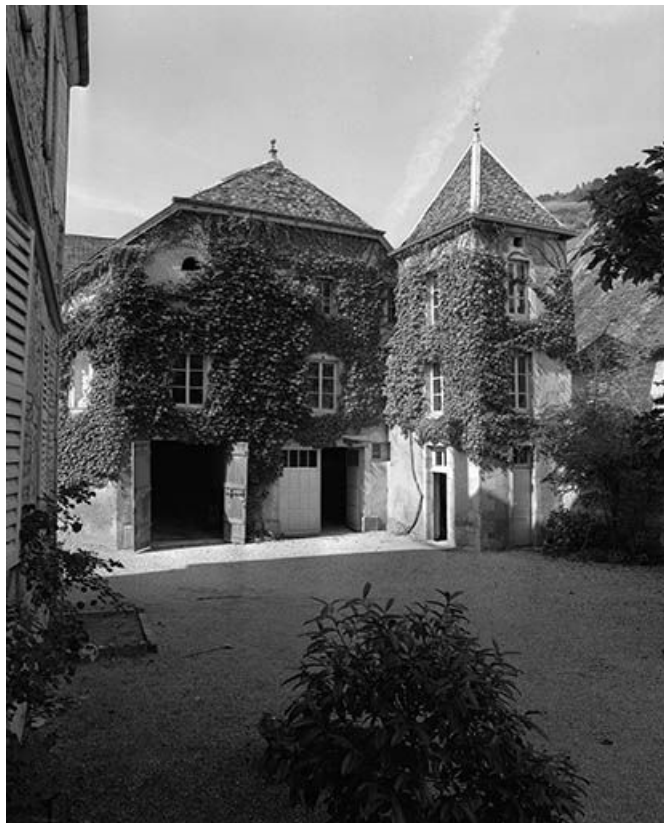
Face latérale droite du logement du gardien.