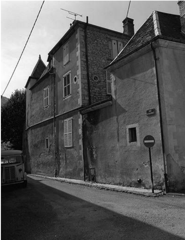
Face latérale gauche.