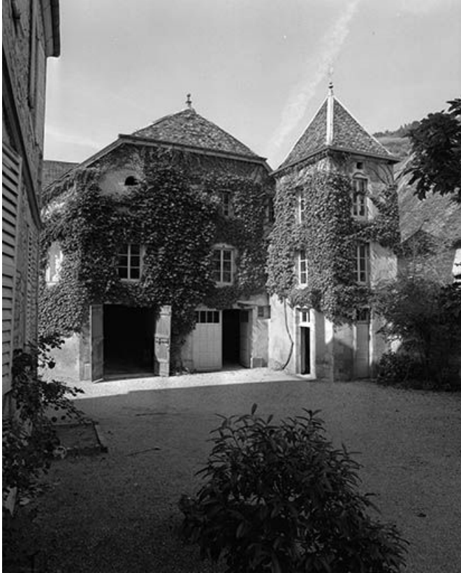
Face latérale droite du logement du gardien.