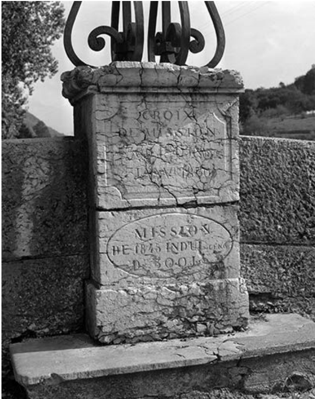
Détail du socle avec l'inscription et la date. 25, Vuillafans