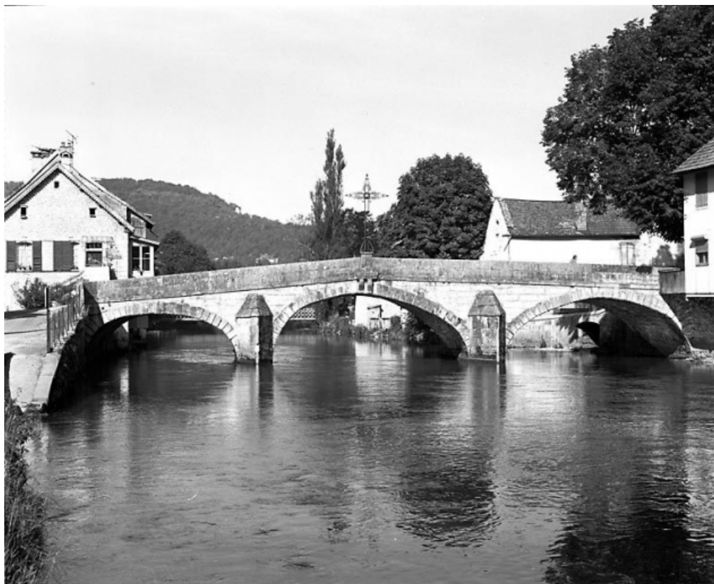
Vue rapprochée depuis la rive gauche. 25, Vuillafans