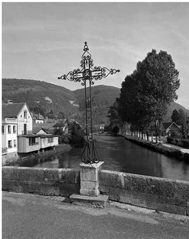
Vue générale de la croix monumentale. 25, Vuillafans