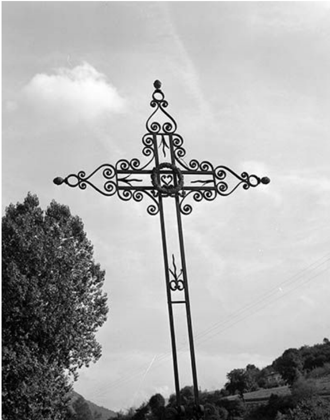
Détail de la croix monumentale.