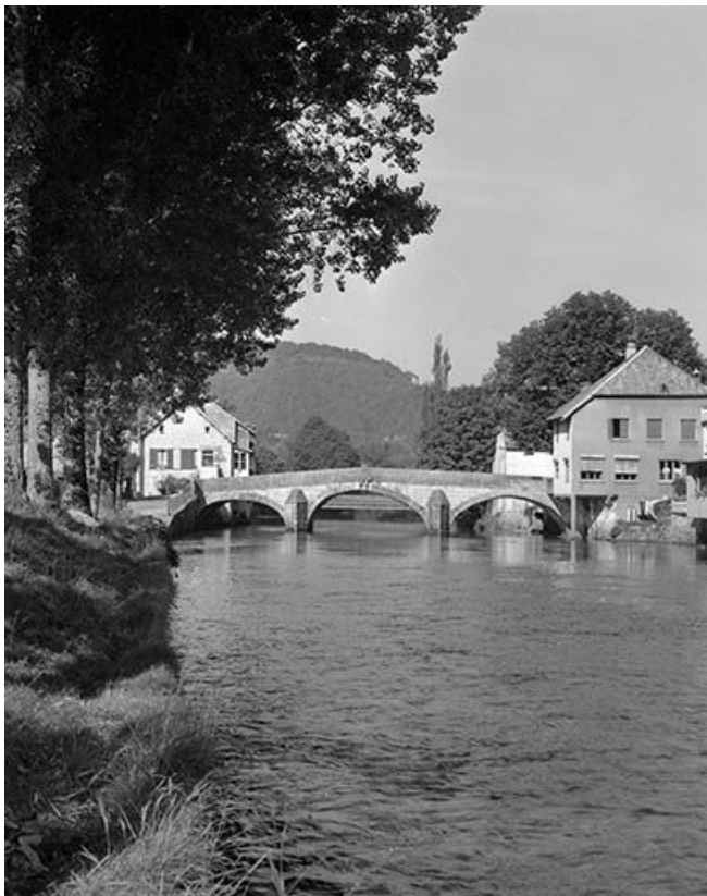
Vue générale depuis la rive gauche. 25, Vuillafans