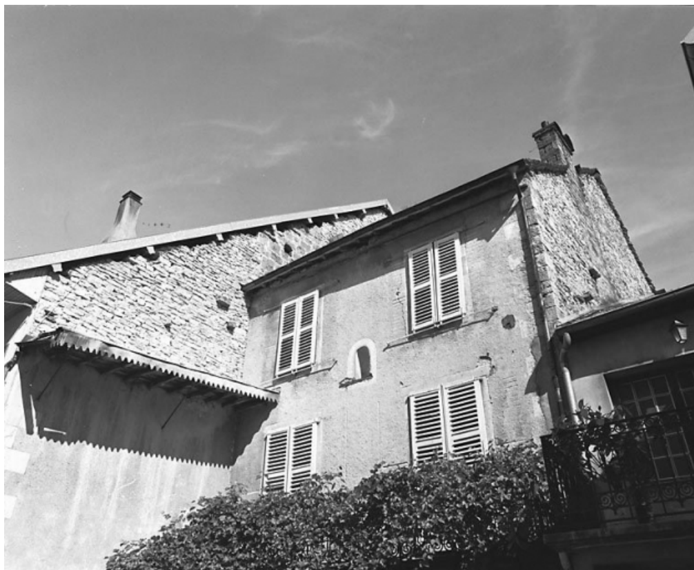
Détail de la façade antérieure : vue des 2ème et 3ème étages.