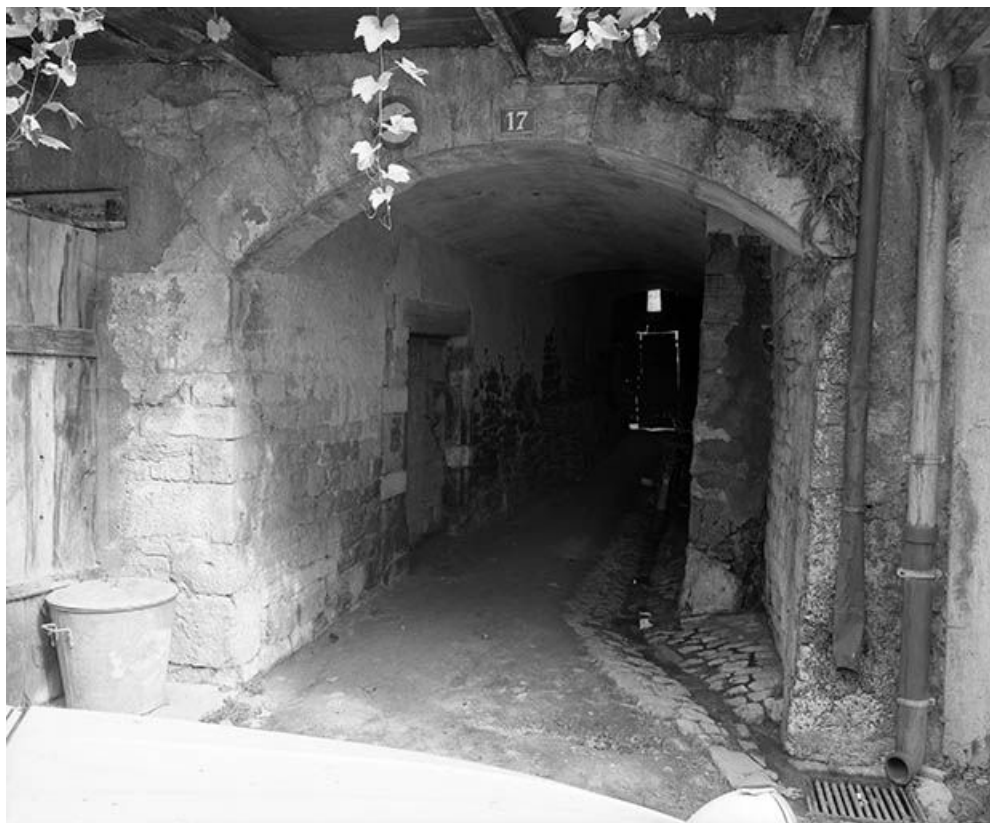
Façade antérieure : vue du passage voûté conduisant au jardin. 25, Vuillafans Grande Rue 17