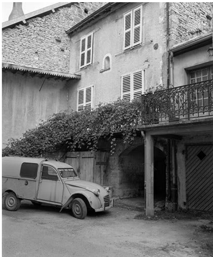
Façade antérieure vue de trois quarts droit. 25, Vuillafans