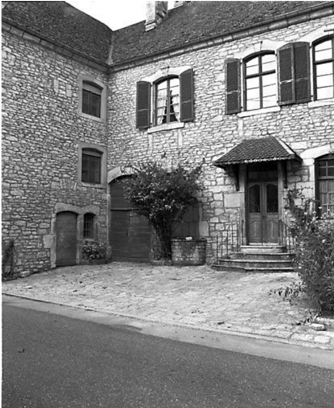
Façade antérieure : vue de trois quarts gauche. 25, Vuillafans