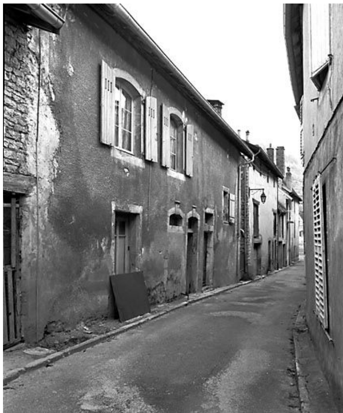
Façade antérieure vue de trois quarts gauche.