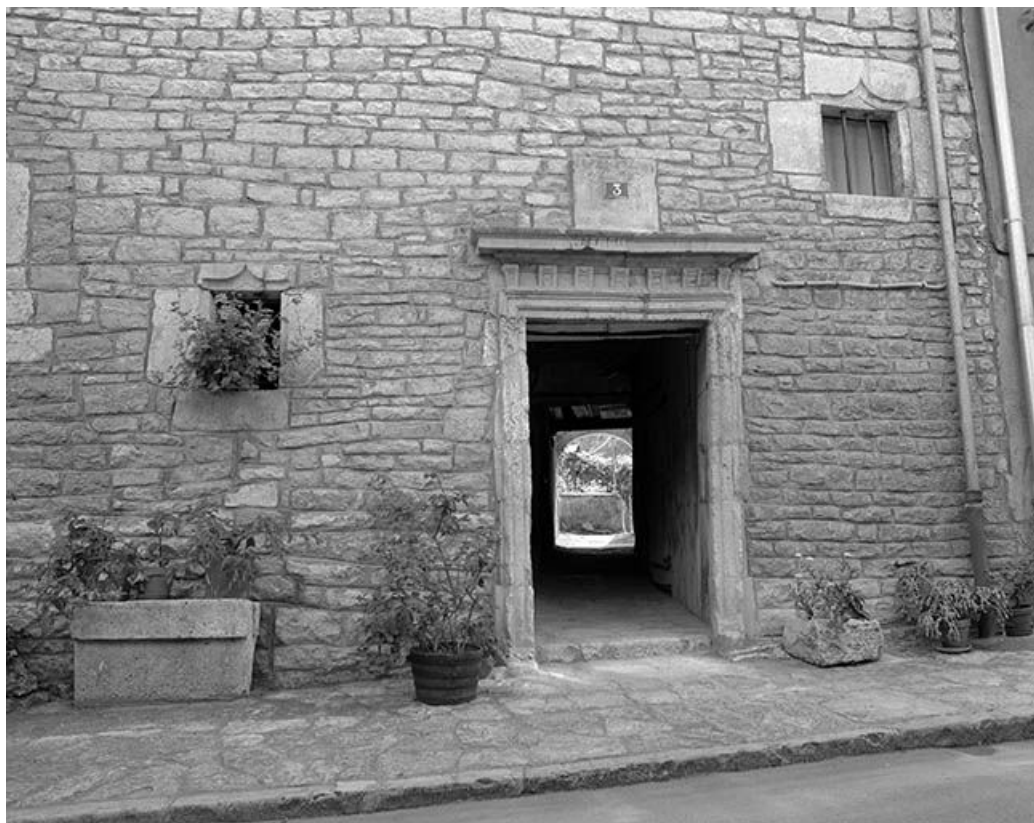
Détail de la façade antérieure : porte conduisant au jardin.