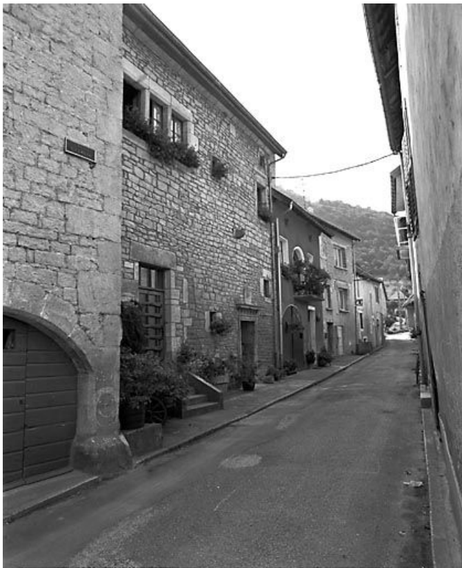
Façade antérieure vue de trois quarts gauche. 25, Vuillafans