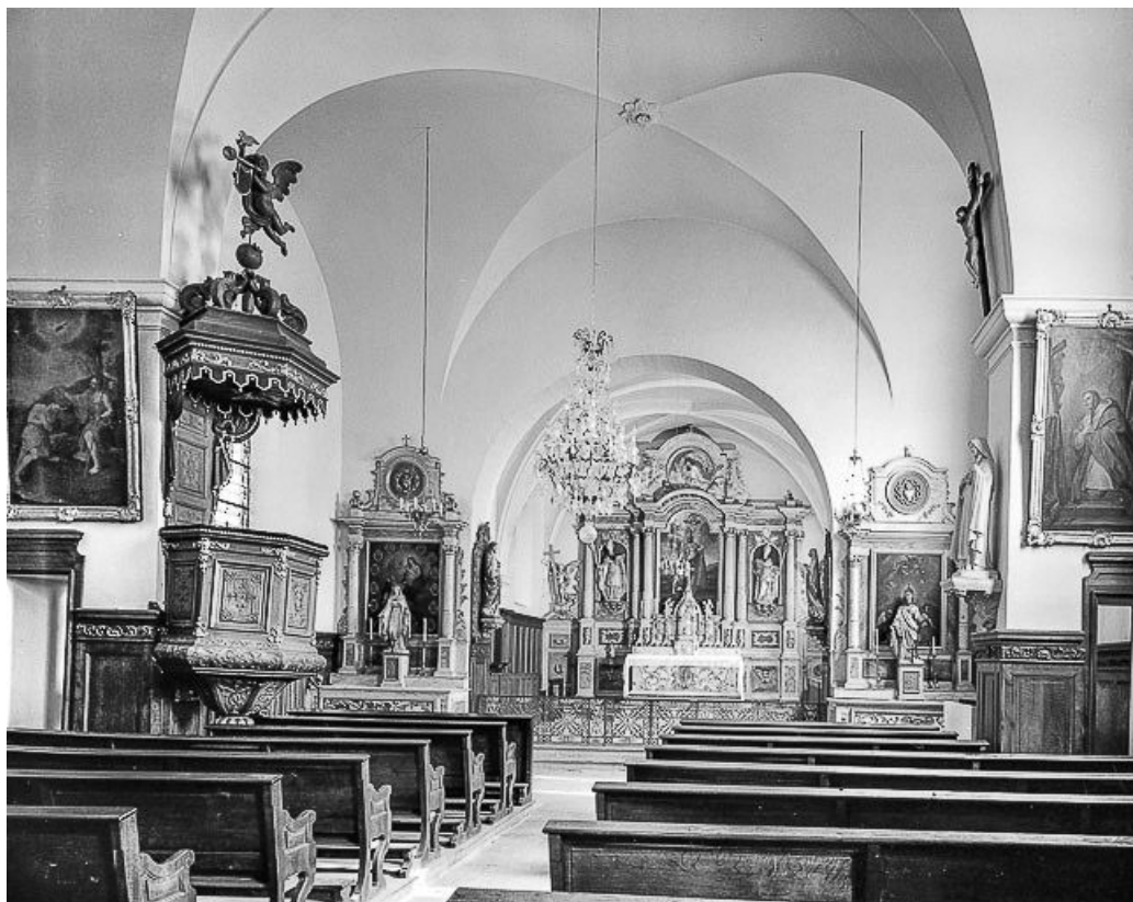
Intérieur : la nef et le chœur vus depuis l'entrée.

25, Villers-sous-Montrond rue de l' Eglise