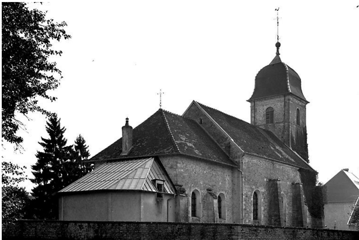
Face latérale gauche vue de trois quarts gauche.

25, Villers-sous-Montrond rue de l' Eglise