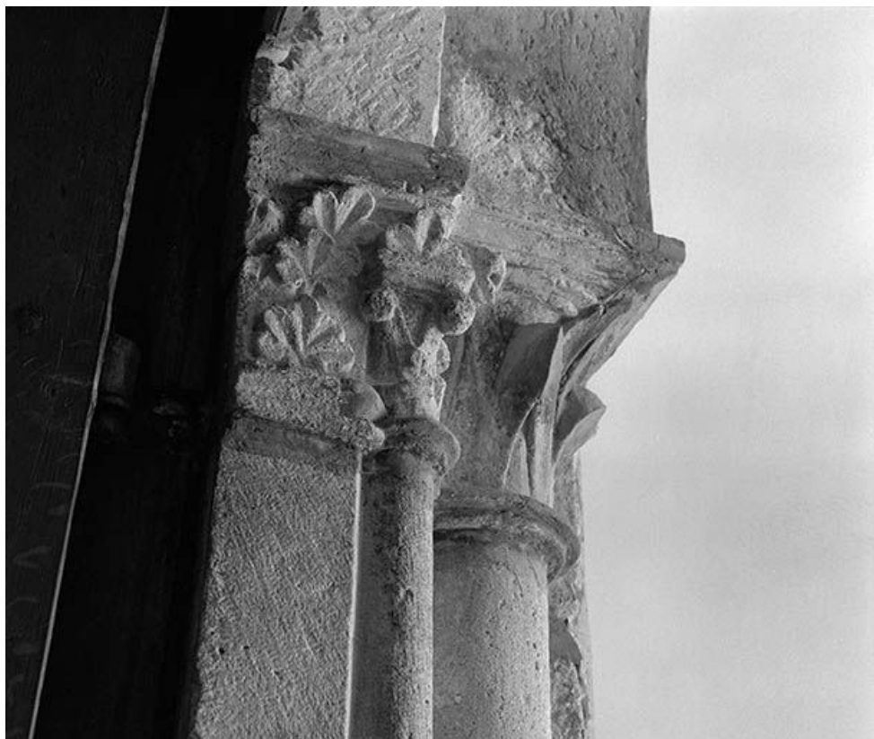
Détail du portail : les chapiteaux des colonnettes.

25, Villers-sous-Montrond rue de l' Eglise