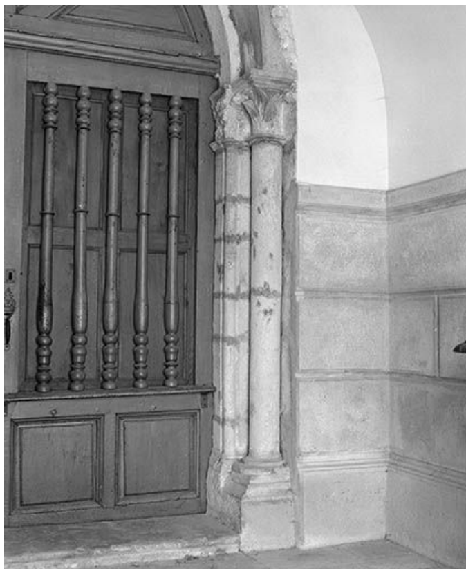
Détail du portail : les colonnettes du côté droit.

25, Villers-sous-Montrond rue de l' Eglise