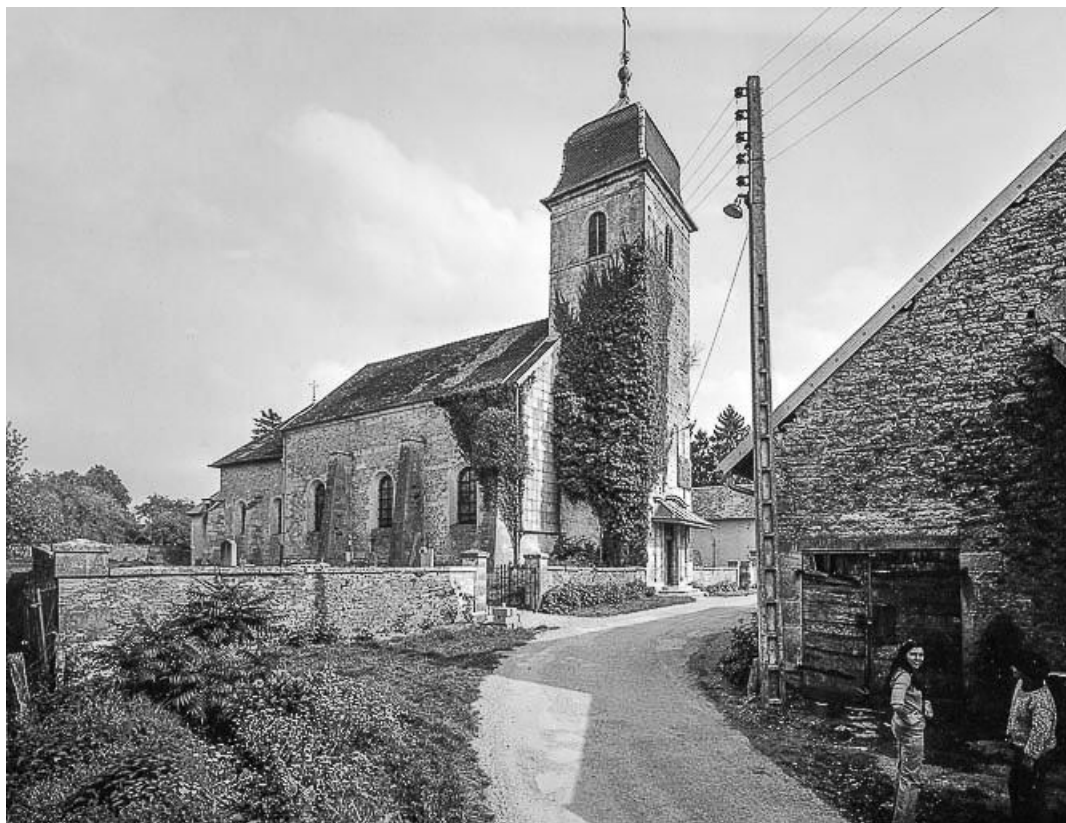
Façade antérieure et face latérale gauche. 25, Villers-sous-Montrond