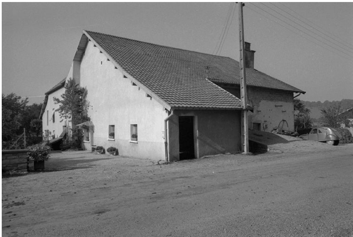
Ferme située 7 rue de Merey : façade antérieure et face latérale droite. 25, Villers-sous-Montrond