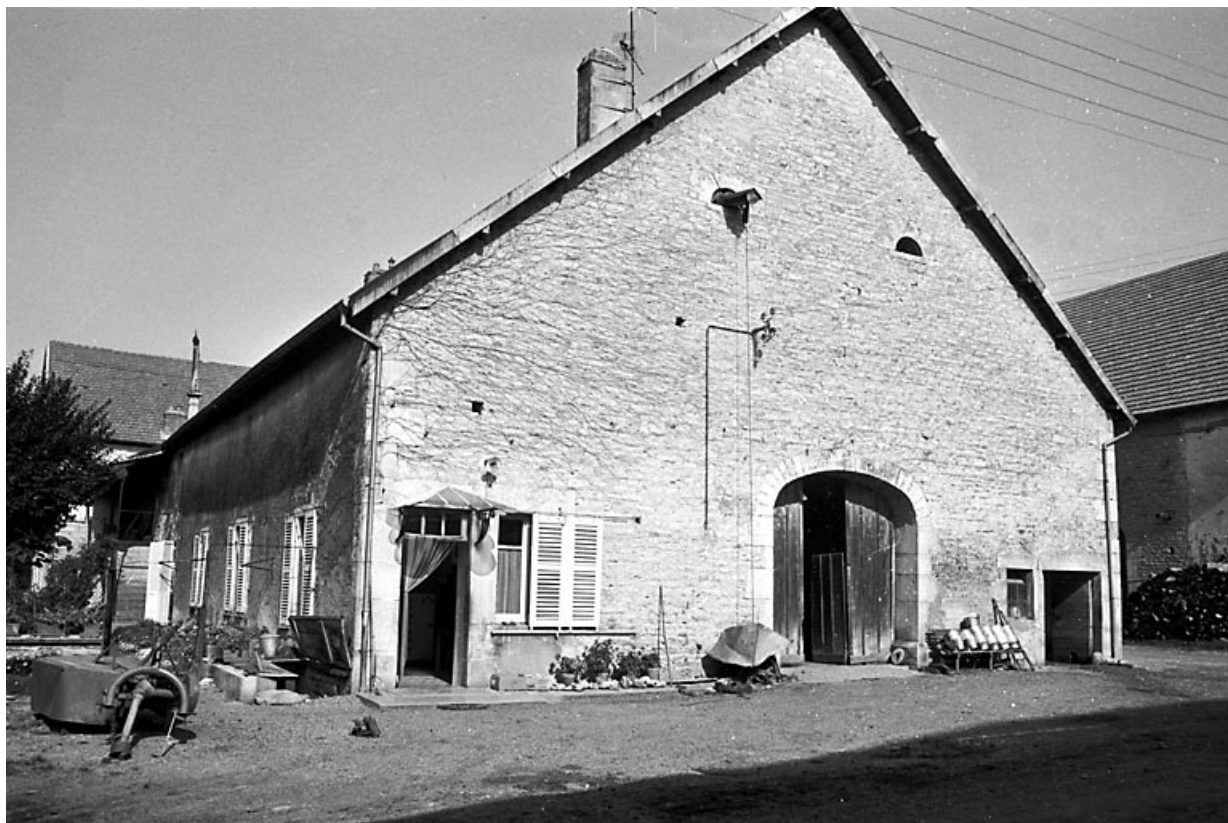
Façade antérieure et face latérale gauche. 25, Villers-sous-Montrond