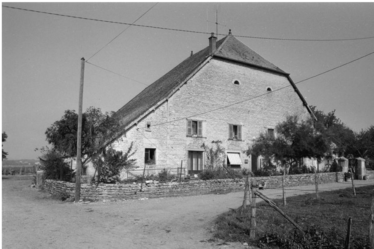
Ferme située rue du Camp : façade antérieure. 25, Villers-sous-Montrond