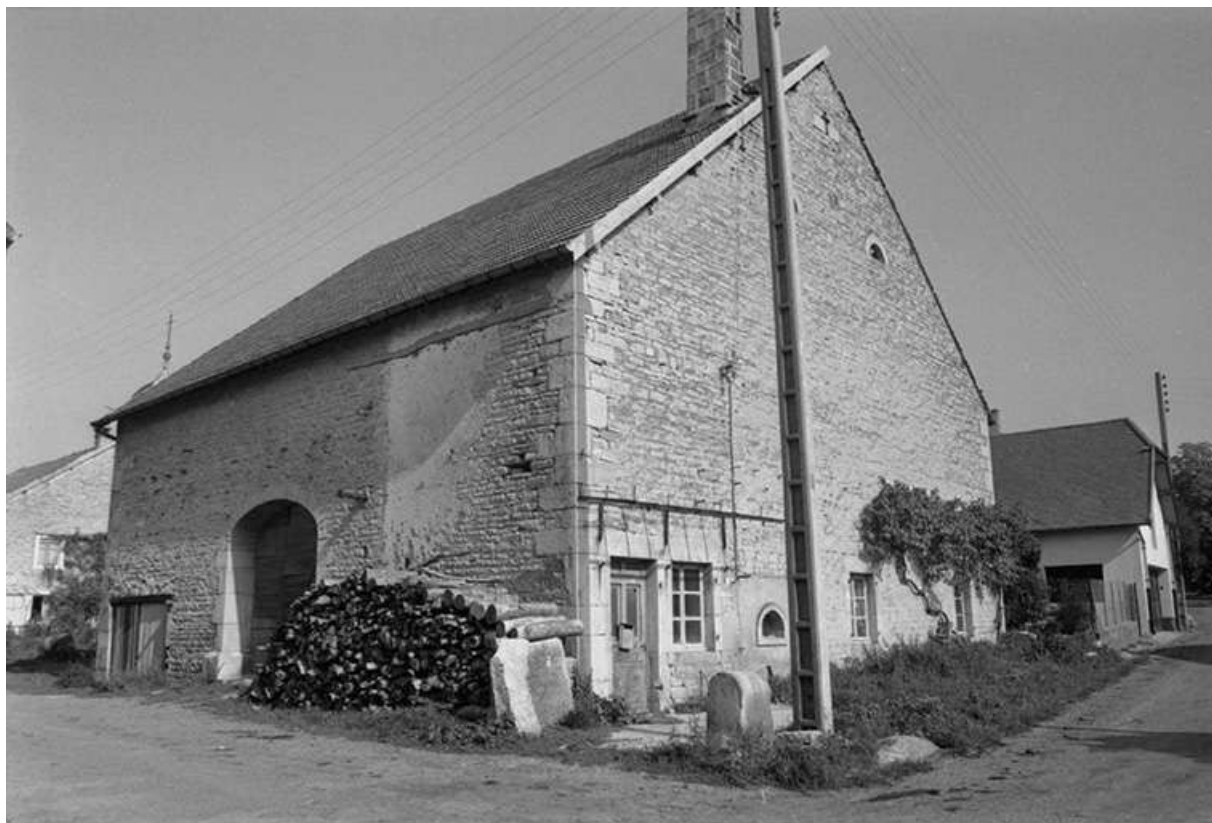
Ferme située 7 rue de Tarcenay : façade antérieure et face latérale gauche. 25, Villers-sous-Montrond