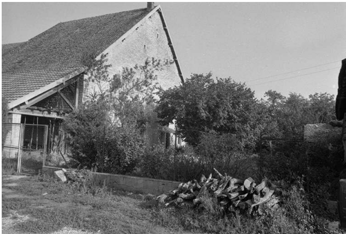
Ferme cadastrée 1969 AB 68 : façade antérieure.