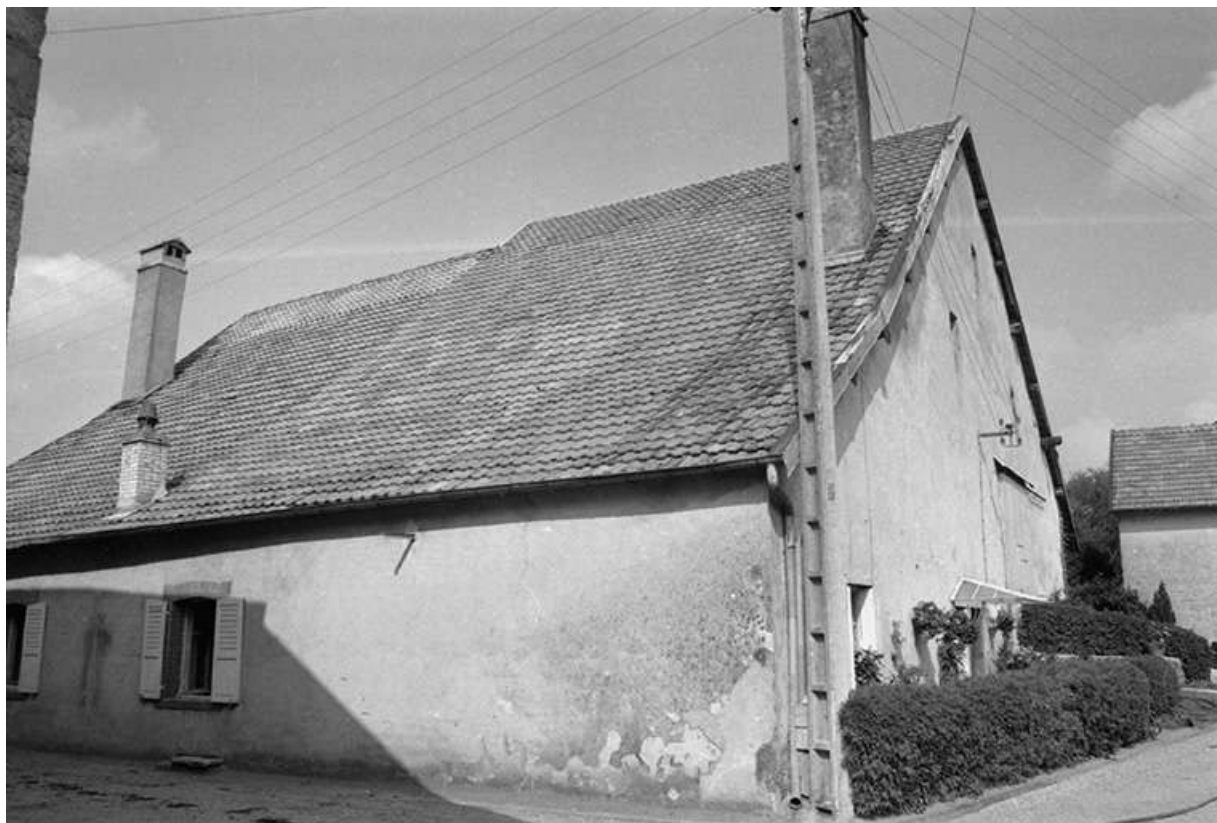
Façade antérieure et face latérale gauche. 25, Villers-sous-Montrond