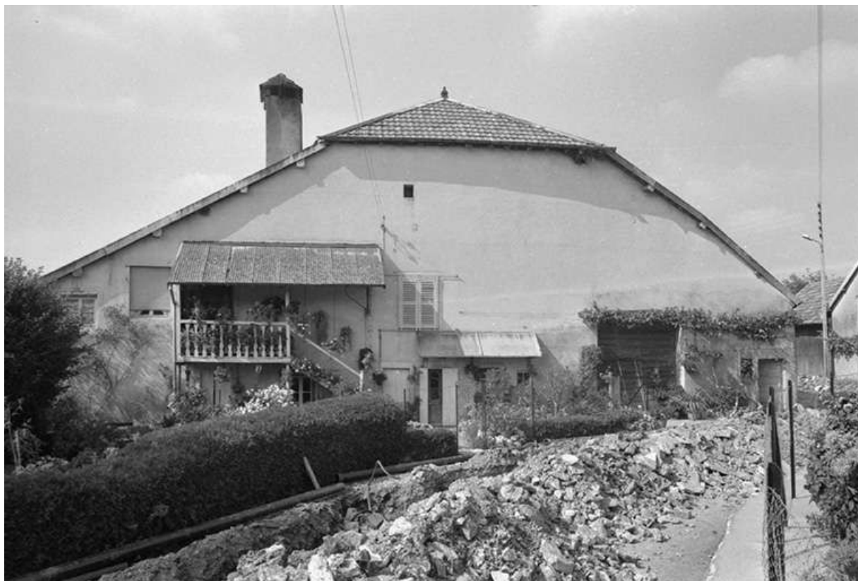
Ferme cadastrée 1969 AB 70, située route de Naglans : façade antérieure. 25, Villers-sous-Montrond