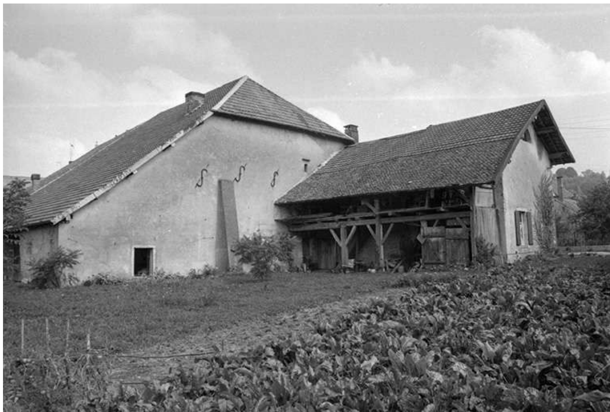
Ferme cadastrée 1969 AB 64, 65, située rue de l'Eglise (?) : façade postérieure. 25, Villers-sous-Montrond