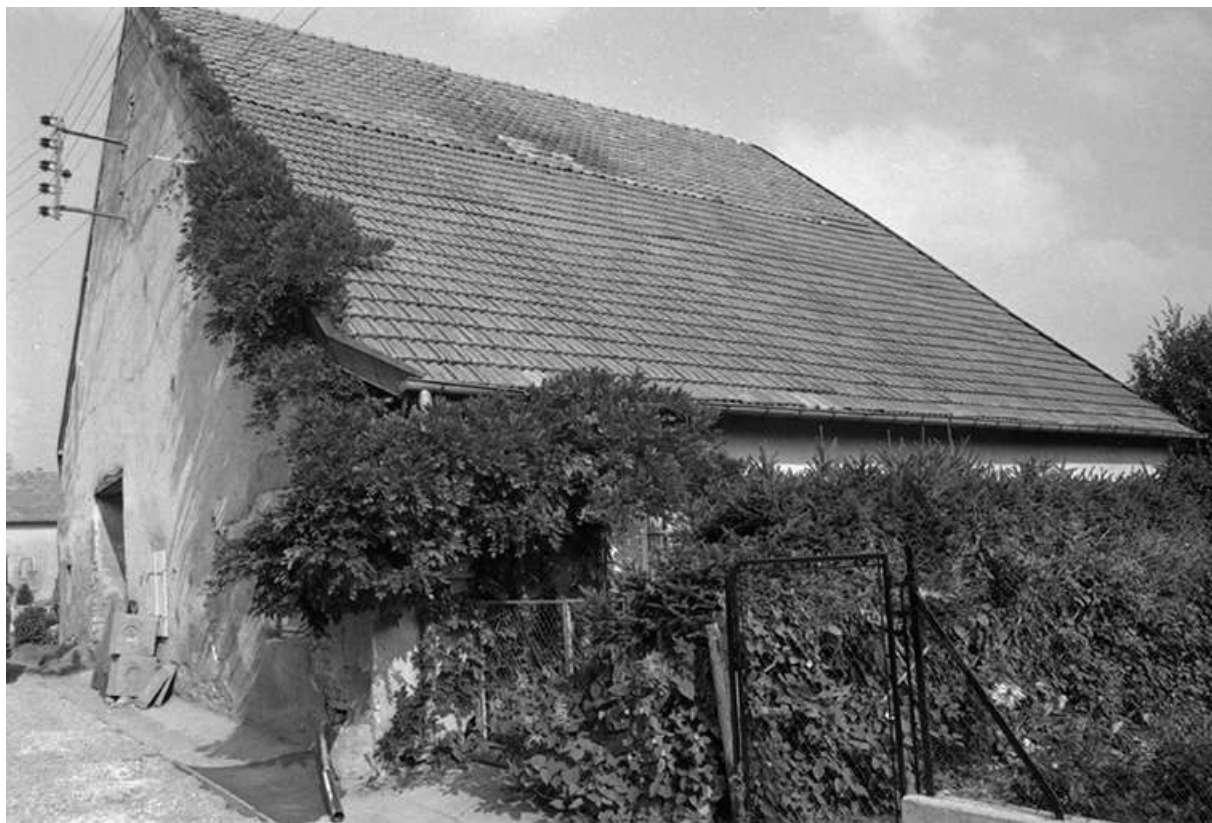
Maison cadastrée 1969 AB 60, située rue de l'Eglise : façade antérieure et face latérale droite. 25, Villers-sous-Montrond