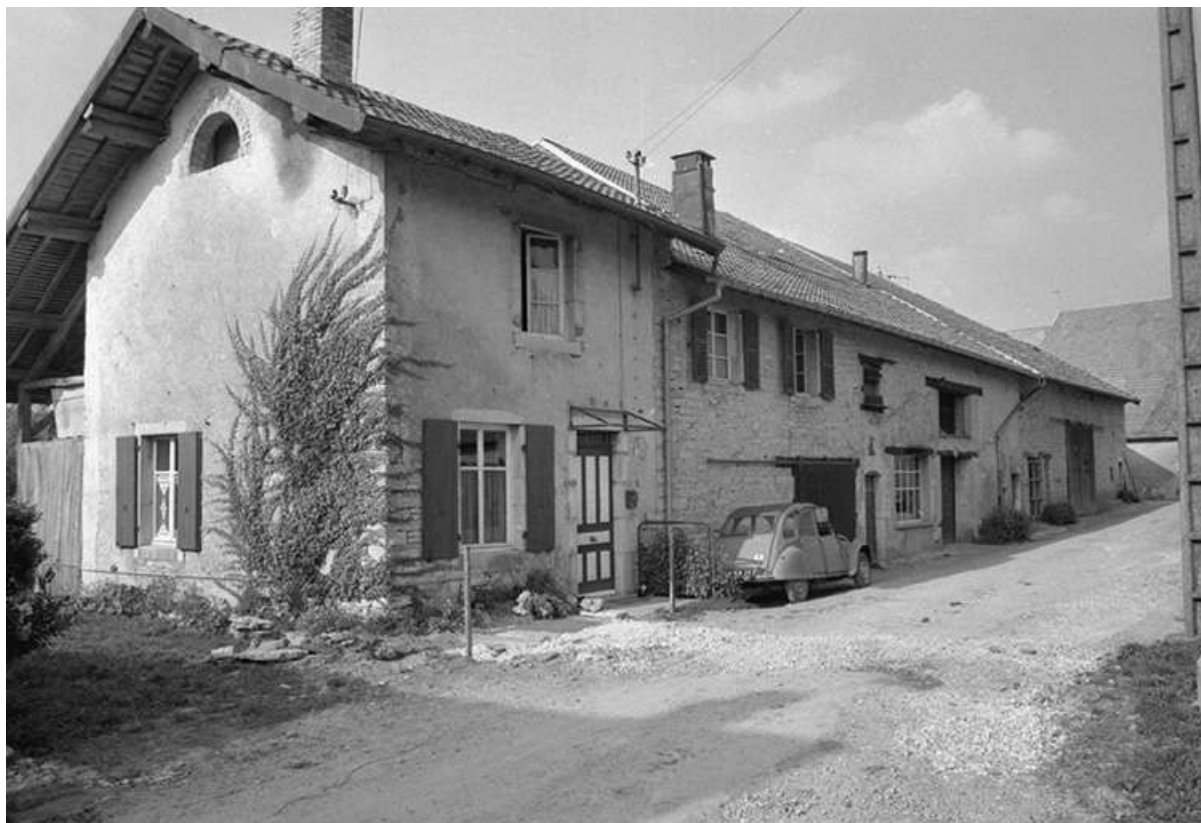
Maisons situées rue de l'Eglise : façade antérieure et face latérale gauche. 25, Villers-sous-Montrond