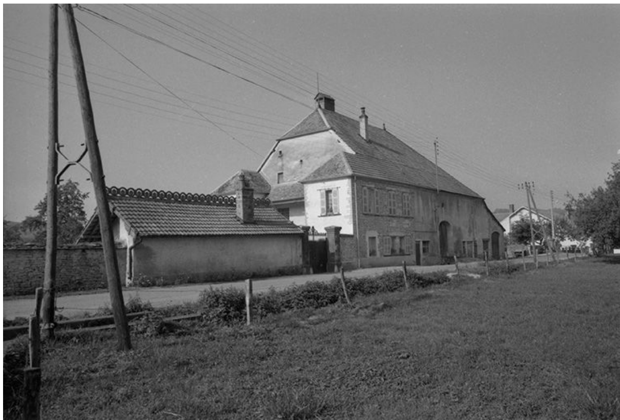
Vue d'ensemble depuis la rue.