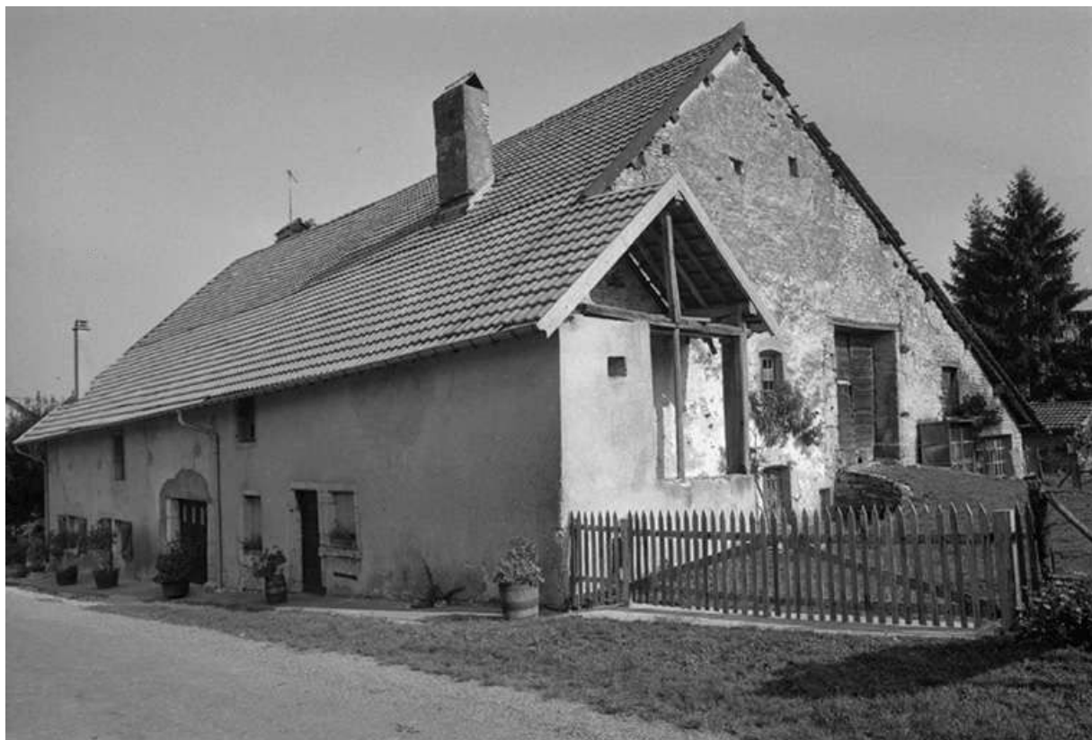
Ferme située 3 rue de Malbrans : façade antérieure et et face latérale droite. 25, Villers-sous-Montrond