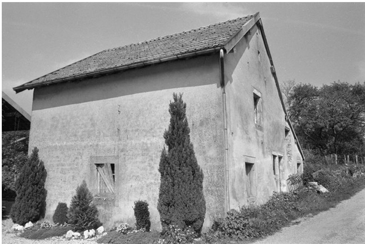
Ferme située rue de l'Eglise (?) : façade antérieure et face latérale gauche. 25, Villers-sous-Montrond