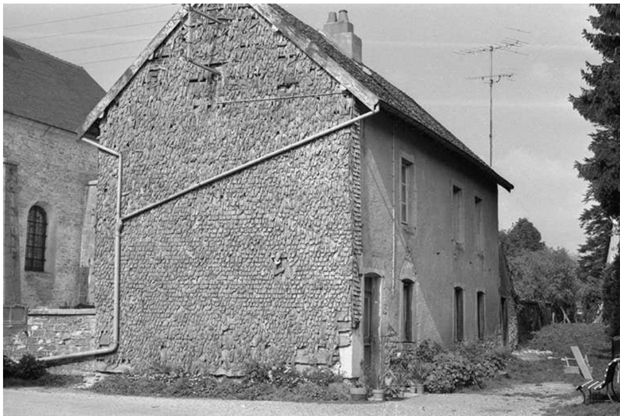
Maison située impasse Caramel : façade antérieure et face latérale gauche. 25, Villers-sous-Montrond