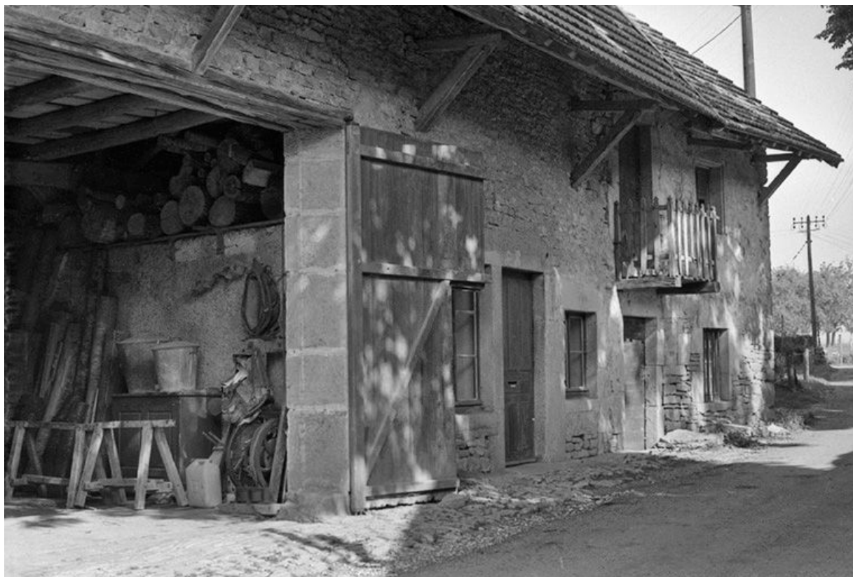
Façade antérieure vue de trois quarts gauche. 25, Villers-sous-Montrond