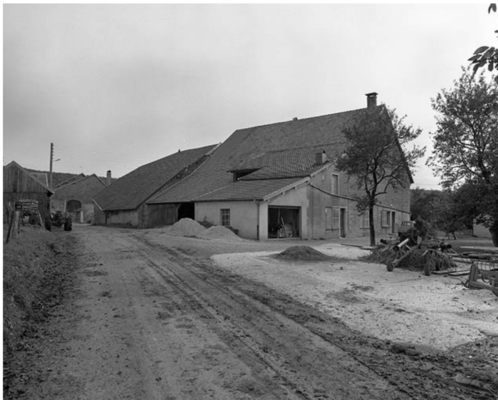
Façade antérieure et face latérale gauche. 25, Villers-sous-Montrond