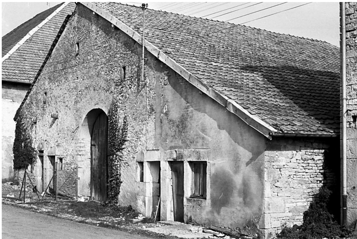
Façade antérieure vue de trois quarts droit. La ferme était située entre le 2 et le 4 rue de Tarcenay (numéros de 2019) 25, Villers-sous-Montrond