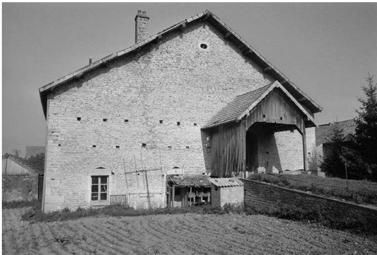
Ferme située 2 rue de Tarcenay : le pont de grange. 25, Villers-sous-Montrond