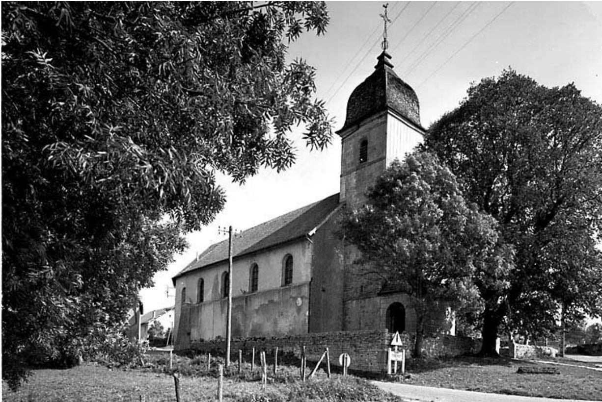
Face latérale gauche.