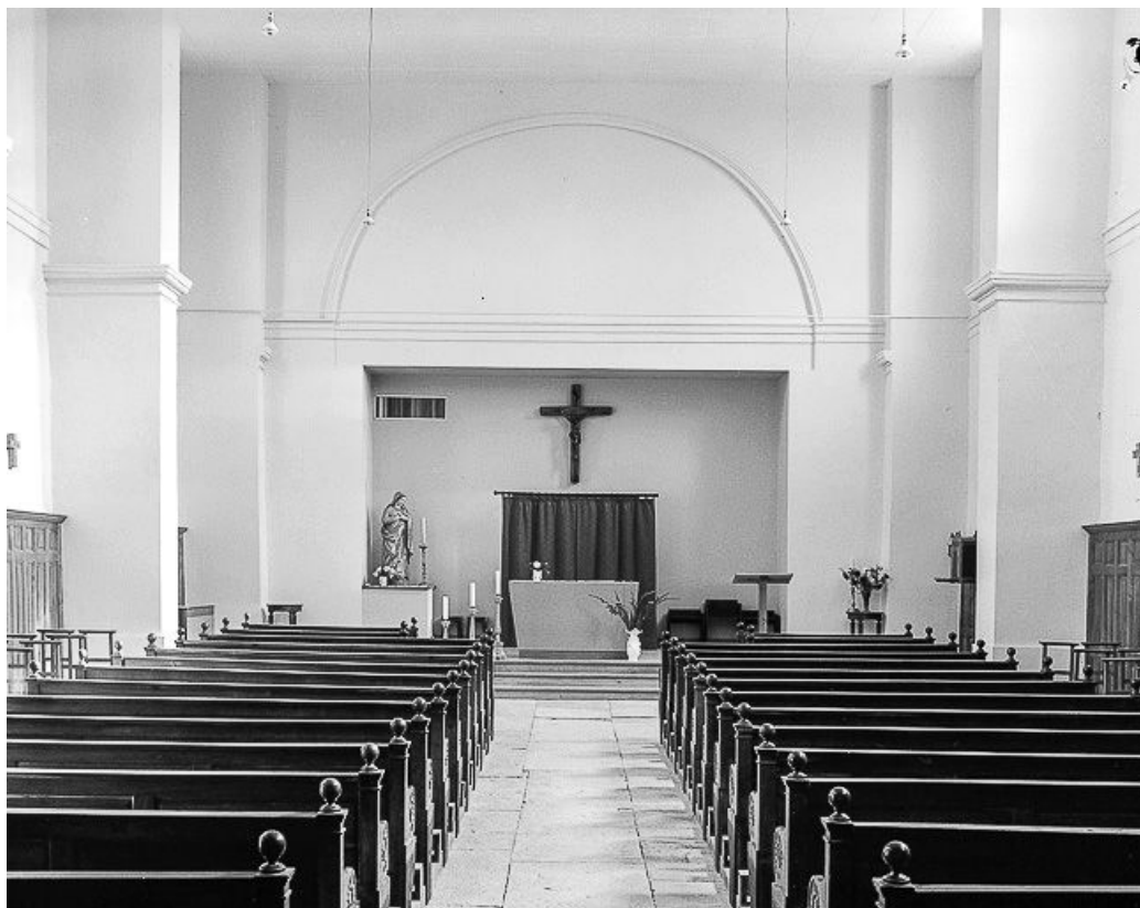
Intérieur : la nef et le chœur vus depuis l'entrée.