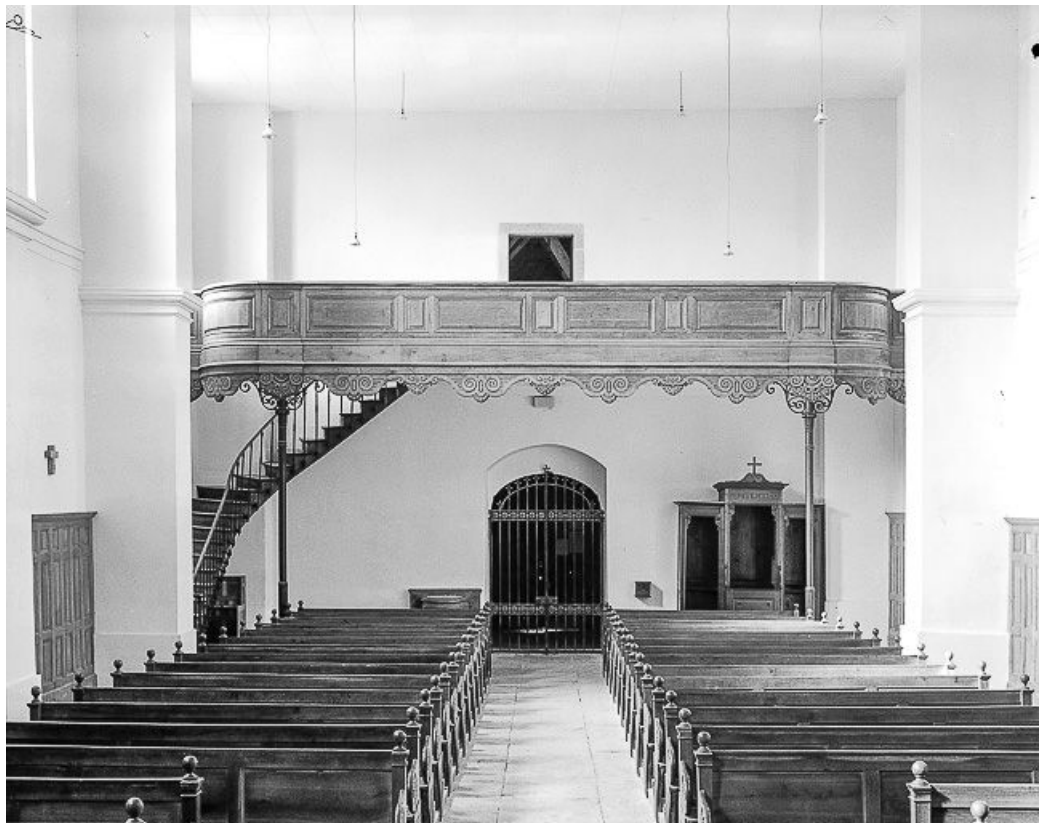
La nef vue depuis le chœur.