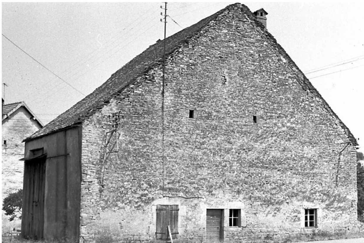
Façade antérieure et face latérale gauche. 25, Tarcenay