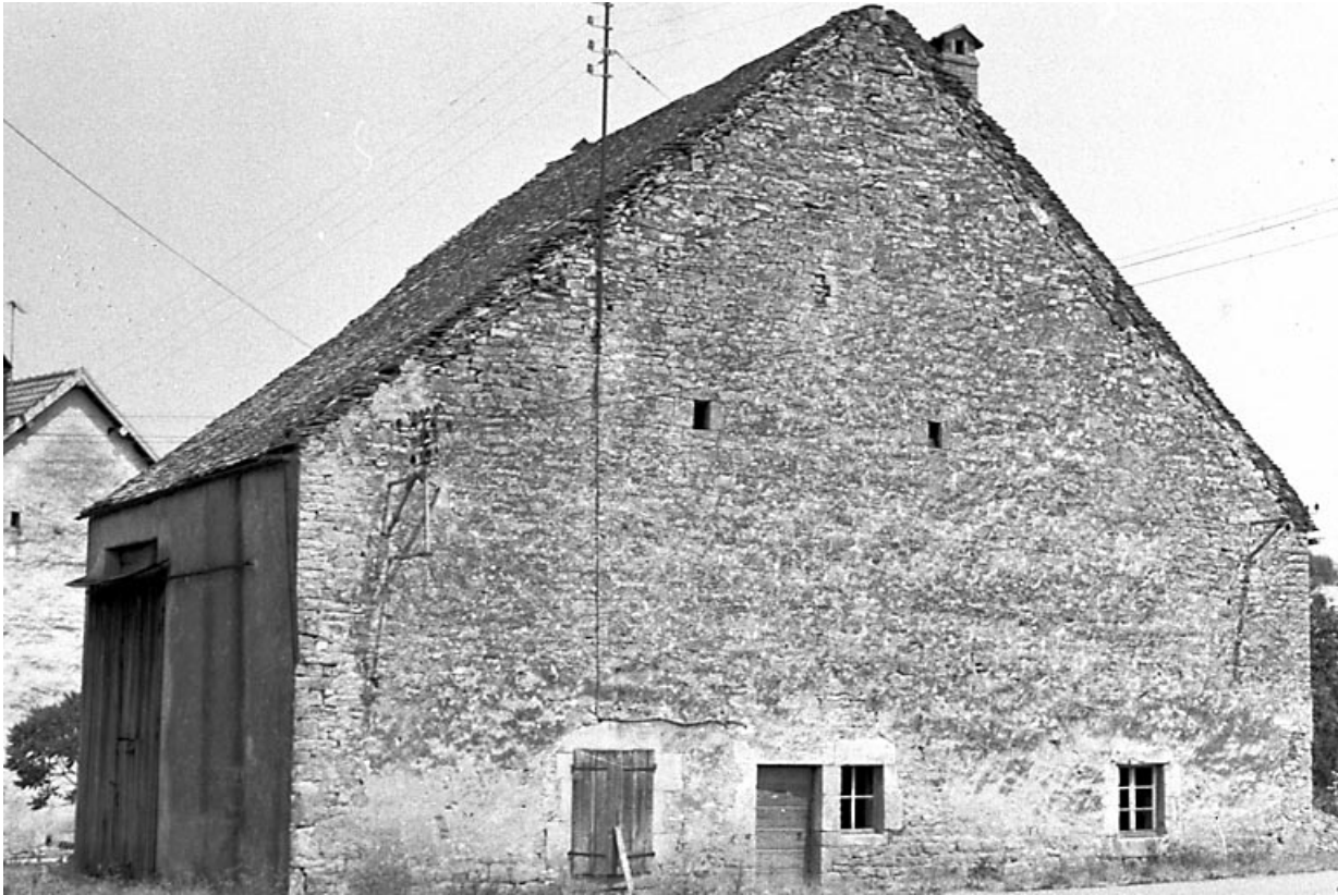
Façade antérieure et face latérale gauche. 25, Tarcenay