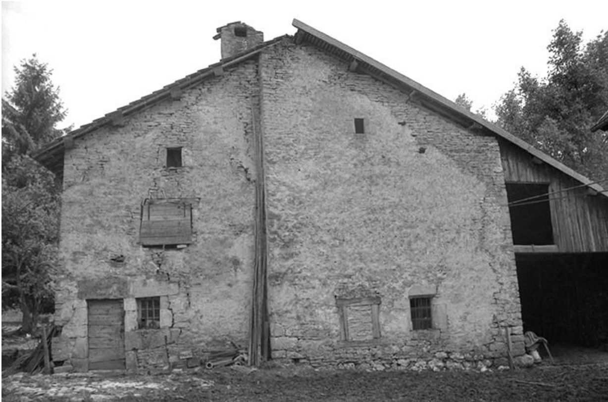
Ancienne ferme portant les dates 1727 et 1782.