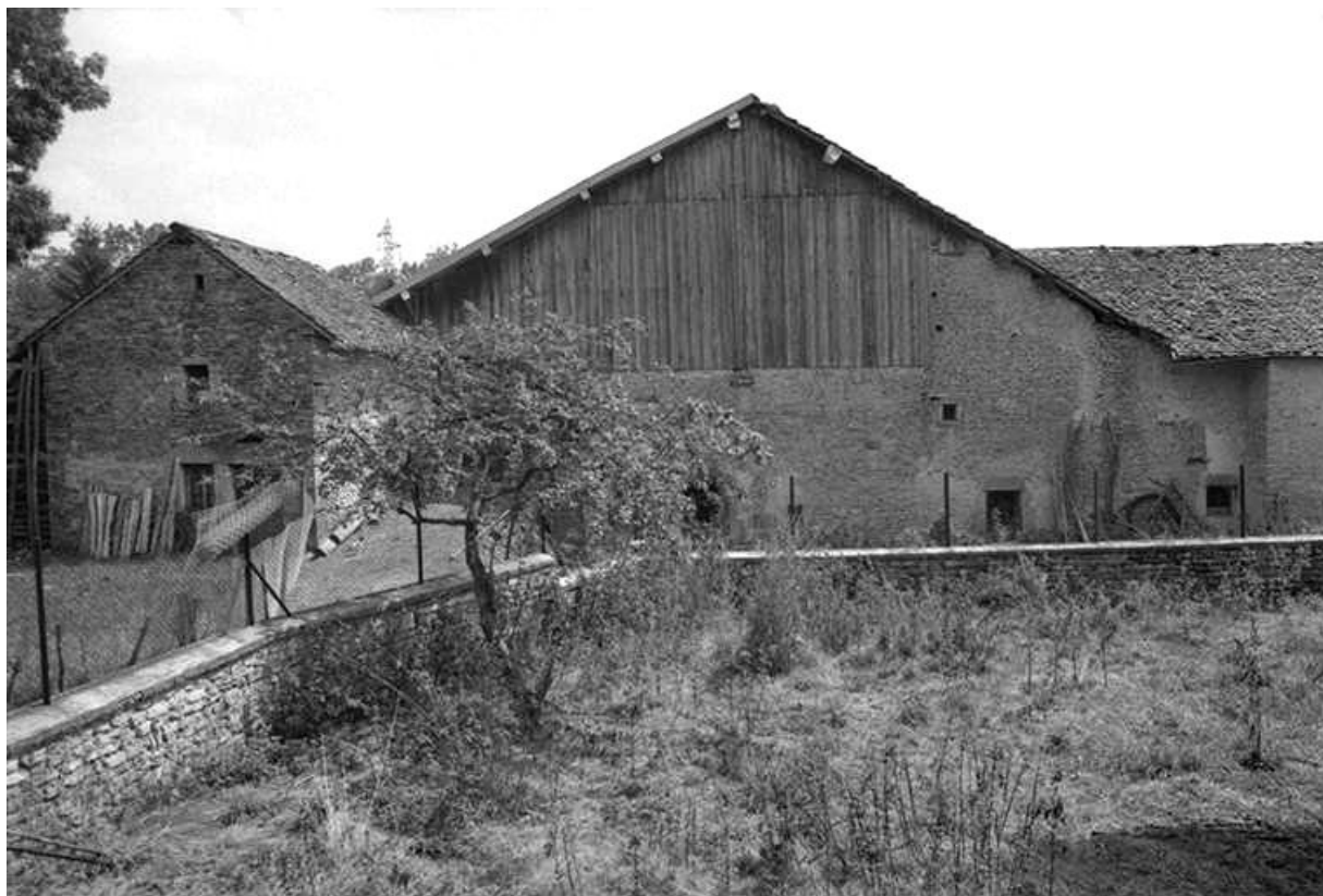
Vue générale depuis le nord-est.