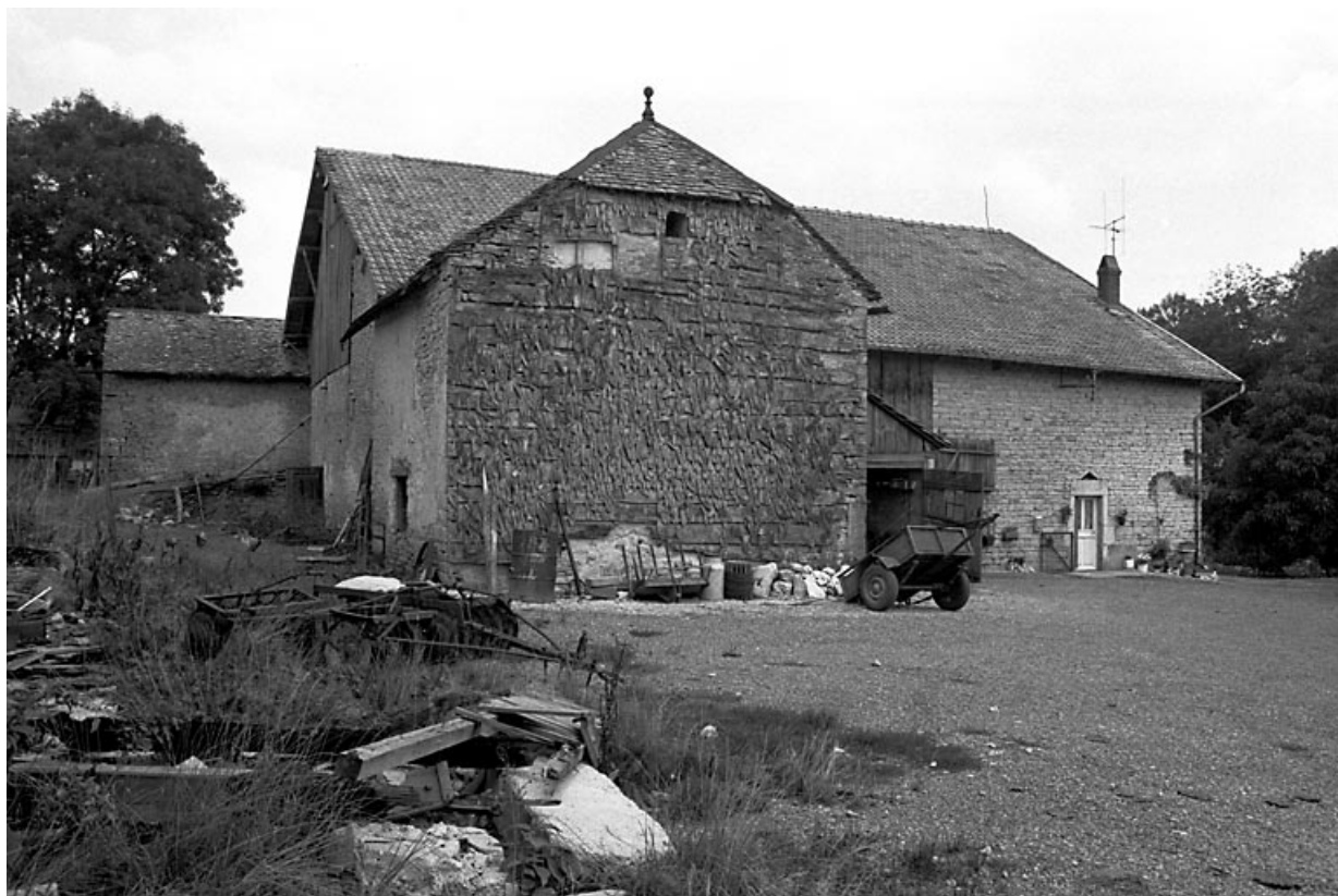
Vue générale depuis le sud-ouest.