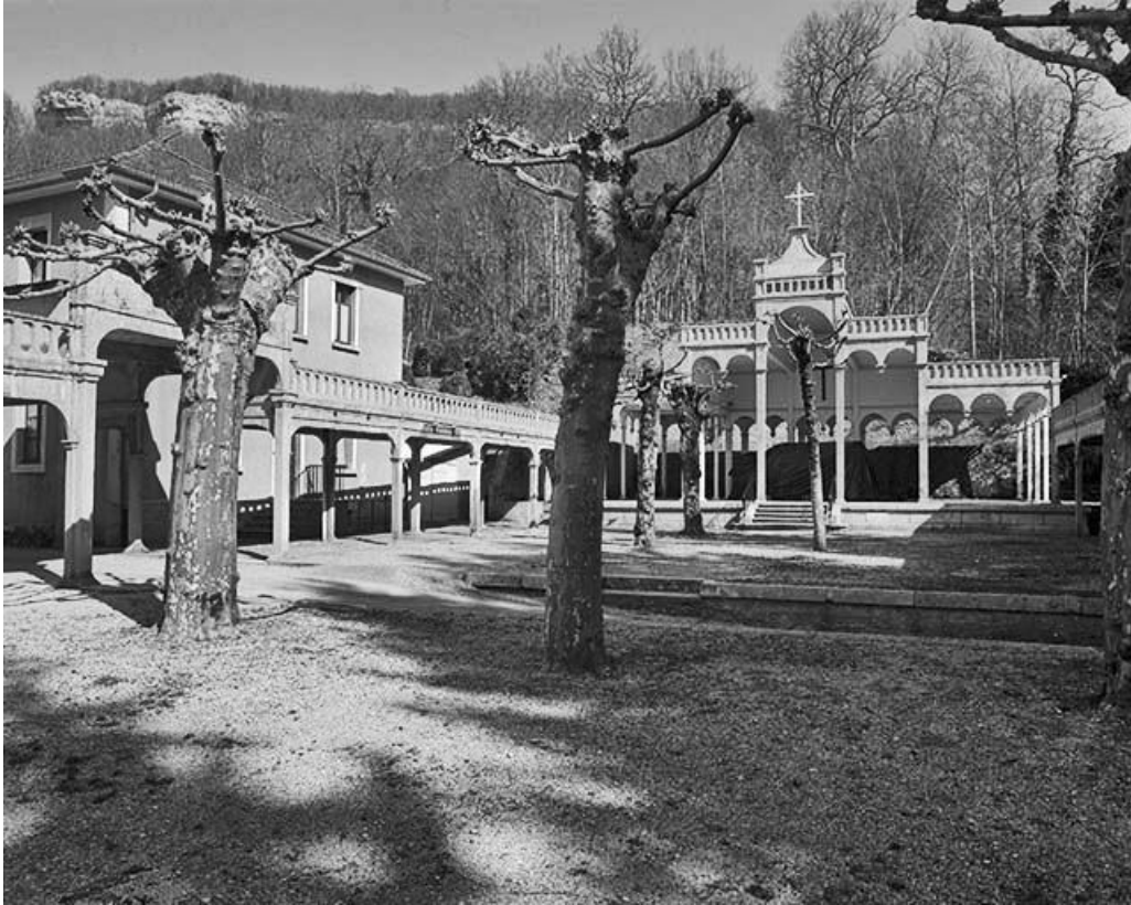
Vue générale de trois quarts gauche de la chapelle de plein air.

25, Scey-Maisières, lieudit : Maisières-Notre-Dame