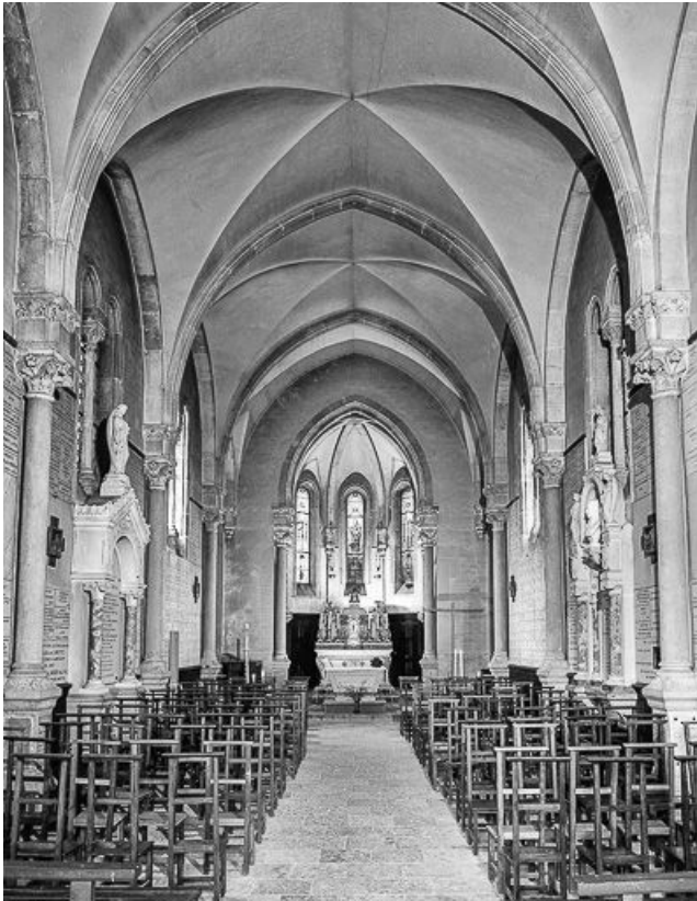
Nef vue depuis l'entrée.

25, Scey-Maisières, lieudit : Maisières-Notre-Dame