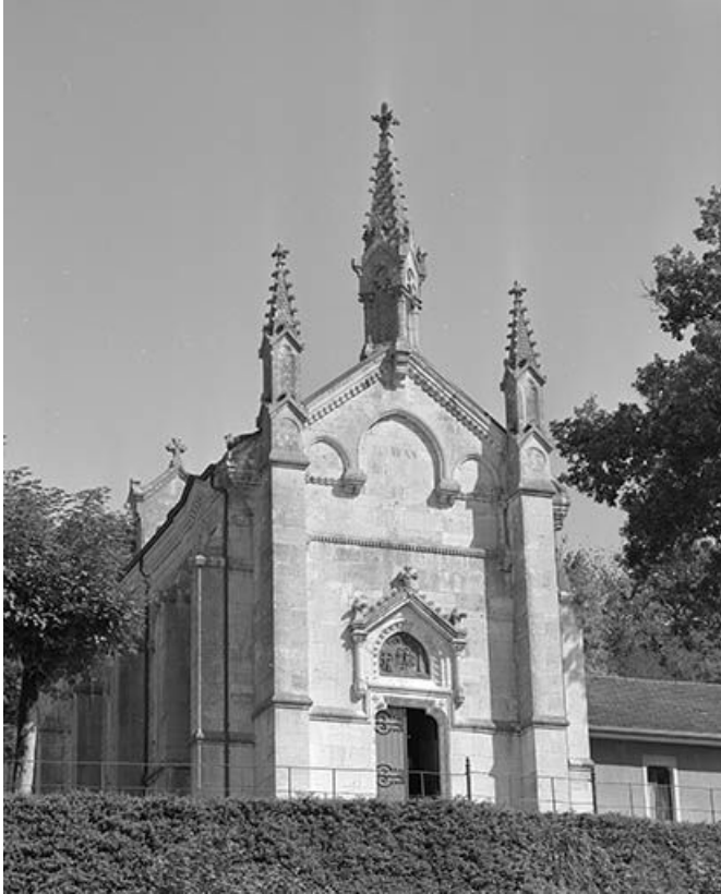
Façade antérieure vue de trois quarts gauche. 25, Scey-Maisières, lieudit : Maisières-Notre-Dame