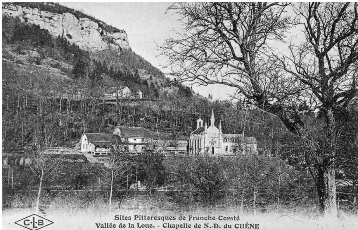
Sites pittoresques de Franche-Comté. Vallée de la Loue. - Chapelle de N.-D. du Chêne, limite 19e siècle 20e siècle. 25, Scey-Maisières, lieudit : Maisières-Notre-Dame

Carte postale, s.d. [limite 19e siècle 20e siècle], C. Lardier éd., Besançon. Lieu de conservation : Collection particulière