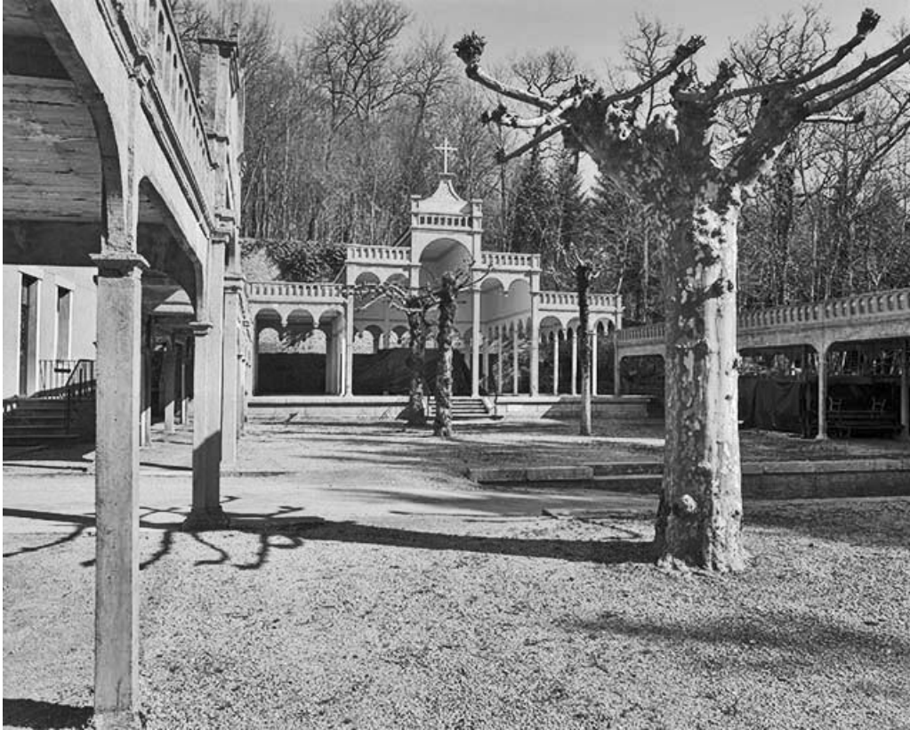
Vue générale de la chapelle de plein air.

25, Sceaux-Maisières, lieudit : Maisières-Notre-Dame