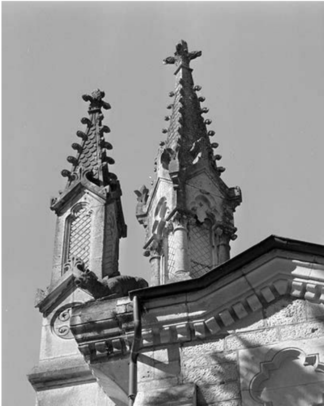
Façade antérieure, détail : les clochetons.

25, Sceaux-Maisières, lieudit : Maisières-Notre-Dame