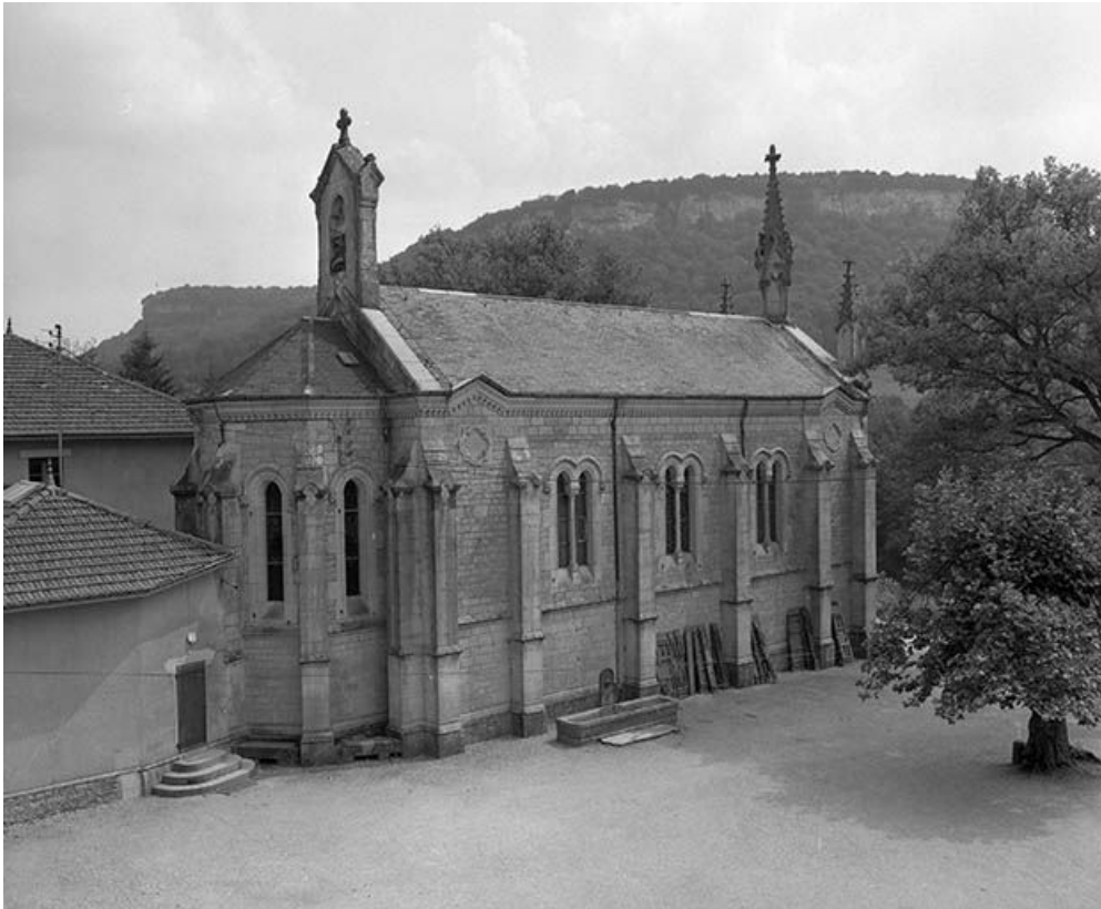
Face latérale gauche et chevet.

25, Scey-Maisières, lieudit : Maisières-Notre-Dame