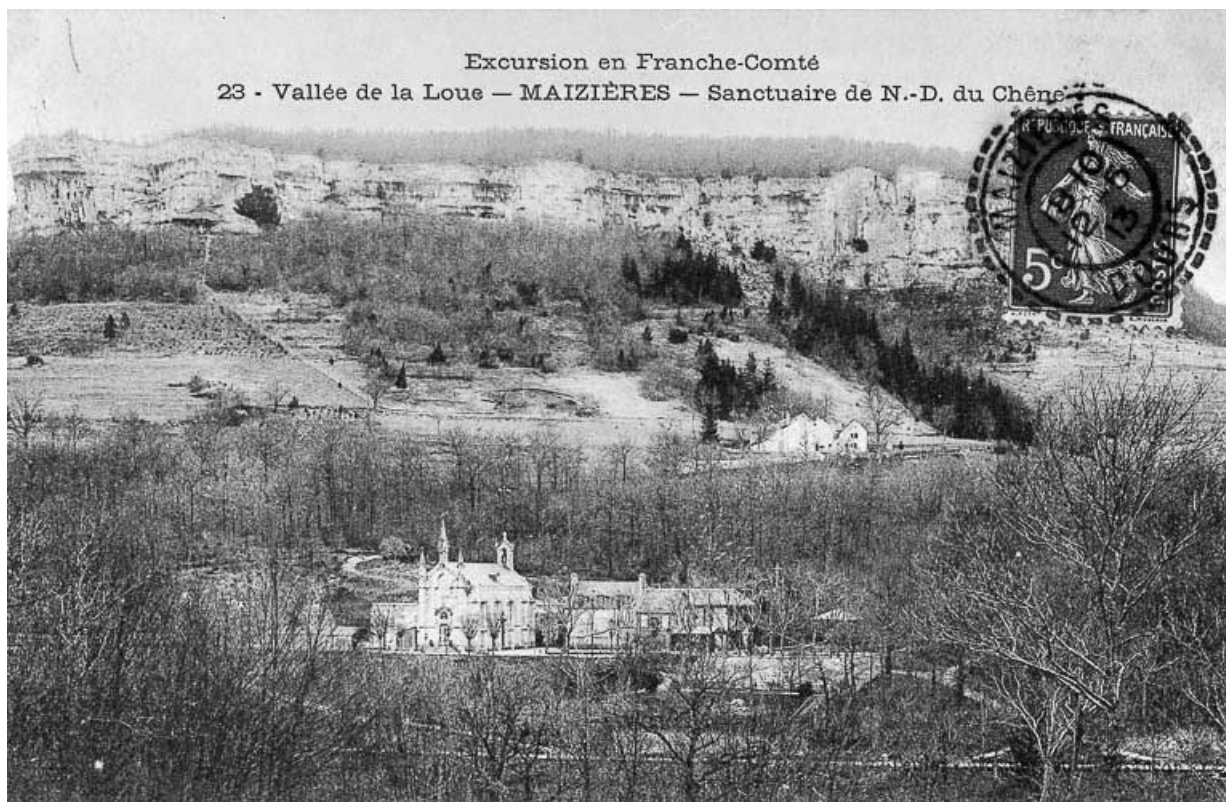
Excursion en Franche-Comté. 23. Vallée de la Loue - Maizières - Sanctuaire de N.-D. du Chêne, limite 19e siècle 20e siècle. 25, Scey-Maisières, lieudit : Maisières-Notre-Dame

Carte postale, s.d. [limite 19e siècle 20e siècle].