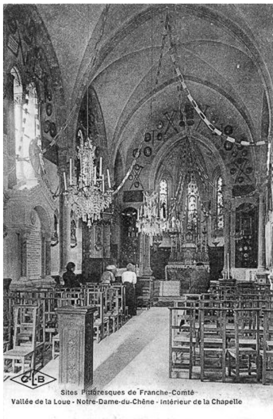
Sites pittoresques de Franche-Comté. Vallée de la Loue. Notre-Dame du Chêne - Intérieur de la Chapelle, limite 19e siècle 20e siècle.

25, Scey-Maisières, lieudit : Maisières-Notre-Dame