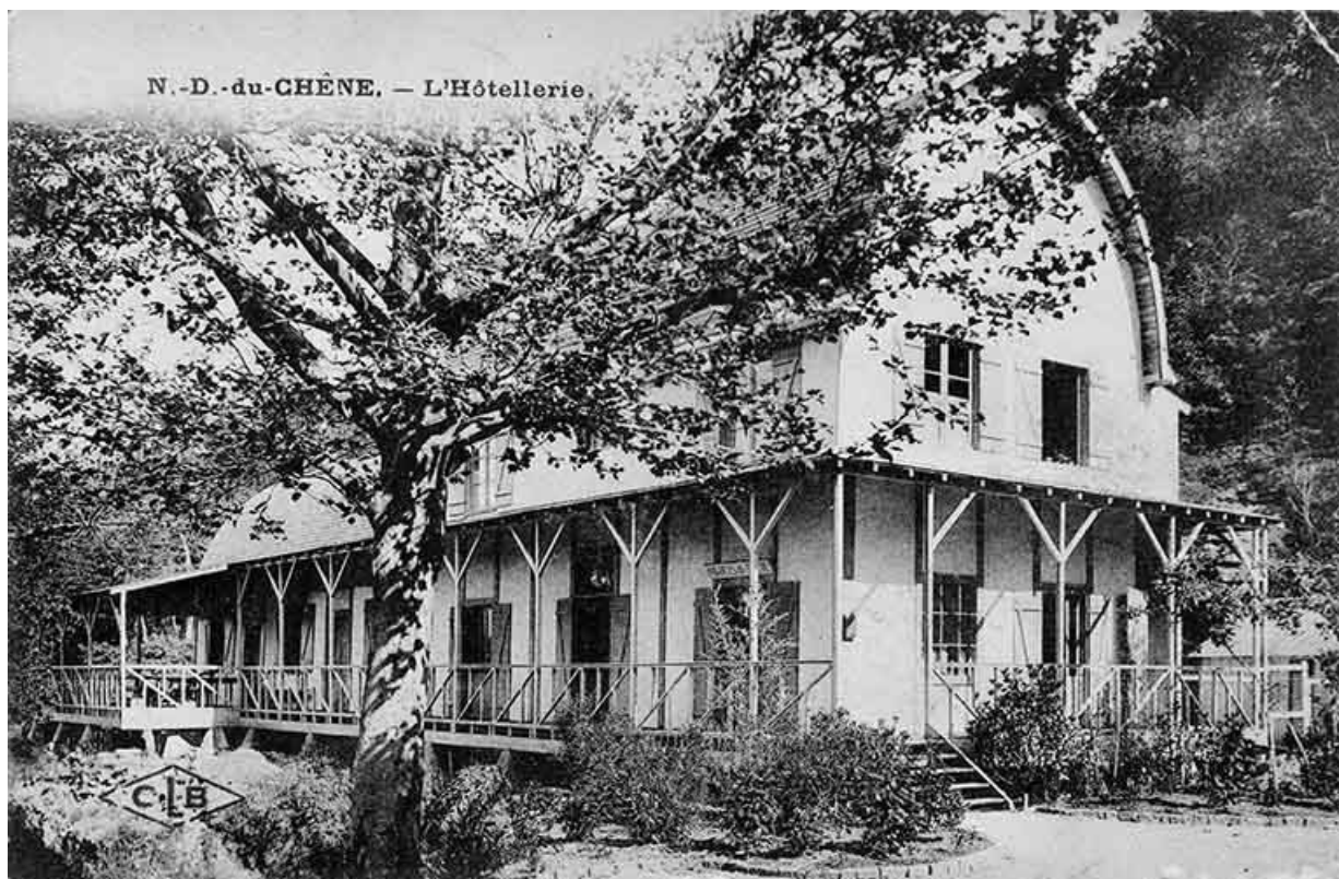
N.-D.-du-Chêne. - L'Hôtellerie, limite 19e siècle 20e siècle.

25, Scey-Maisières, lieudit : Maisières-Notre-Dame