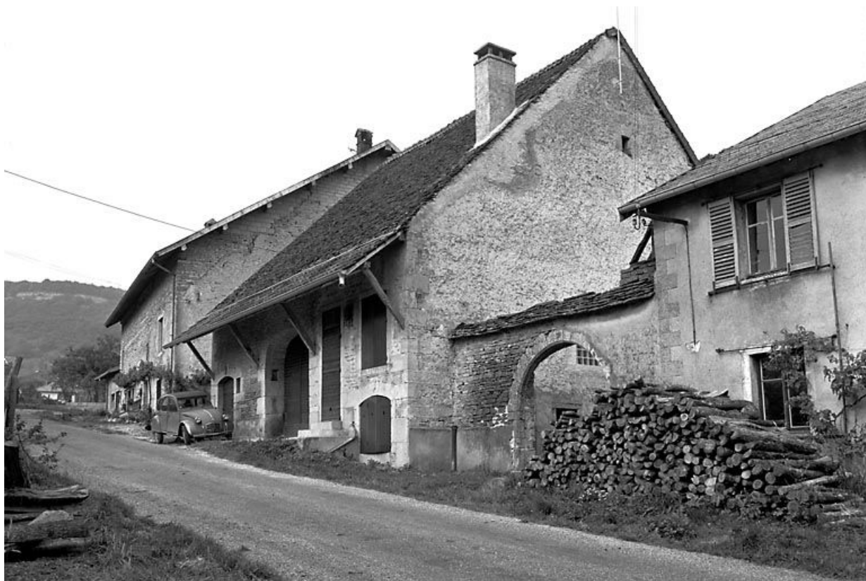
Façade antérieure vue de trois quart droit. 25, Scey-Maisières