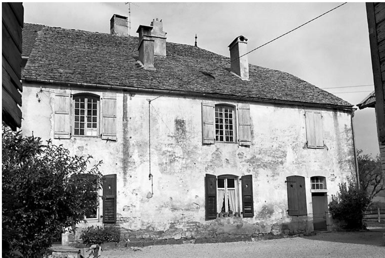
Façade antérieure. 25, Scey-Maisières