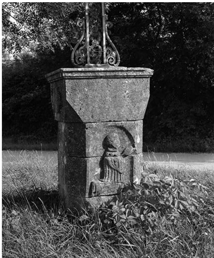
Détail du soubassement : relief semi-méplat représentant un personnage en prière. 25, Saules chemin de Ceinture