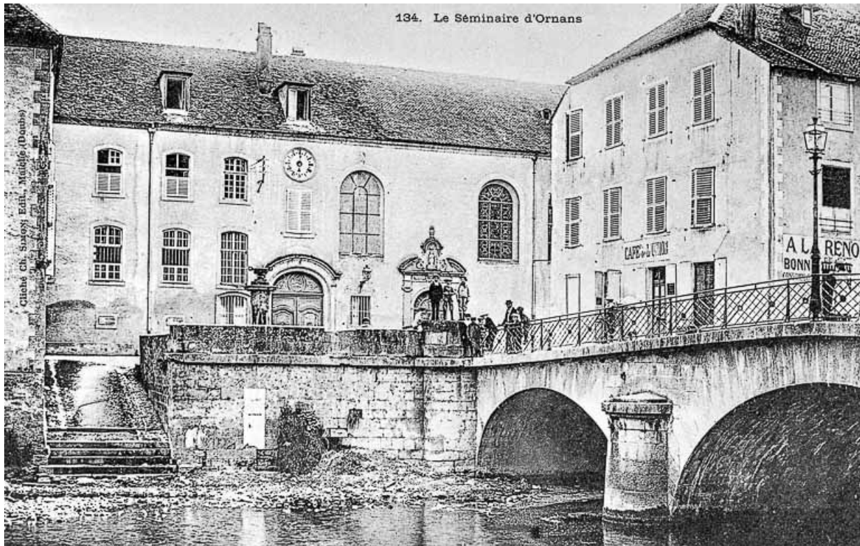
Le séminaire d'Ornans, limite 19e siècle 20e siècle. 25, Ornans, 1 rue Saint-Laurent