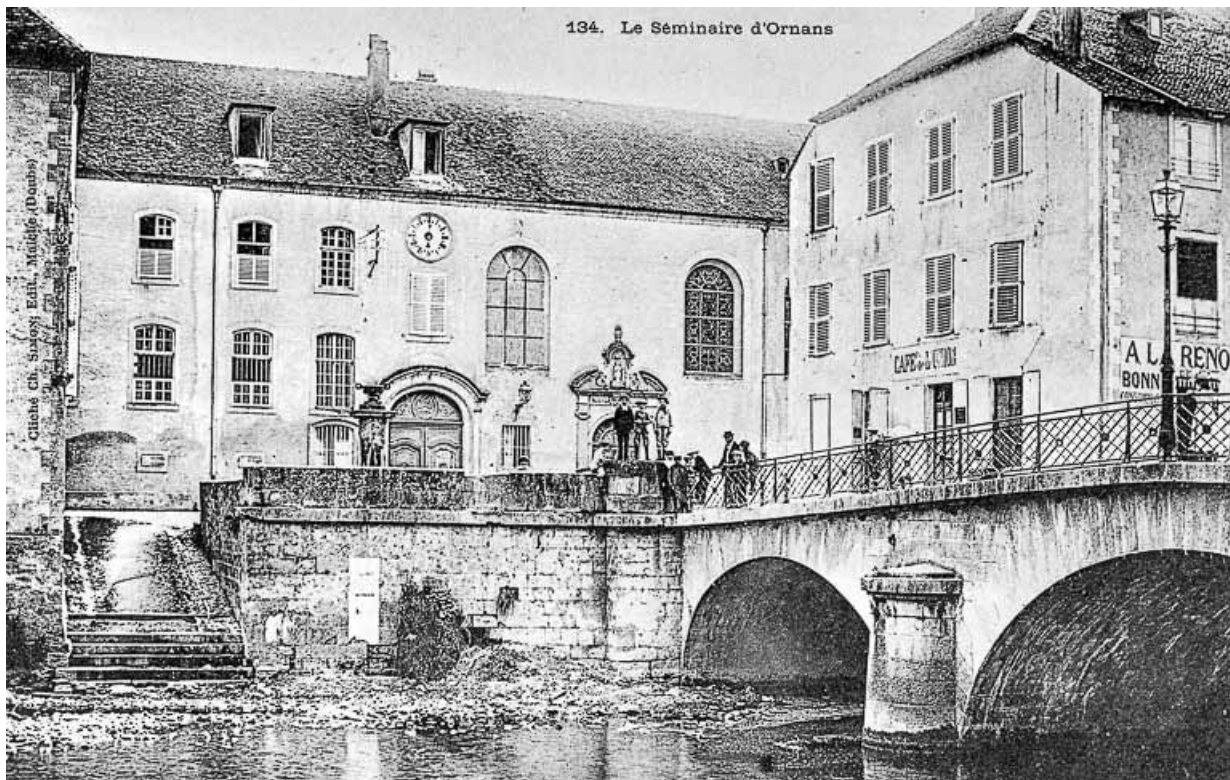
Le séminaire d'Ornans, limite 19e siècle 20e siècle. 25, Ornans, 1 rue Saint-Laurent