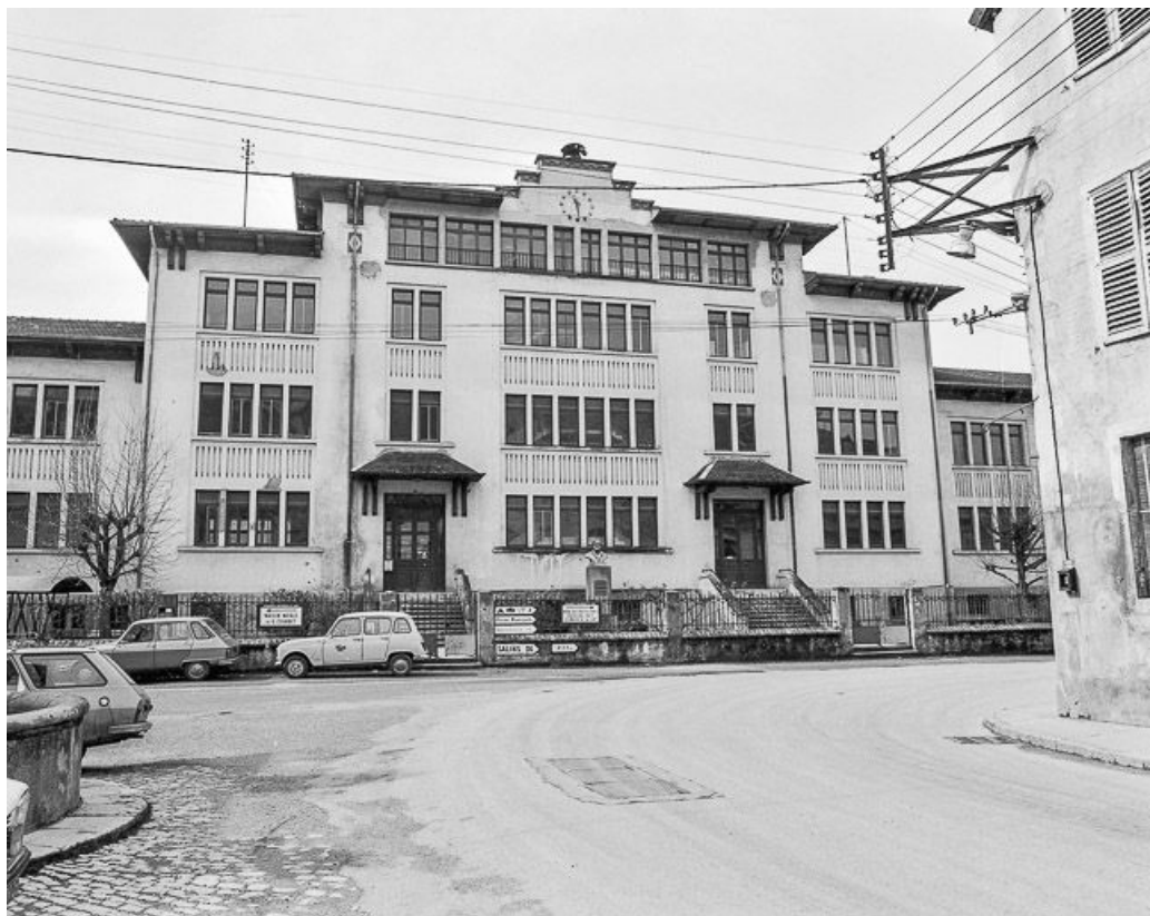
Vue d'ensemble (bâtiment détruit).