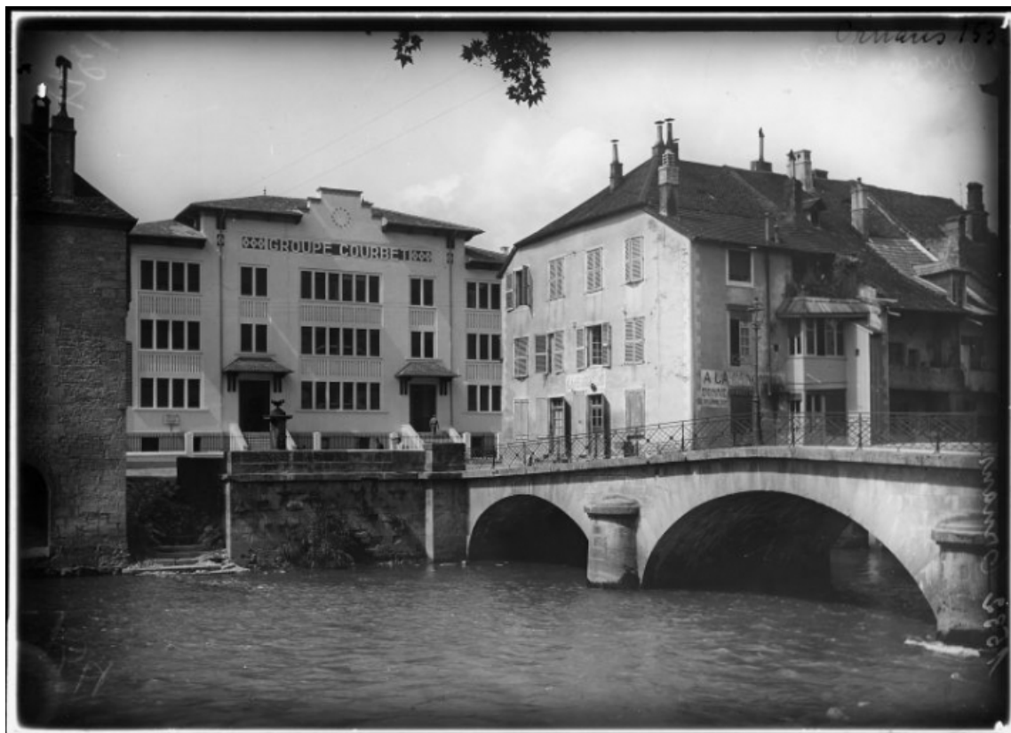
Vue de situation [1re moitié 20e siècle]. 25, Ornans, 1 rue Saint-Laurent