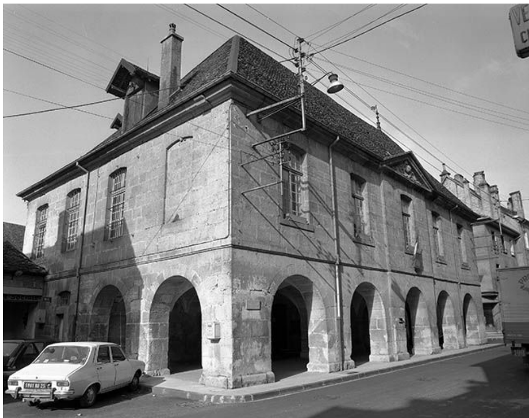
Façade antérieure et face latérale gauche.