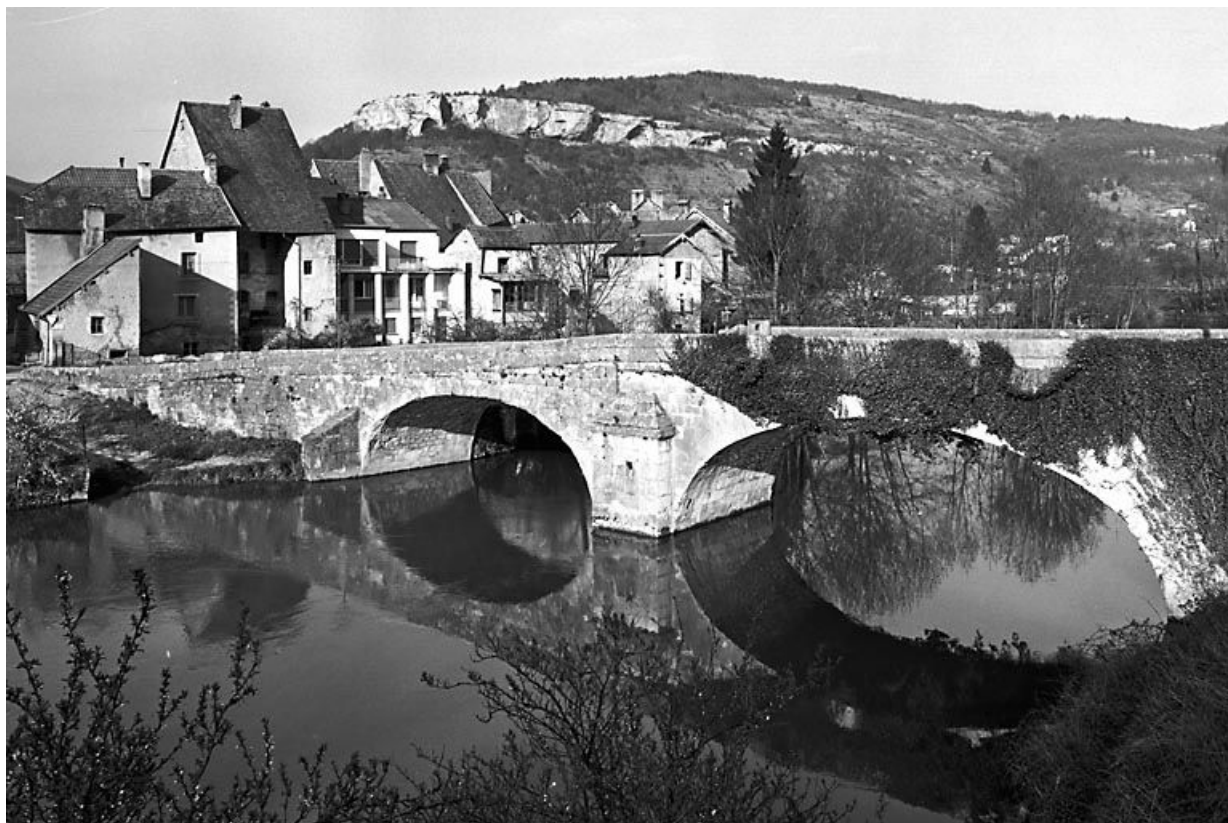
Vue générale de trois quarts depuis la rive gauche. 25, Ornans