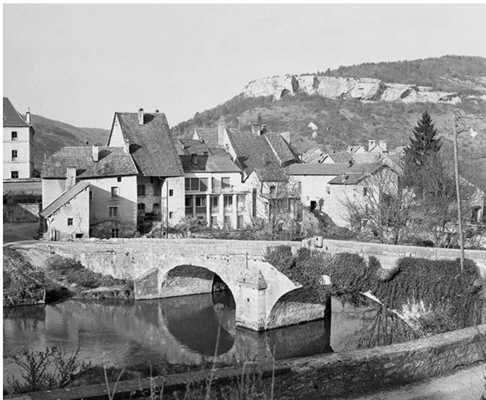
Vue de trois quarts depuis la rive gauche. 25, Ornans