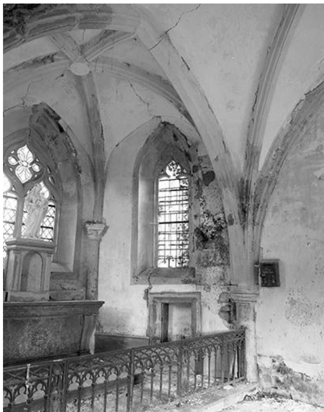
Intérieur de la chapelle : le choeur vu de trois quarts gauche.