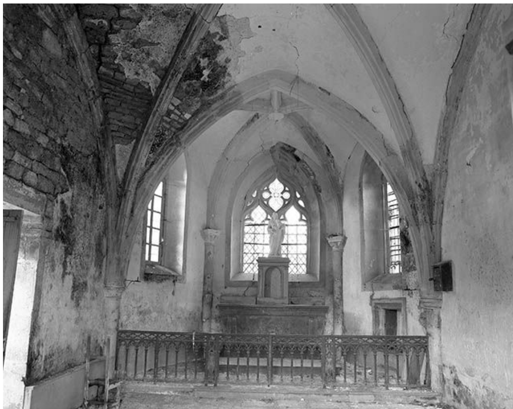
Intérieur de la chapelle : le chœur.