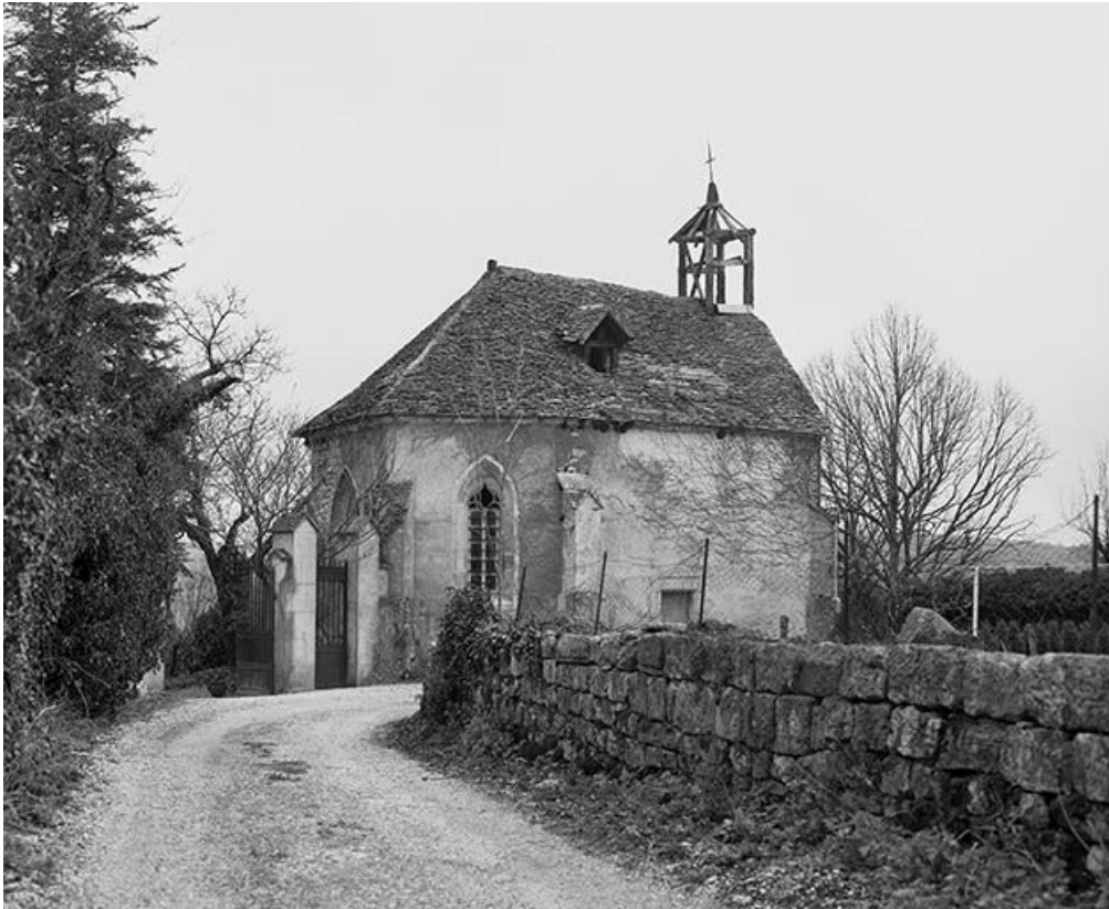
Chapelle, chevet et face latérale gauche.