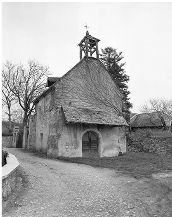
Chapelle, façade antérieure et face latérale gauche.