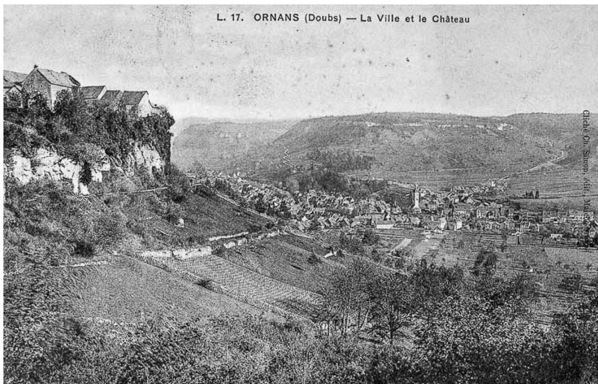
Ornans (Doubs) - La Ville et le Château, limite 19e siècle 20e siècle.