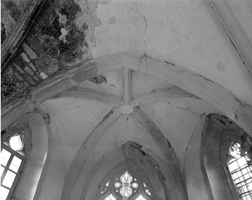
Intérieur de la chapelle : voûte du choeur.