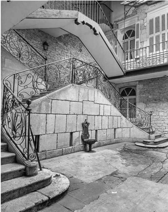
Escalier sur cour.