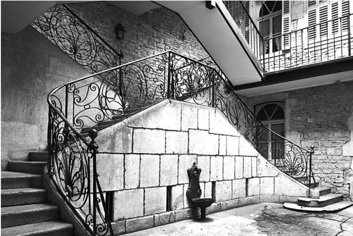
Les deux premiers niveaux de l'escalier sur cour.