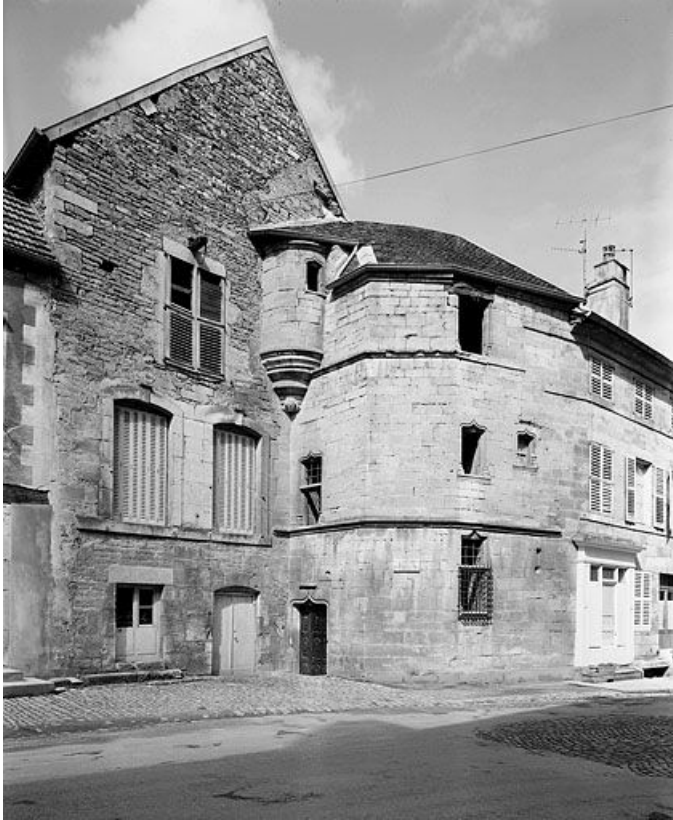
Façade antérieure, vue de trois quarts gauche.