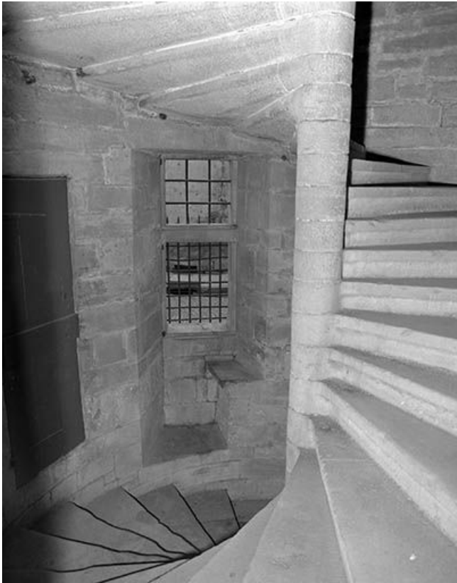
Intérieur : escalier baie du rez-de-chaussée.