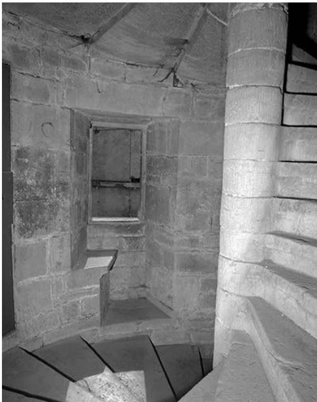
Intérieur : escalier baie du 1er étage avec volet fermé.