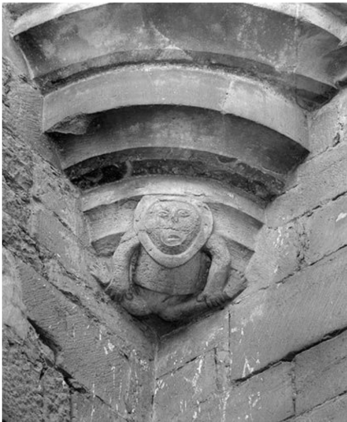
Façade antérieure, détail : cul de four de la tourelle d'angle. 25, Ornans, 30 rue Saint-Laurent