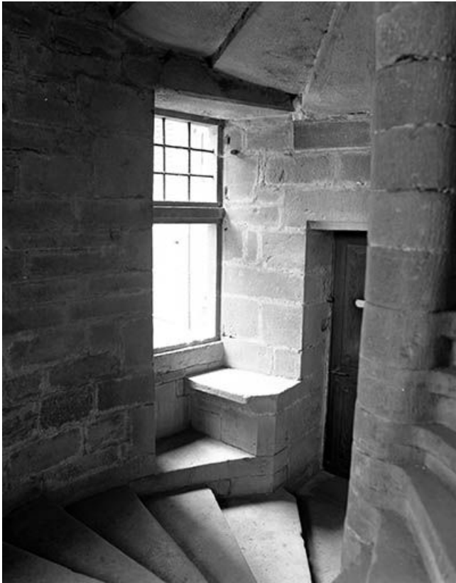
Intérieur : escalier baie du 1er étage au-dessus de la porte d'entrée. 25, Ornans, 30 rue Saint-Laurent