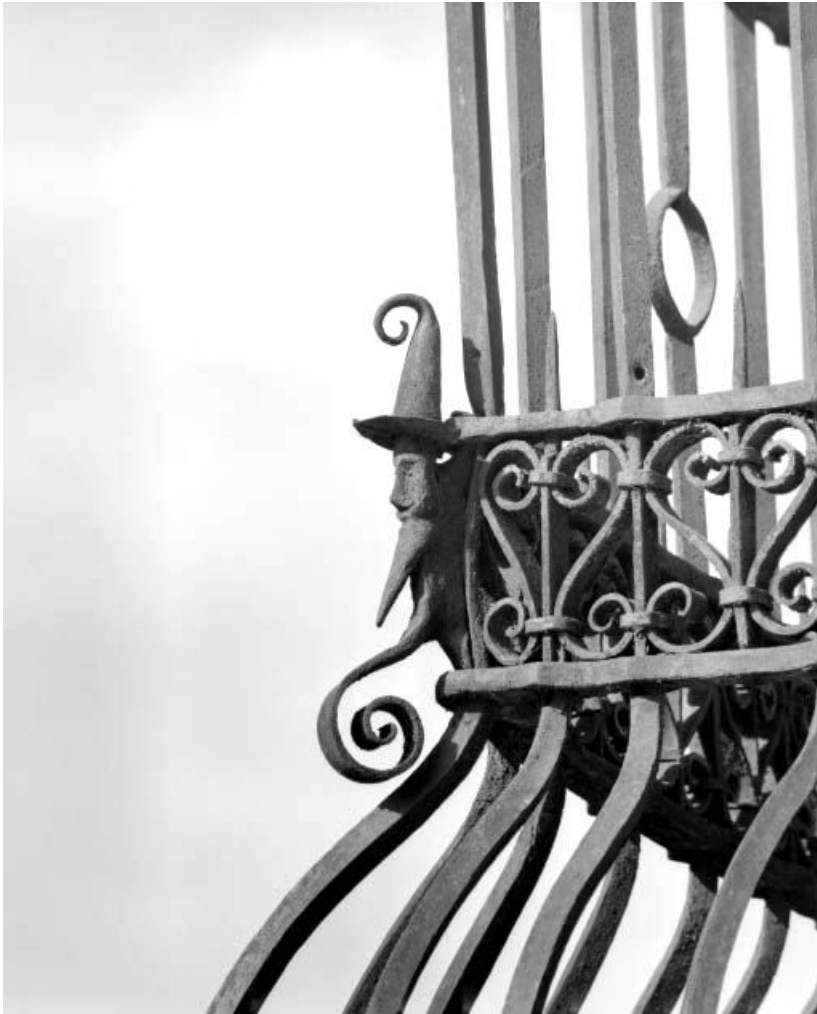
Façade antérieure, détail de la baie d'angle du rez-de-chaussée.