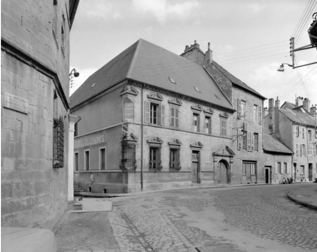
Façade antérieure et façade latérale gauche.