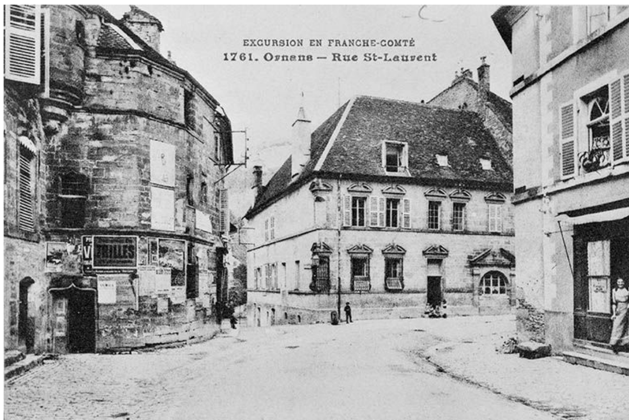
Excursion en Franche-Comté. Ornans - Rue St-Laurent, limite 19e siècle 20e siècle.