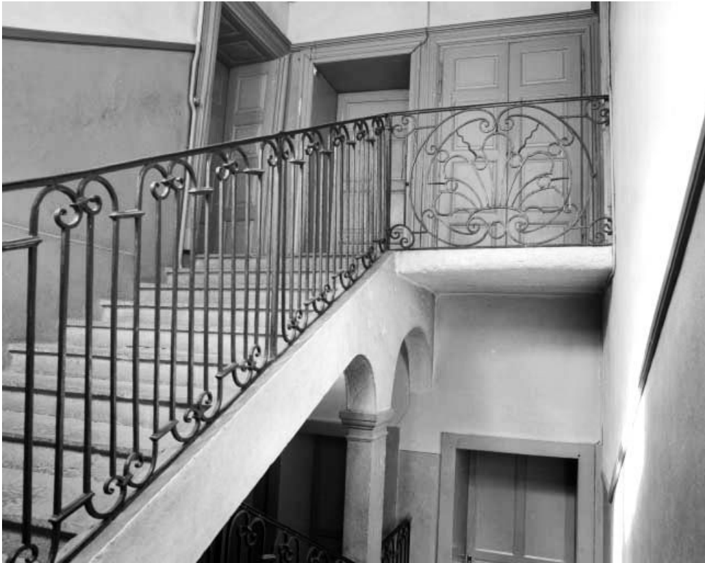
Intérieur : vue générale de l'escalier.