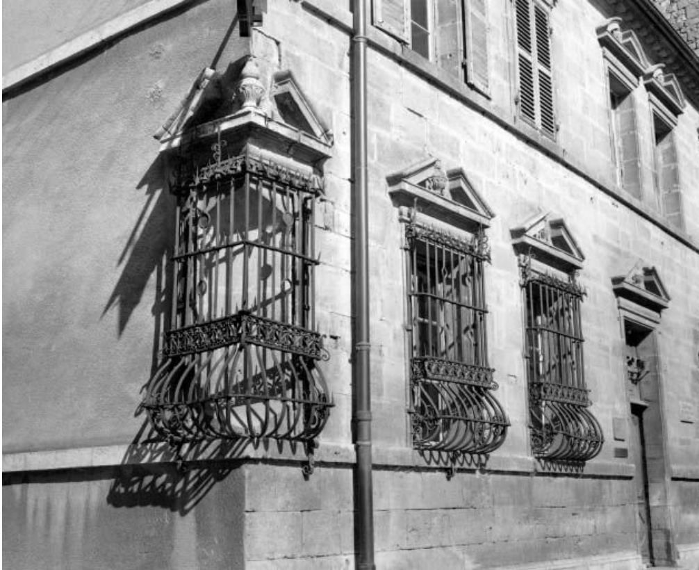
Façade antérieure, détail : baies du rez-de-chaussée, vue de trois quarts gauche.