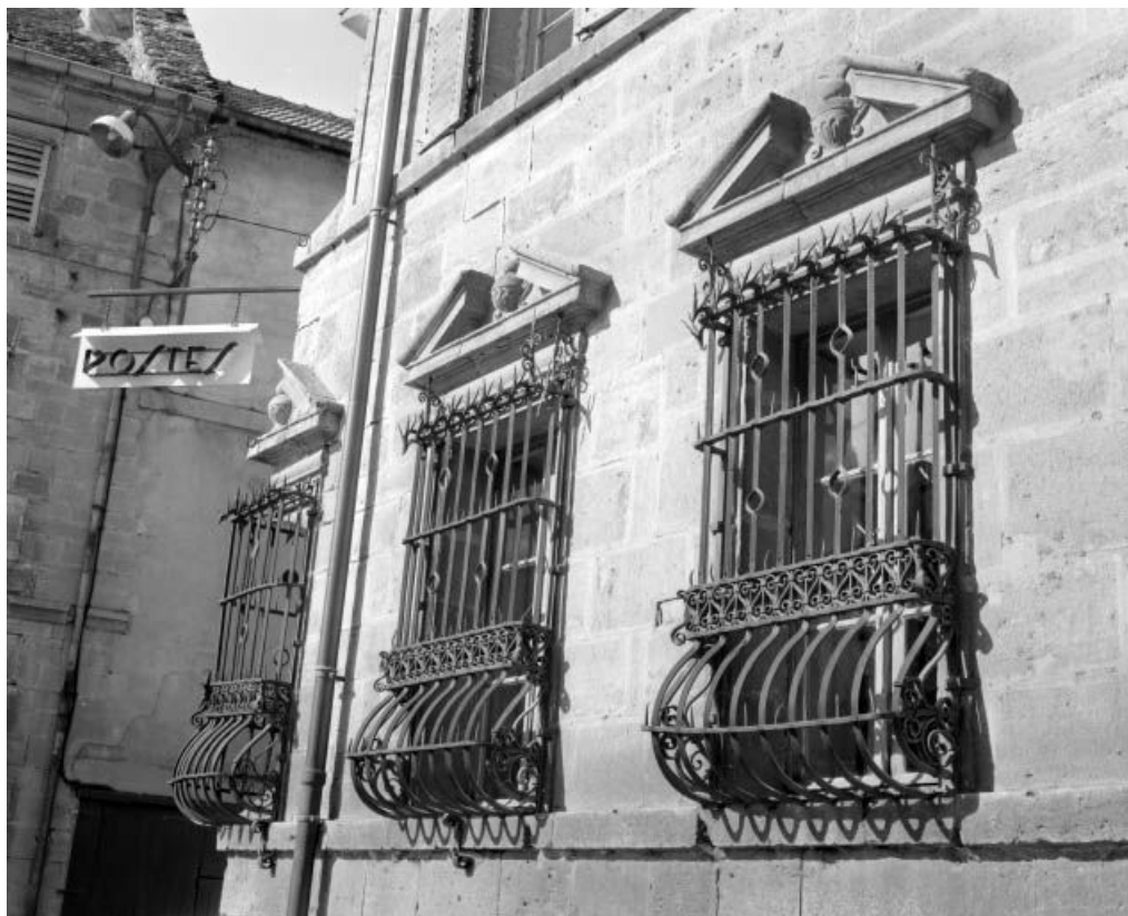
Façade antérieure, détail : baies du rez-de-chaussée, vue de trois quarts droit. 25, Ornans, 26 rue Saint-Laurent