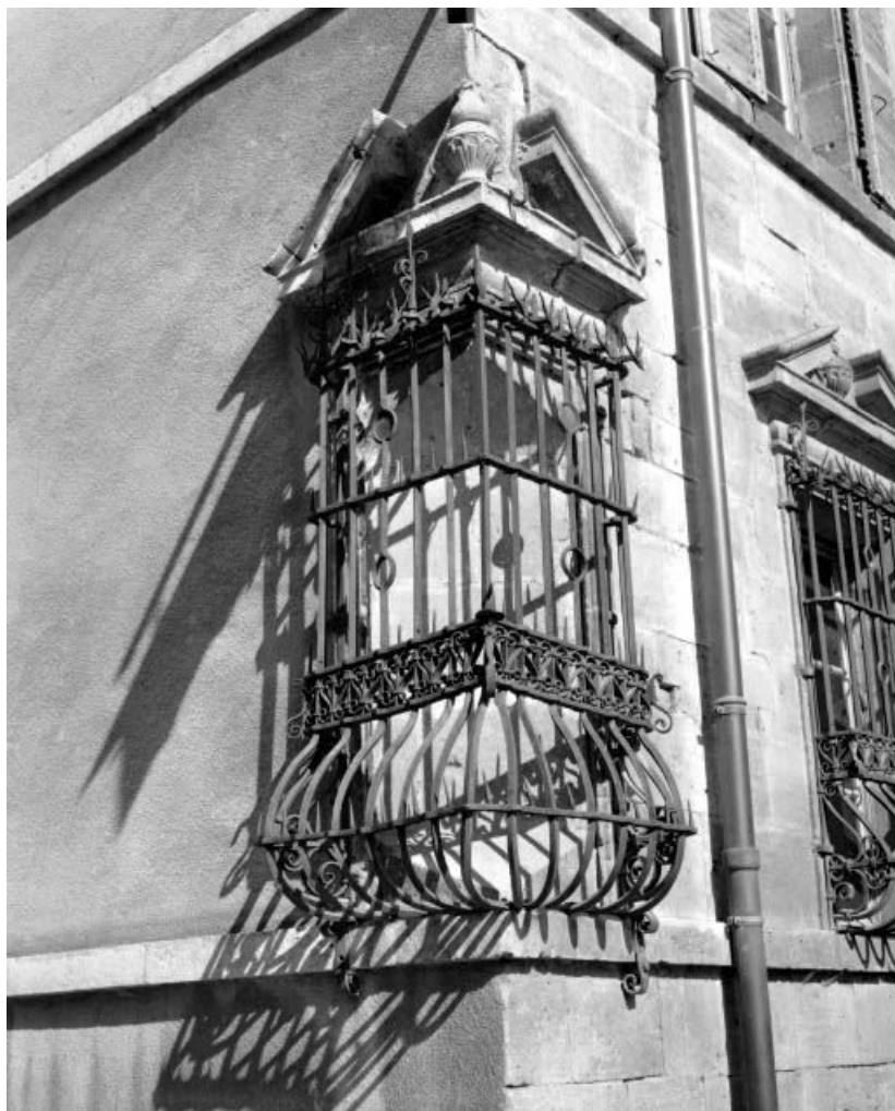
Façade antérieure, détail : baie d'angle du rez-de-chaussée. 25, Ornans, 26 rue Saint-Laurent