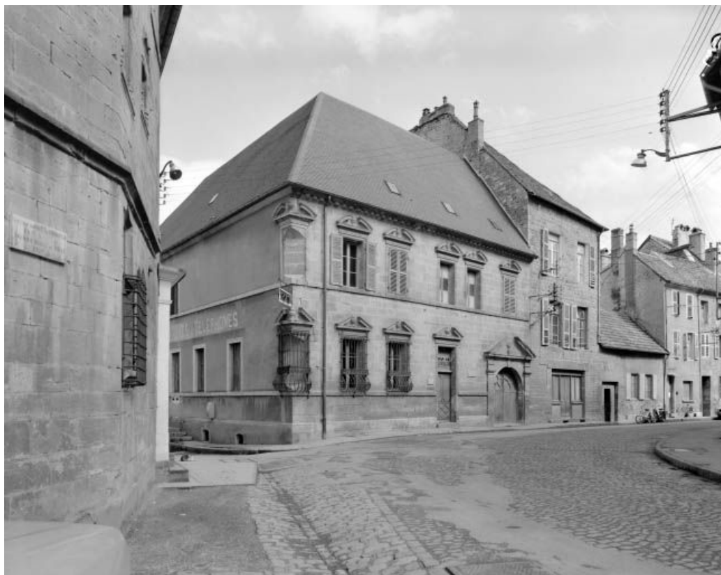
Façade antérieure et façade latérale gauche.