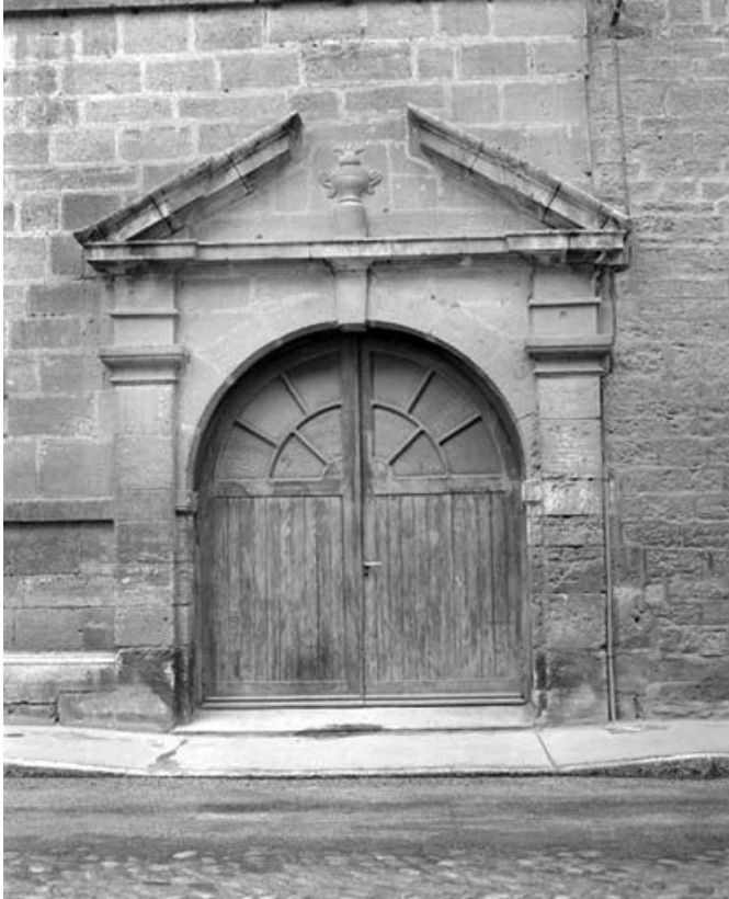
Façade antérieure : porte cochère.