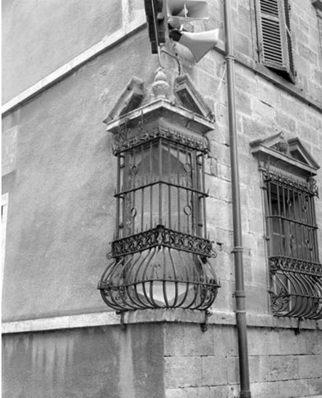
Façade antérieure, détail : baie d'angle et 1ère baie du rez-de-chaussée. 25, Ornans, 26 rue Saint-Laurent