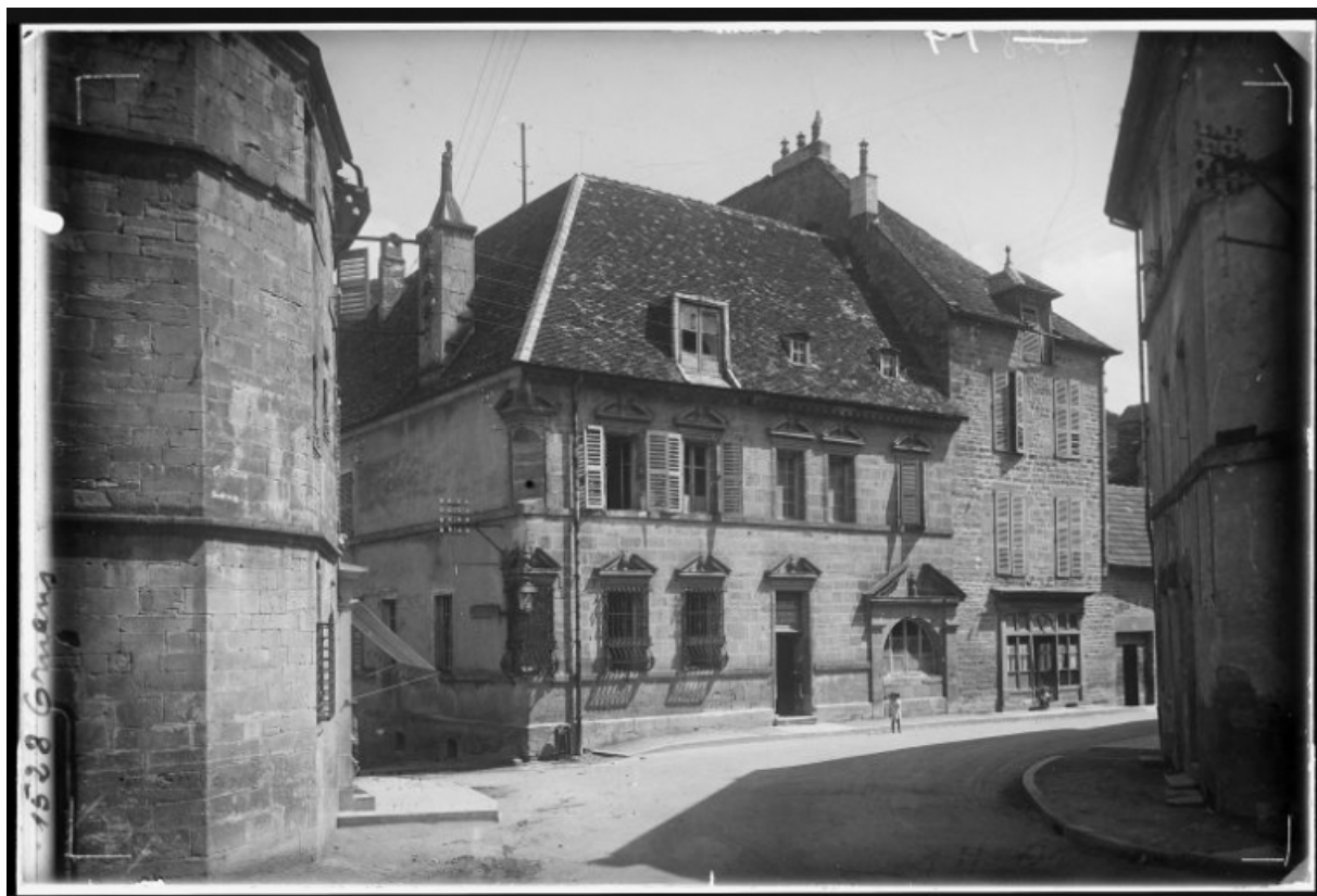
Façade antérieure et façade latérale gauche [1re moitié 20e siècle]. 25, Ornans, 26 rue Saint-Laurent

Ornans (Doubs) : hôtel Sanderet de Valonne. Photographie, [1re moitié 20e siècle] par Jules Manias