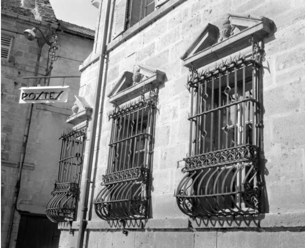
Façade antérieure, détail : baies du rez-de-chaussée, vue de trois quarts droit. 25, Ornans, 26 rue Saint-Laurent