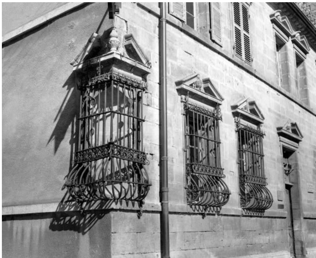
Façade antérieure, détail : baies du rez-de-chaussée, vue de trois quarts gauche. 25, Ornans, 26 rue Saint-Laurent