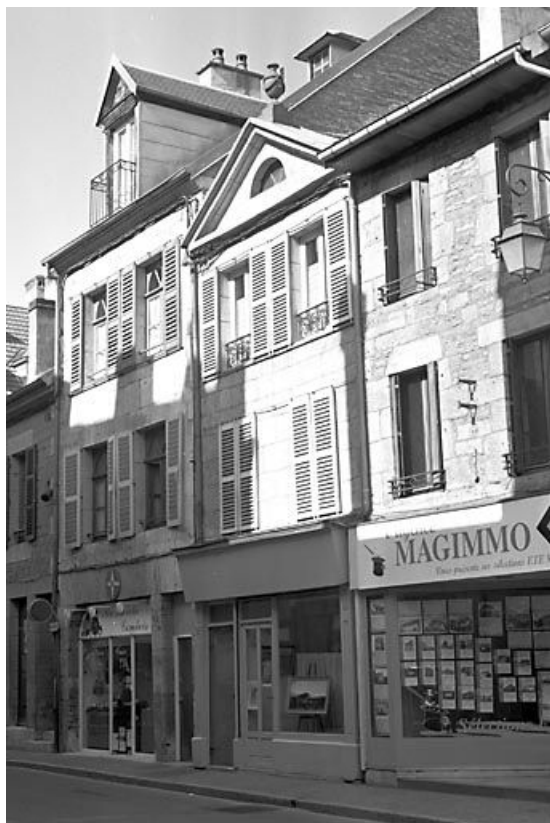
Façade antérieure de trois quarts droit.