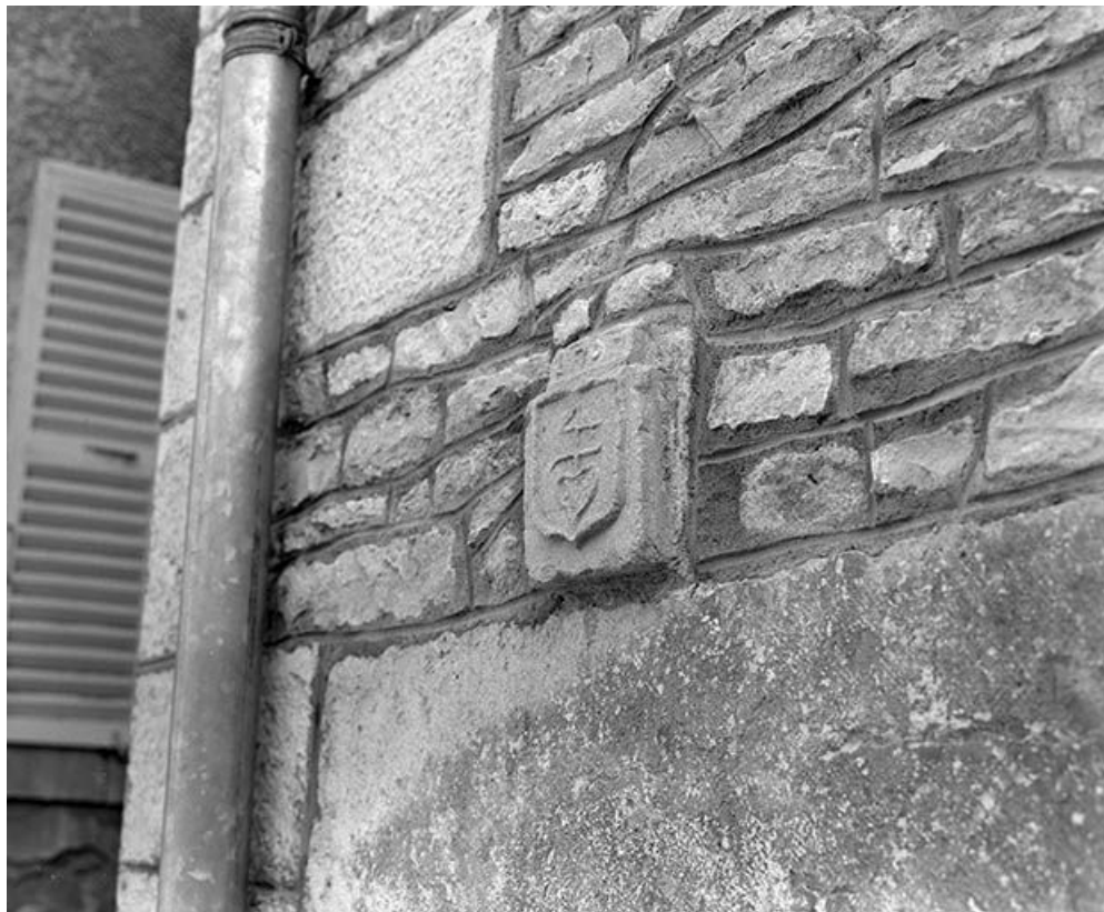
Façade antérieure, détail : écusson.