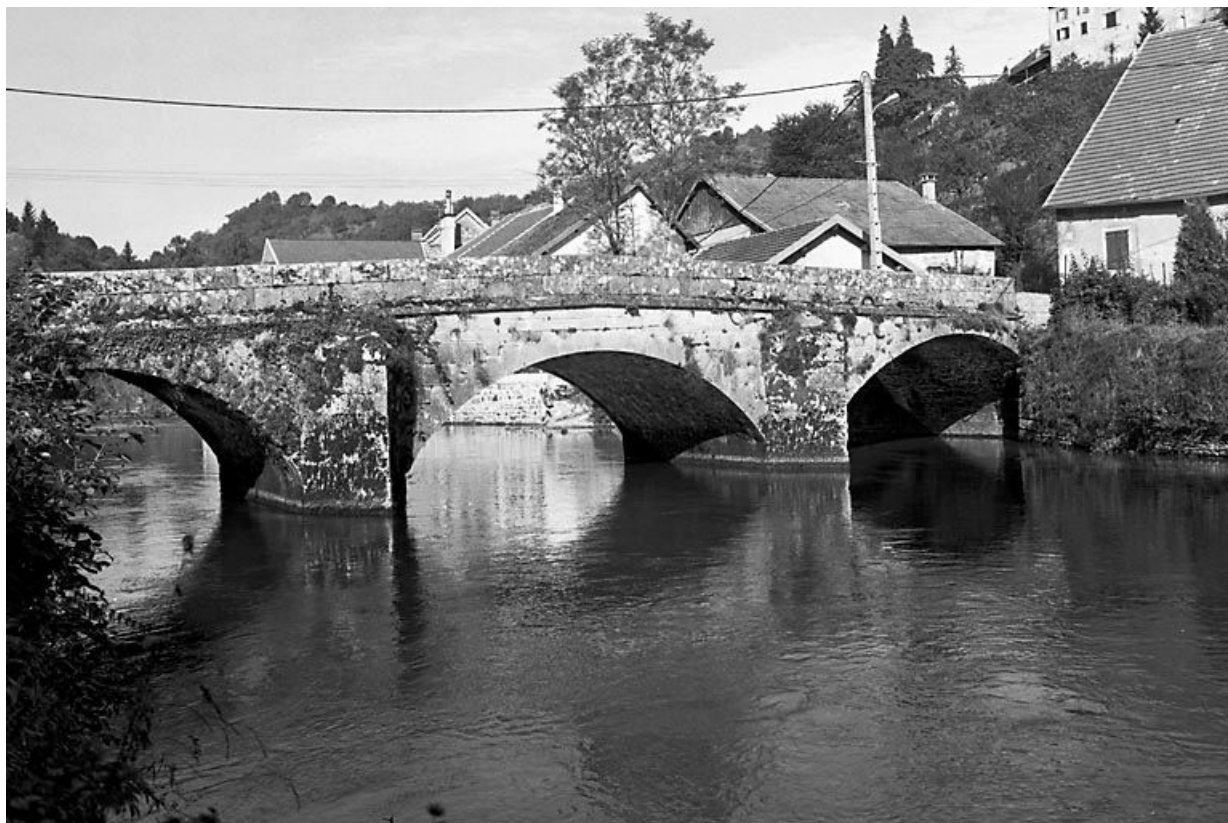
Vue depuis l'amont.