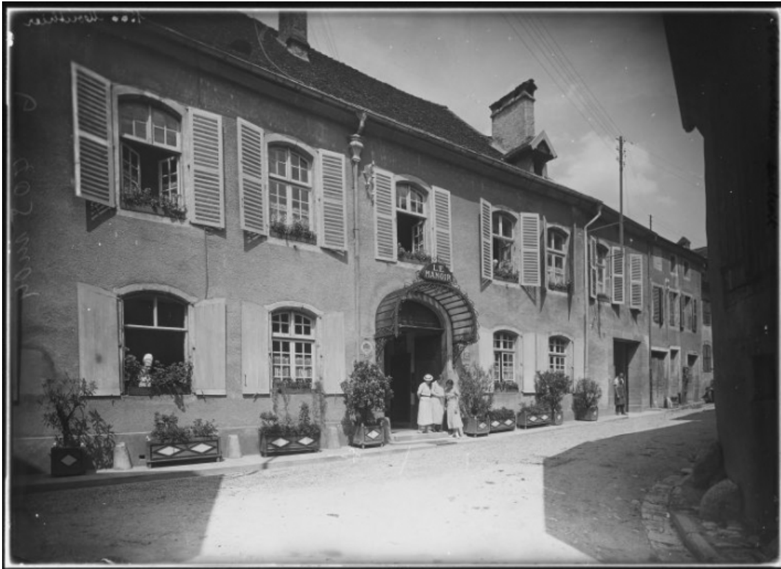
Façade antérieure vue de trois quarts gauche [1re moitié 20e siècle]. 25, Mouthier-Haute-Pierre, 25 Grande Rue