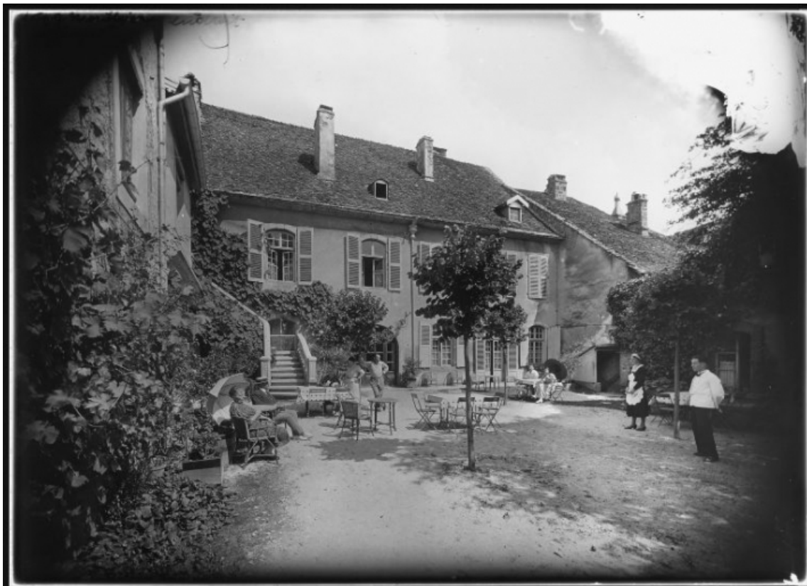
Cour intérieure [1re moitié 20e siècle]. 25, Mouthier-Haute-Pierre, 25 Grande Rue