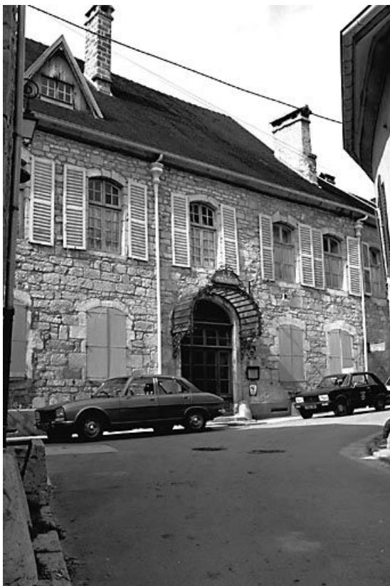
Façade antérieure vue de trois quarts gauche. 25, Mouthier-Haute-Pierre