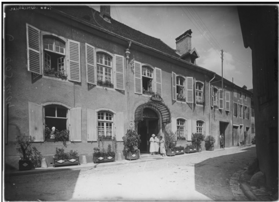
Façade antérieure vue de trois quarts gauche [1re moitié 20e siècle]. 25, Mouthier-Haute-Pierre, 25 Grande Rue