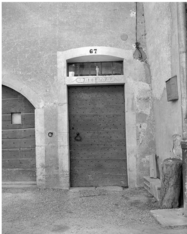
Détail de la façade antérieure : la porte piétonne.

25, Mouthier-Haute-Pierre, 13 rue Robert Dame