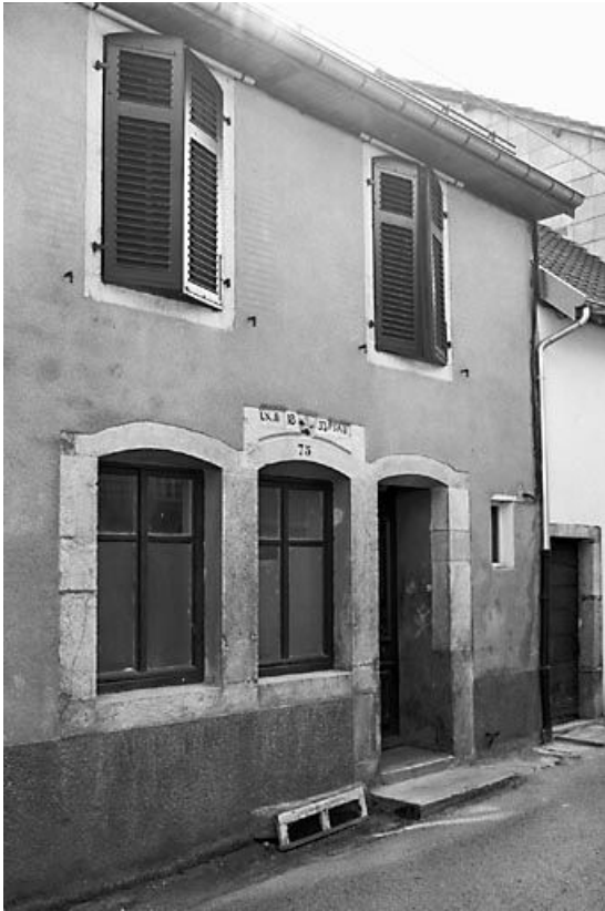
Façade antérieure vue de trois quarts gauche. 25, Mouthier-Haute-Pierre, 21 rue Robert Dame