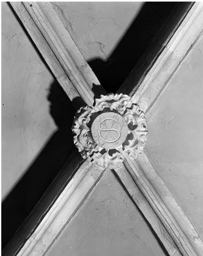
Intérieur : 2ème travée du collatéral gauche, clef annulaire de la chapelle des archers. 25, Mouthier-Haute-Pierre place Césaire Phisalix