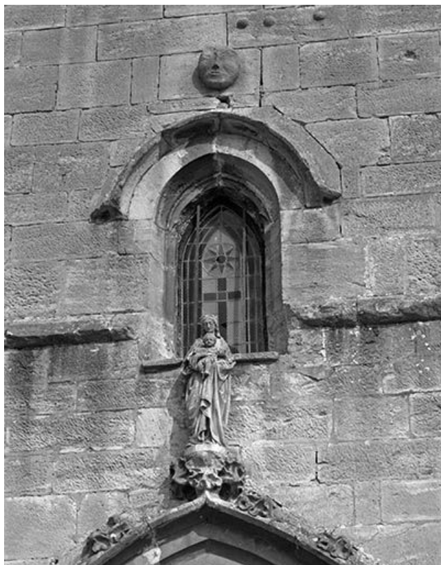
Portail : détail, statue Vierge à l'Enfant.

25, Mouthier-Haute-Pierre place Césaire Phisalix