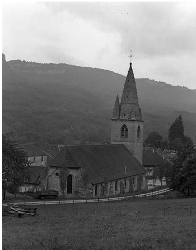
Vue générale depuis le sud-est.

25, Mouthier-Haute-Pierre place Césaire Phisalix