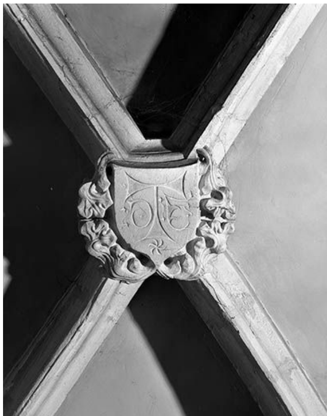
Intérieur : 3ème travée du collatéral droit, clef annulaire de la chapelle Saint Antoine. 25, Mouthier-Haute-Pierre place Césaire Phisalix