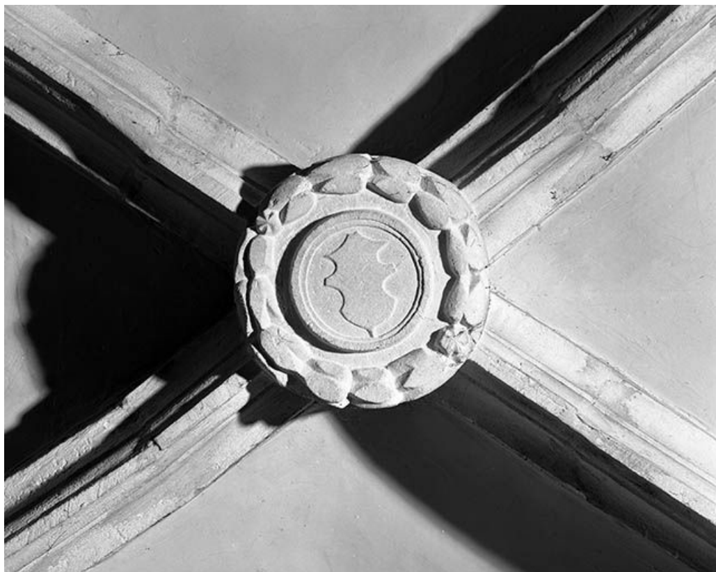
Intérieur : 5ème travée du collatéral droit, clef annulaire de la chapelle des tanneurs. 25, Mouthier-Haute-Pierre place Césaire Phisalix