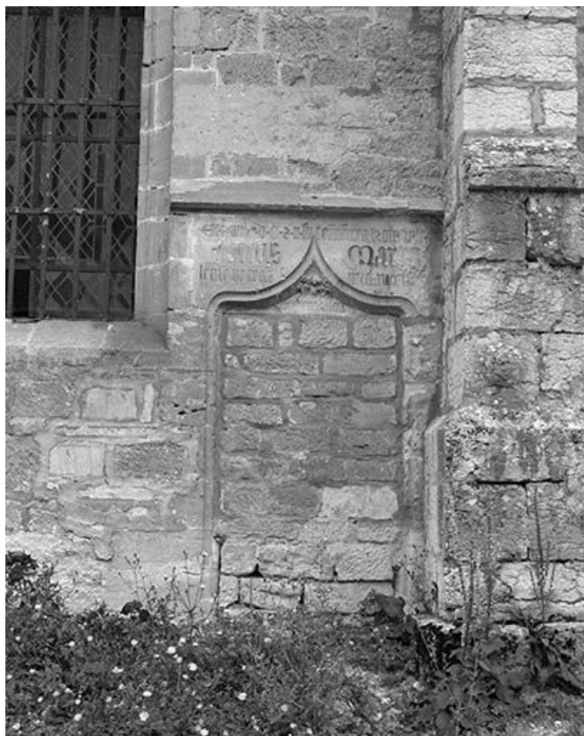
Détail de la face latérale droite : ancienne porte.

25, Mouthier-Haute-Pierre place Césaire Phisalix