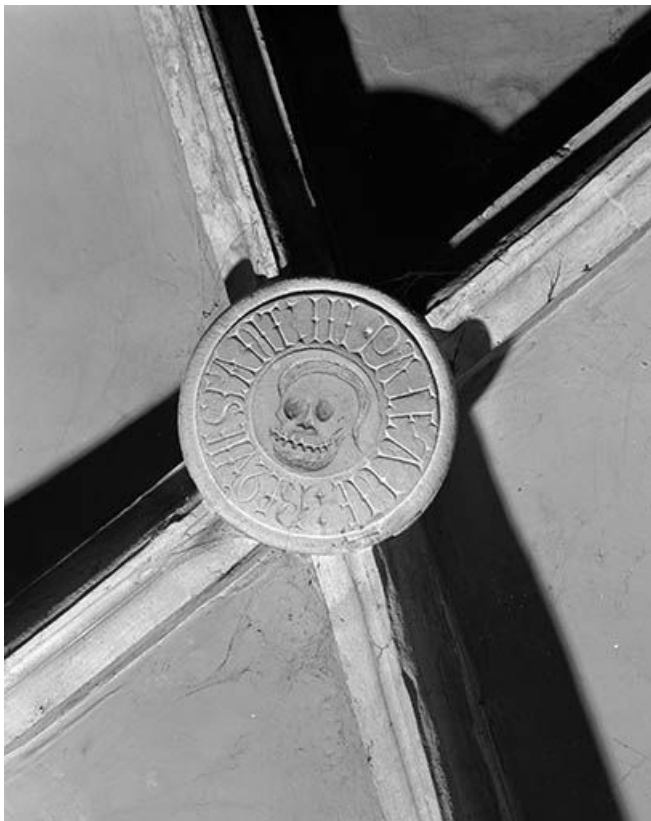
Intérieur : 1ère travée du collatéral gauche, clef annulaire de la chapelle consacrée aux défunts. 25, Mouthier-Haute-Pierre place Césaire Phisalix