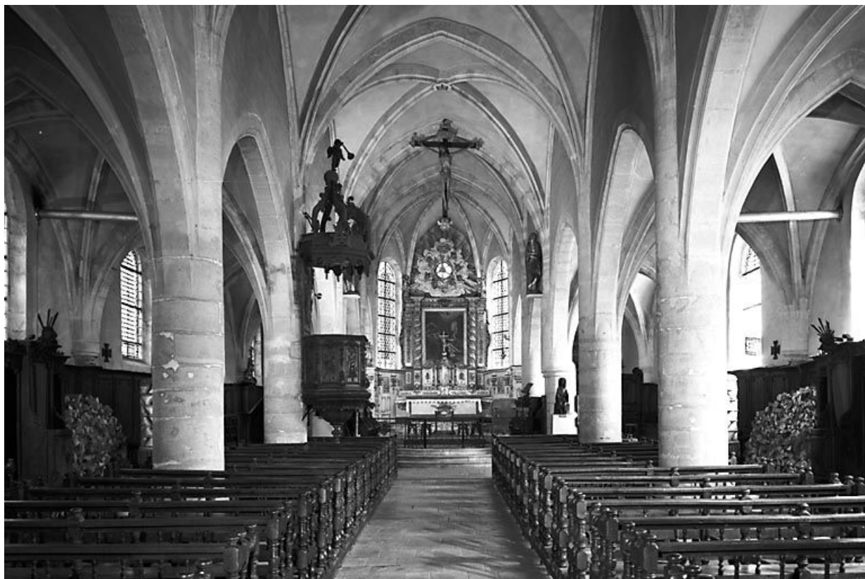
Intérieur : la nef et le choeur vus depuis l'entrée.

25, Mouthier-Haute-Pierre place Césaire Phisalix