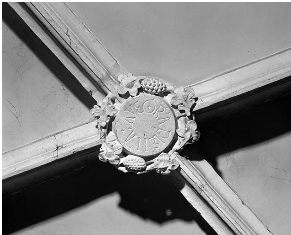
Intérieur : 1ère travée du collatéral droit, clef annulaire de la chapelle de la Vierge. 25, Mouthier-Haute-Pierre place Césaire Phisalix