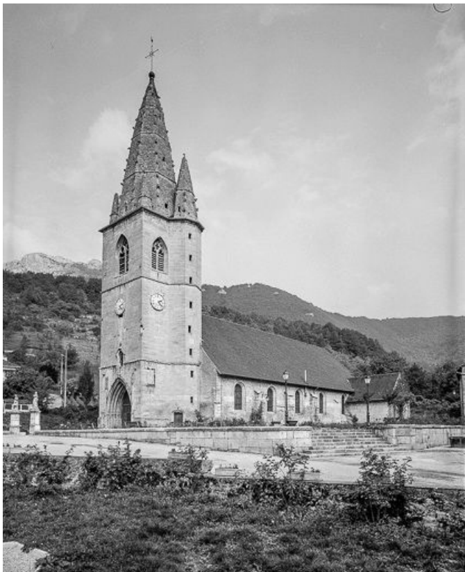
Façade antérieure et face latérale droite.

25, Mouthier-Haute-Pierre place Césaire Phisalix