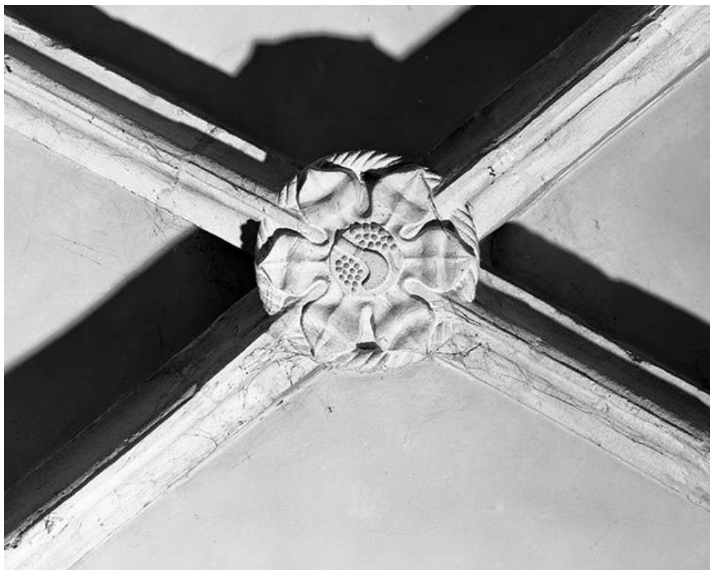
Intérieur : 4ème travée du collatéral droit, clef annulaire de la chapelle des vigneronns. 25, Mouthier-Haute-Pierre place Césaire Phisalix