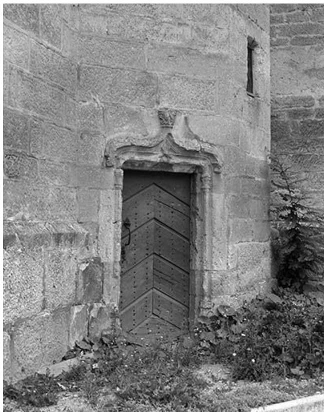
Détail de la tour-clocher : la porte conduisant à l'escalier.

25, Mouthier-Haute-Pierre place Césaire Phisalix