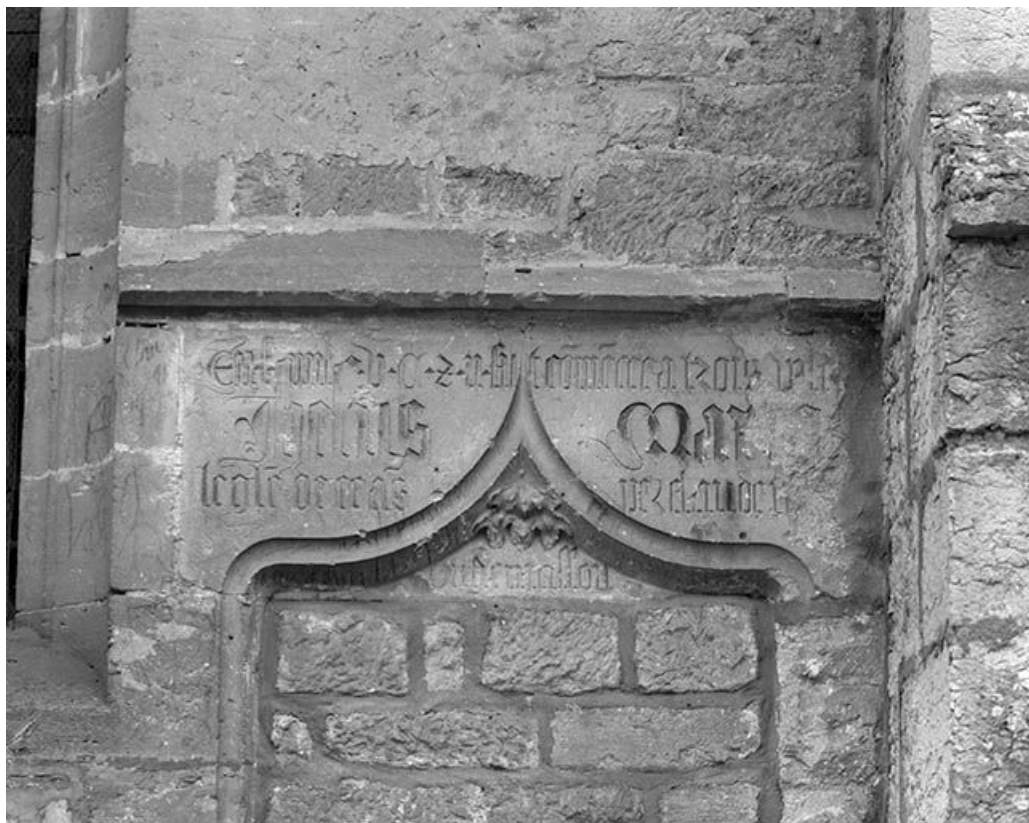
Détail de la face latérale droite : linteau de l'ancienne porte.

25, Mouthier-Haute-Pierre place Césaire Phisalix