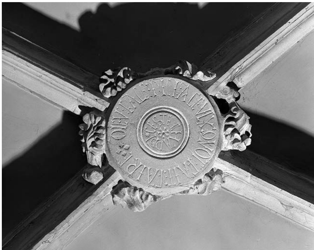
Intérieur : 2ème travée du collatéral droit, clef annulaire ornée de feuilles. 25, Mouthier-Haute-Pierre place Césaire Phisalix