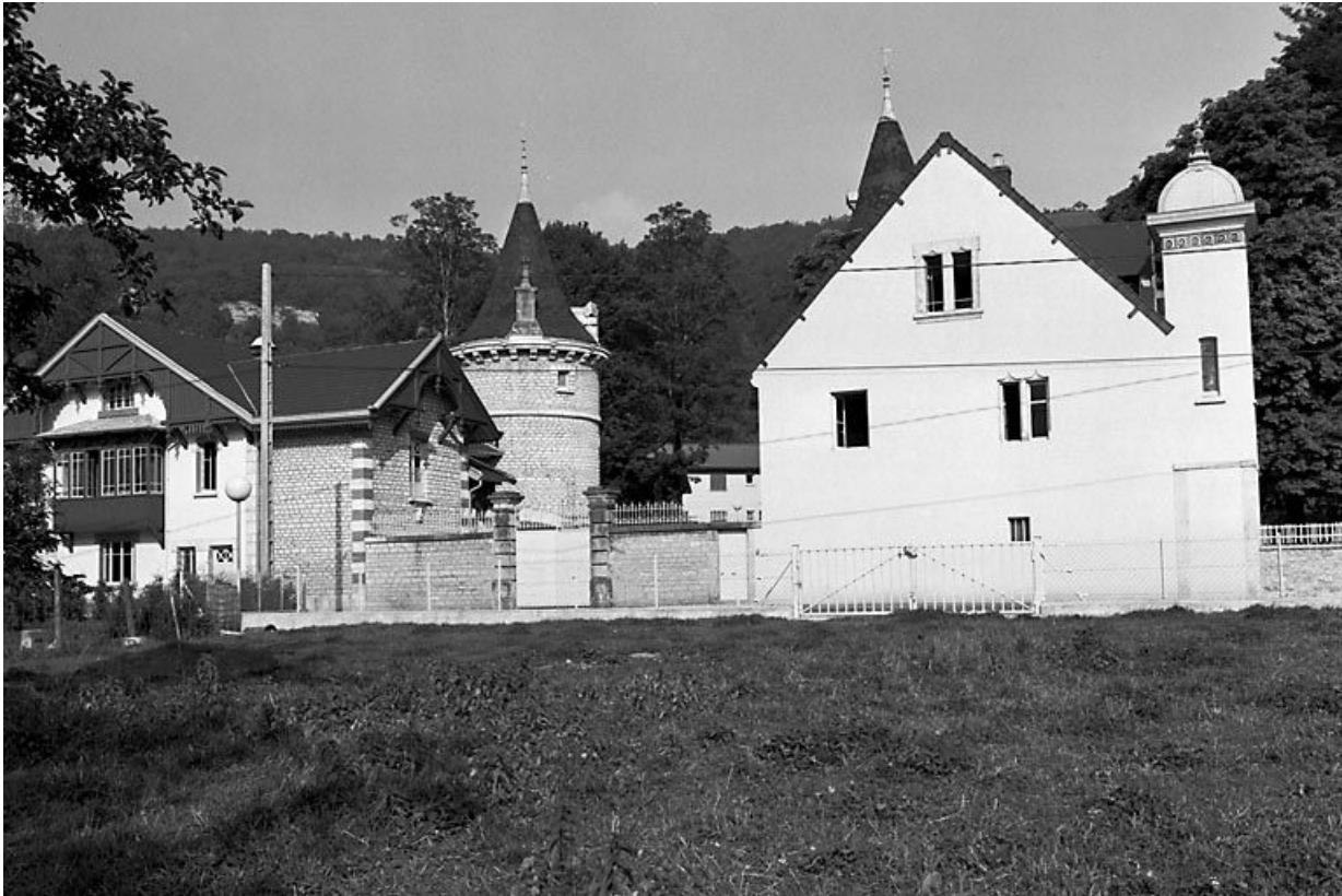
Vue d'ensemble depuis la rue du Mont d'Oeil. 25, Montgesoye