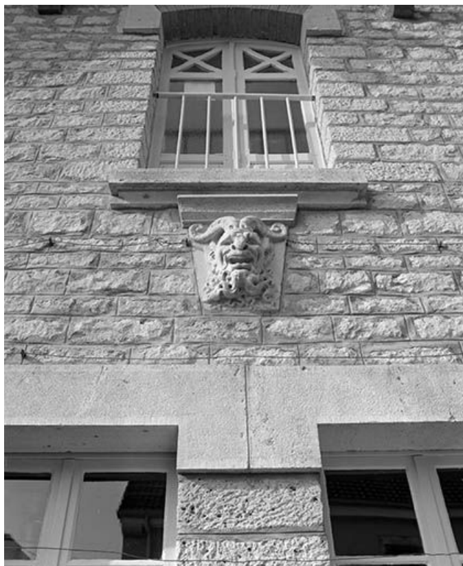
Culot au-dessous de la baie du 1er étage des communs.