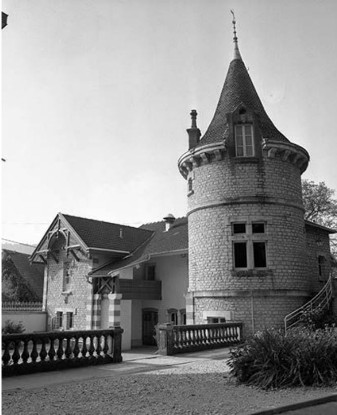
Façade antérieure des communs. 25, Montgesoye rue du Mont d'Oeil