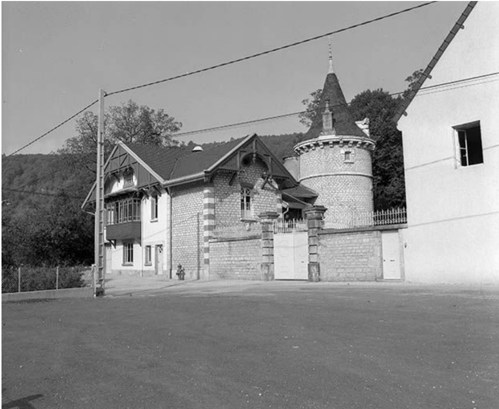
Vue générale des communs depuis la rue du Mont d'Oeil.