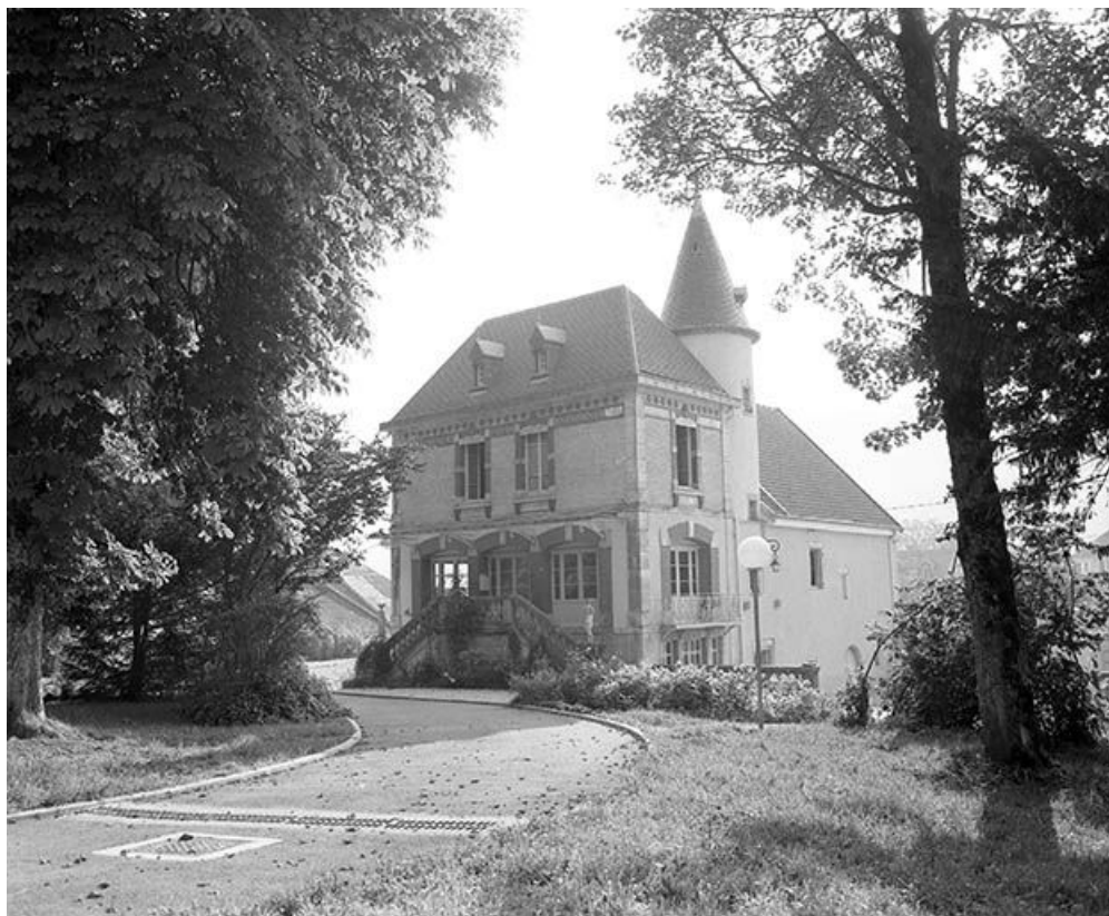
Vue générale du logis depuis le parc.