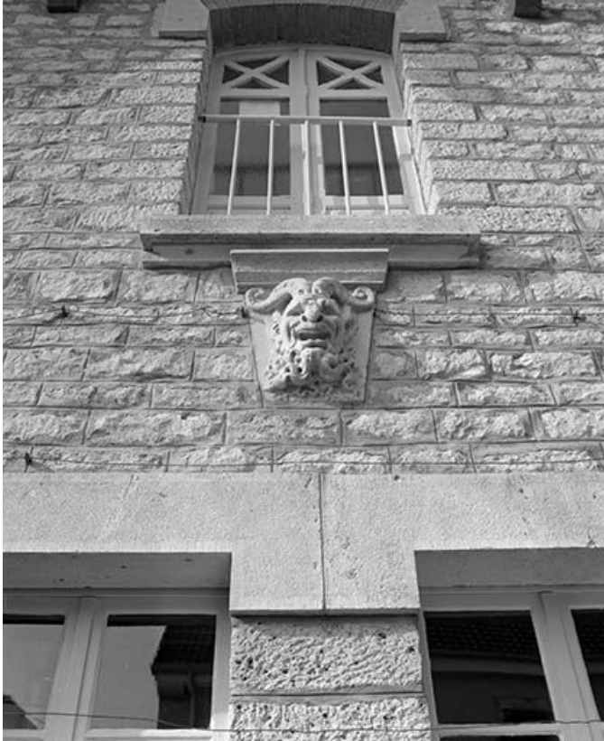
Culot au-dessous de la baie du 1er étage des communs.