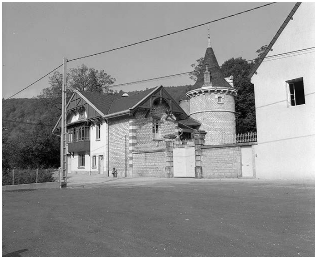
Vue générale des communs depuis la rue du Mont d'Oeil.