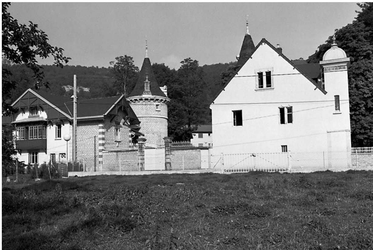
Vue d'ensemble depuis la rue du Mont d'Oeil. 25, Montgesoye