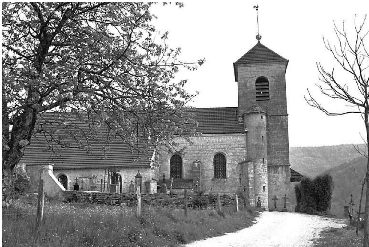
Face latérale gauche.