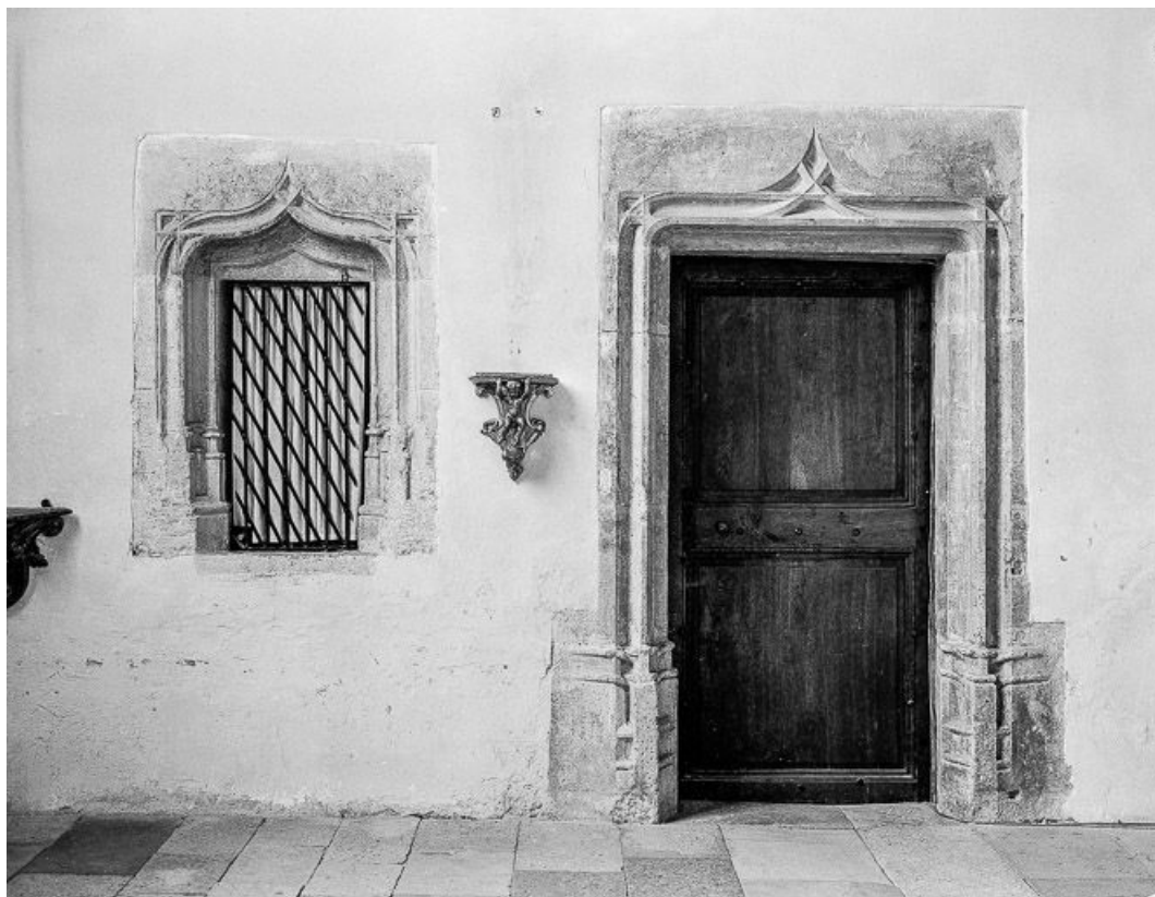
Intérieur : porte conduisant à la sacristie.