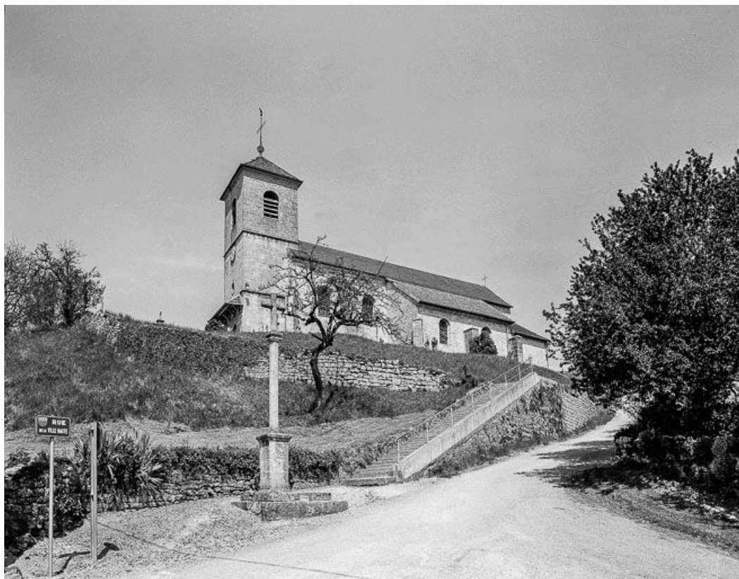
Vue générale. 25, Montgesoye