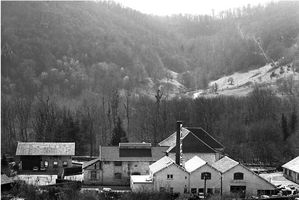
Vue plongeante depuis le nord en 2000.