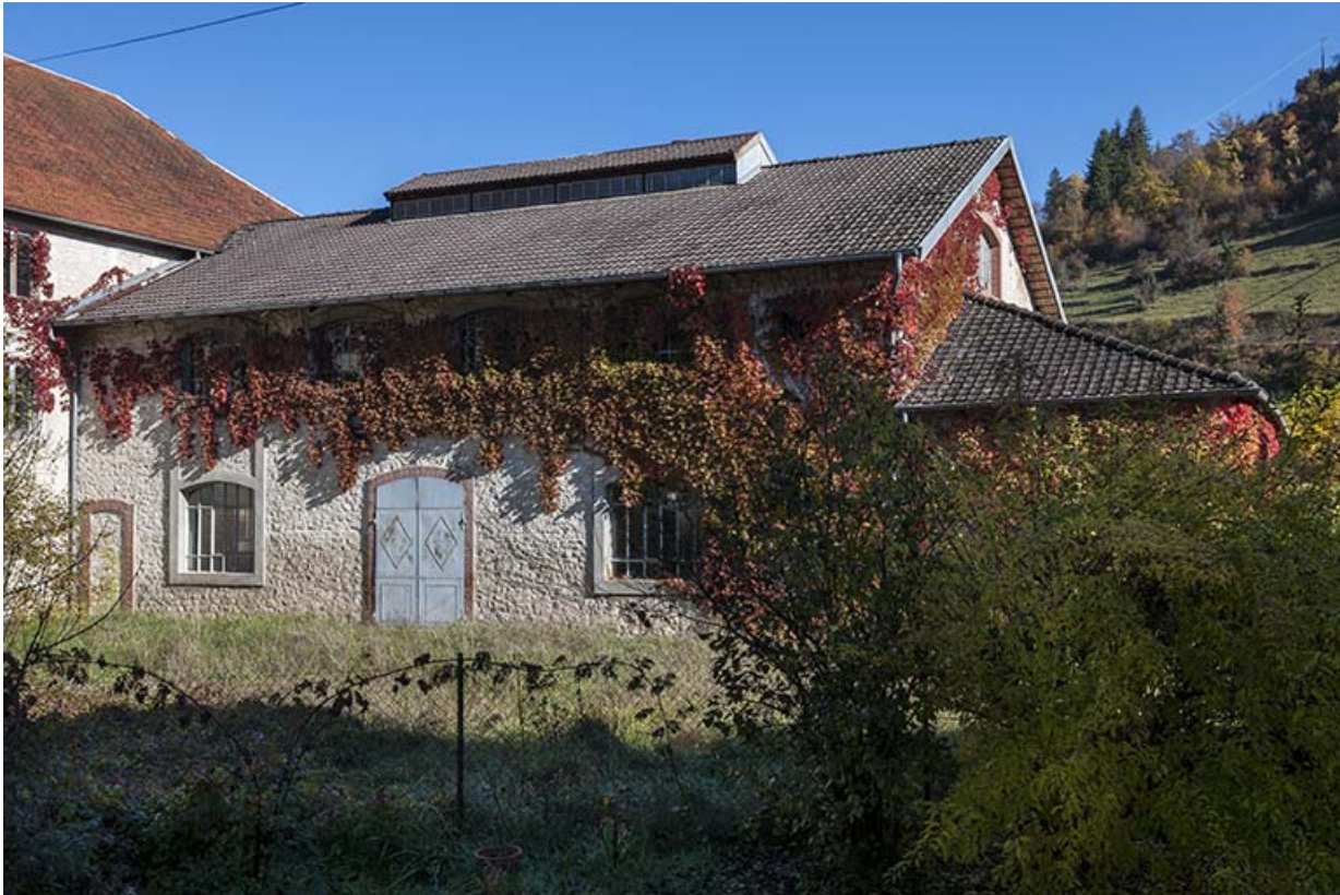
Bâtiment de la distillerie (salle des alambics ?). 25, Montgesoye rue du Moulin