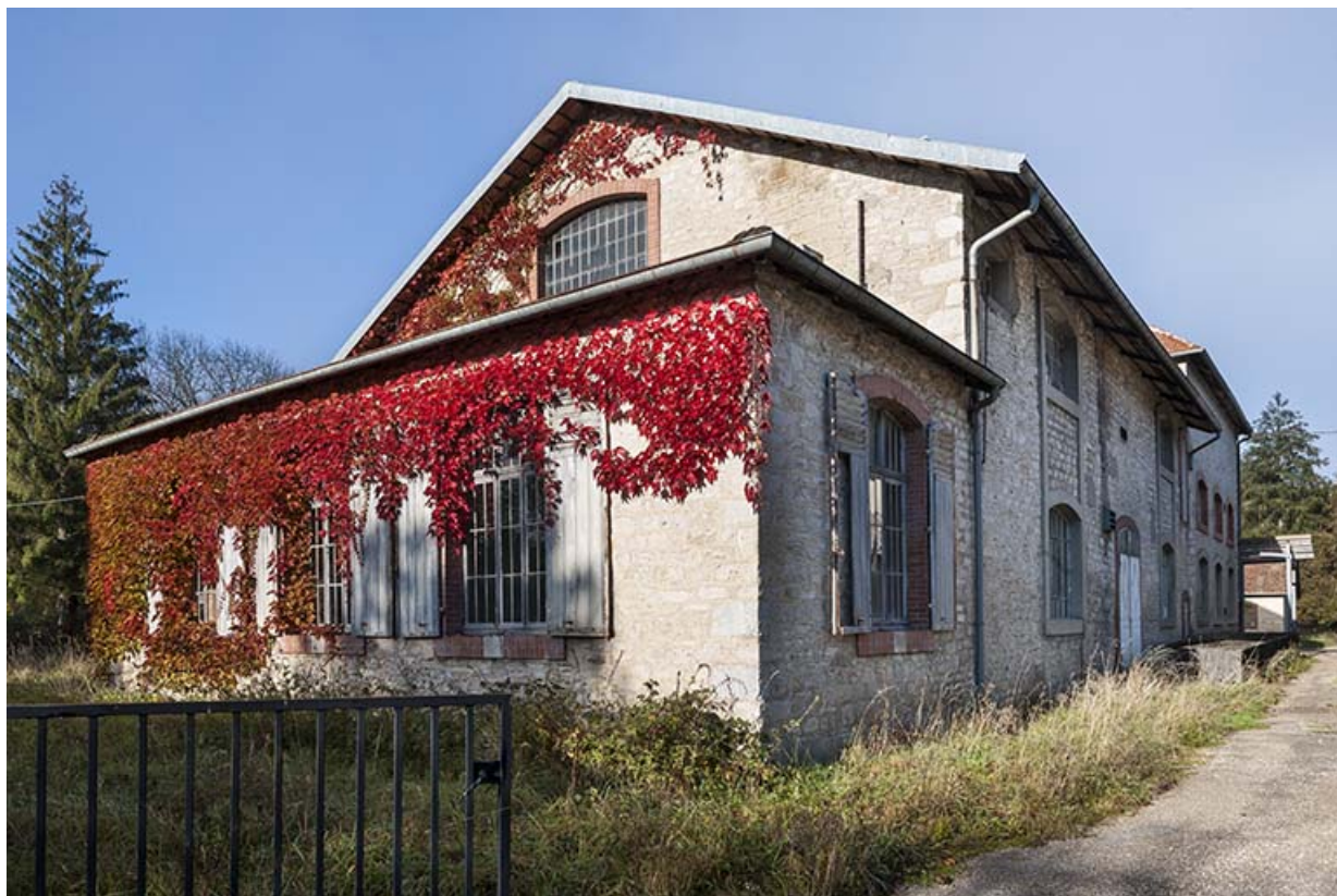
Bâtiment de la distillerie (salles des alambics ?). 25, Montgesoye rue du Moulin