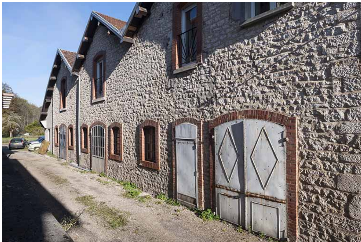
Salle des machines et chaufferie. Pignons de la façade postérieure. 25, Montgesoye rue du Moulin