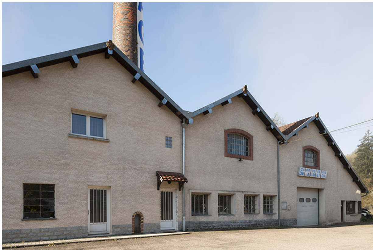
Pignons est de la salle des machines et de la chaufferie.