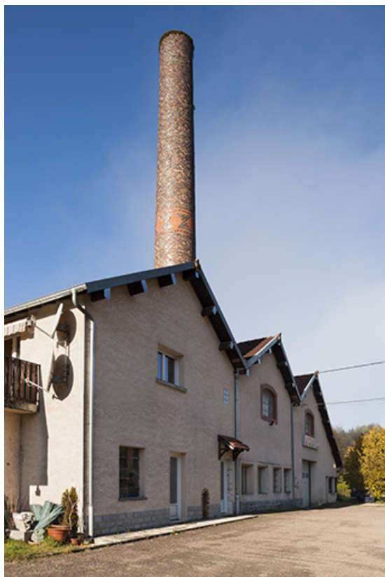
Vue de trois quarts gauche de la salle des machines. 25, Montgesoye rue du Moulin