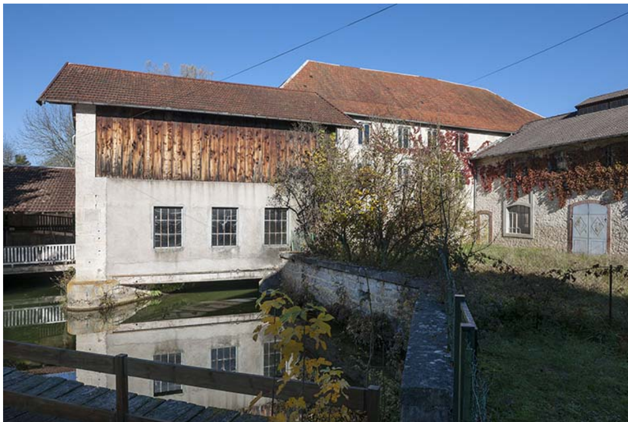
Bâtiment d'eau et atelier de fabrication.