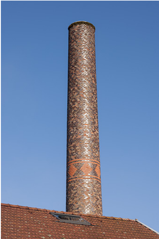
Cheminée de la chaufferie.