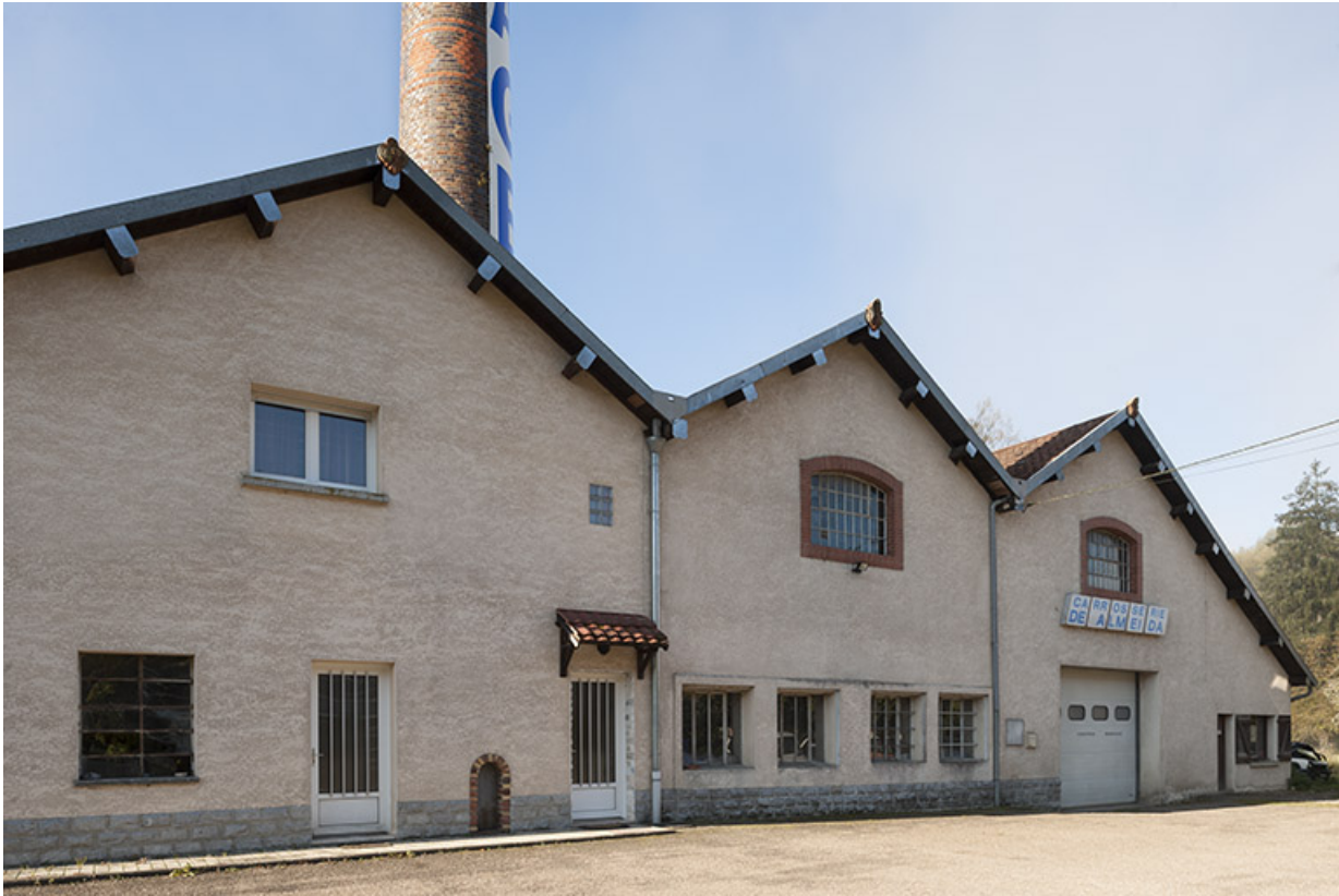
Pignons est de la salle des machines et de la chaufferie.