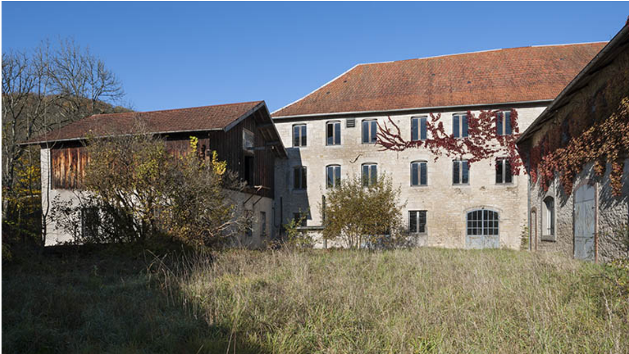
Façade sud de l'atelier.