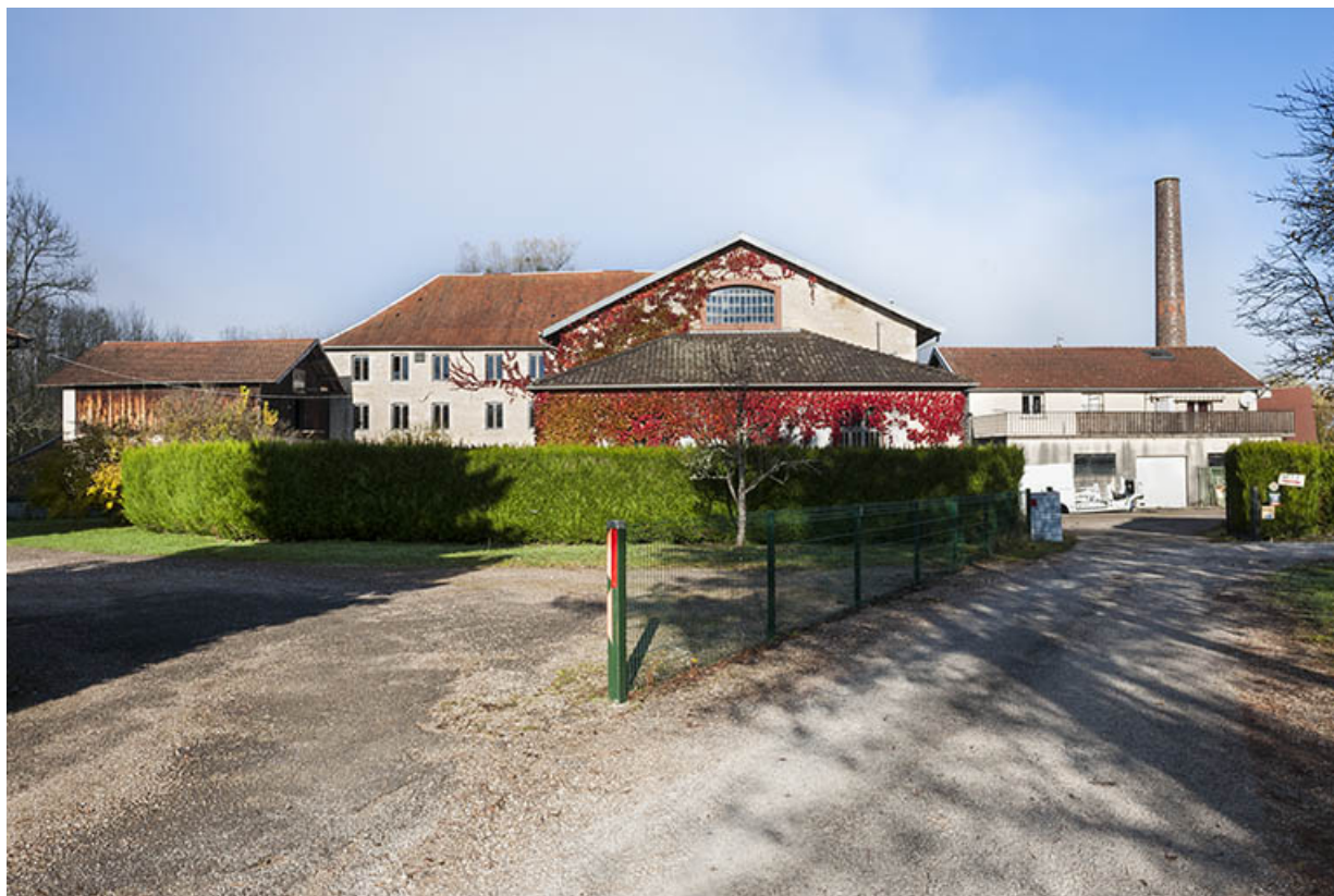
Vue d'ensemble depuis le sud.