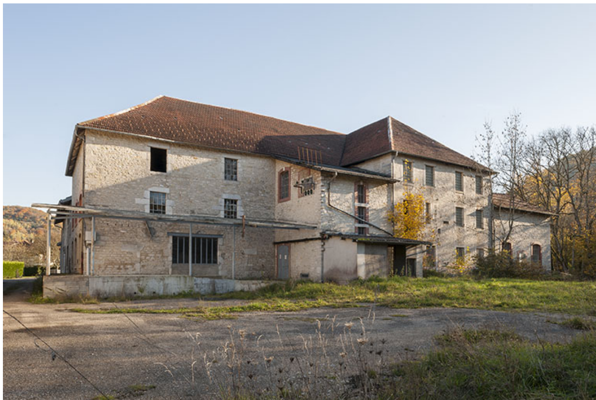
Atelier de fabrication vu depuis le nord.