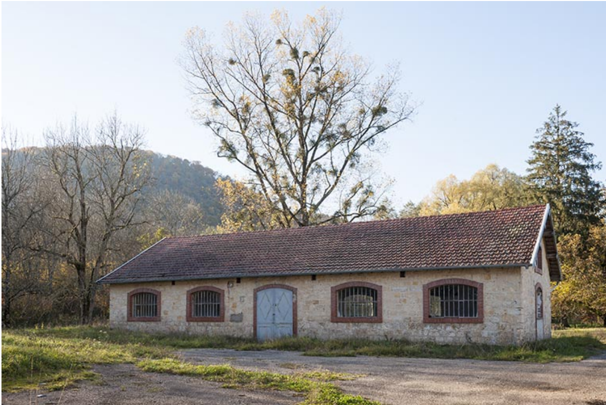
Magasin industriel nord.