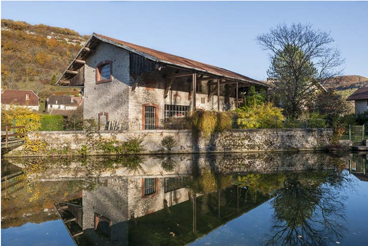
Entrepôt industriel vu depuis le nord-ouest.