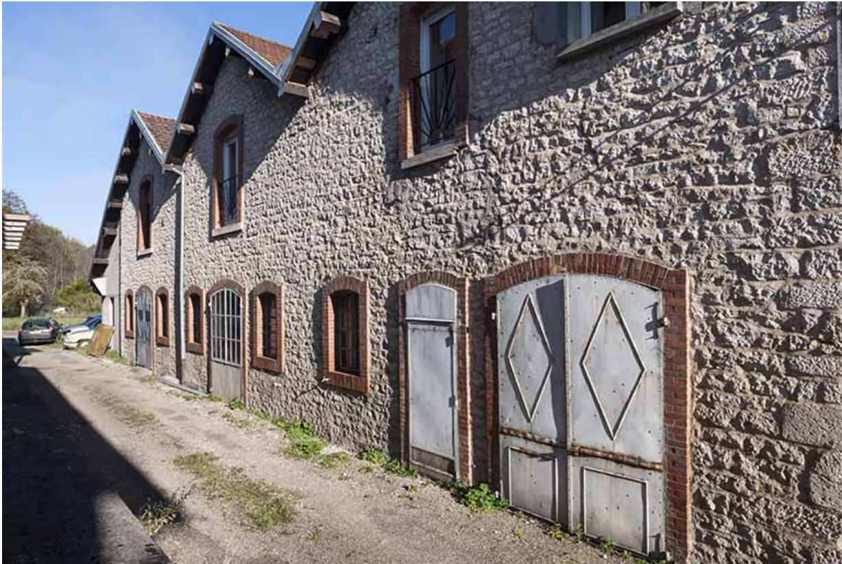
Salle des machines et chaufferie. Pignons de la façade postérieure. 25, Montgesoye rue du Moulin