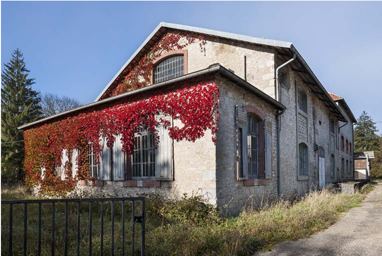
Bâtiment de la distillerie (salles des alambics ?). 25, Montgesoye rue du Moulin