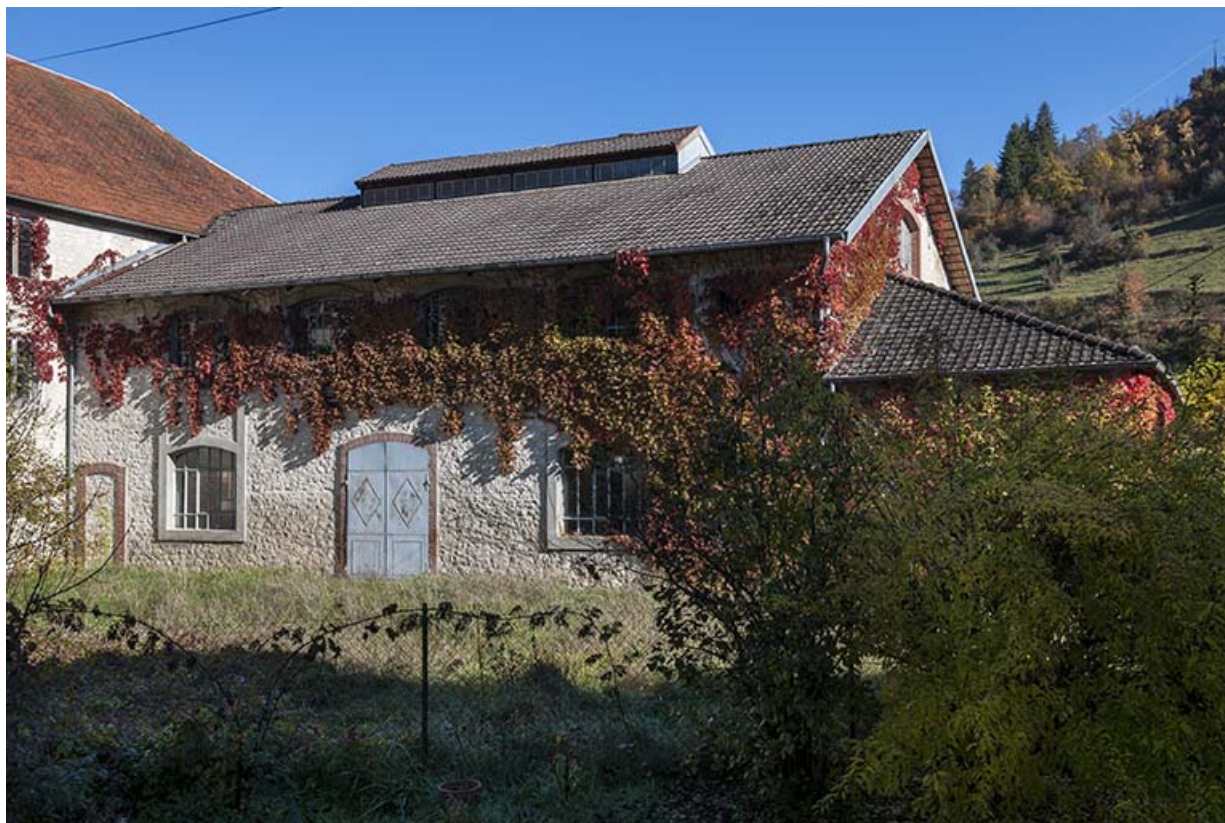
Bâtiment de la distillerie (salle des alambics ?). 25, Montgesoye rue du Moulin