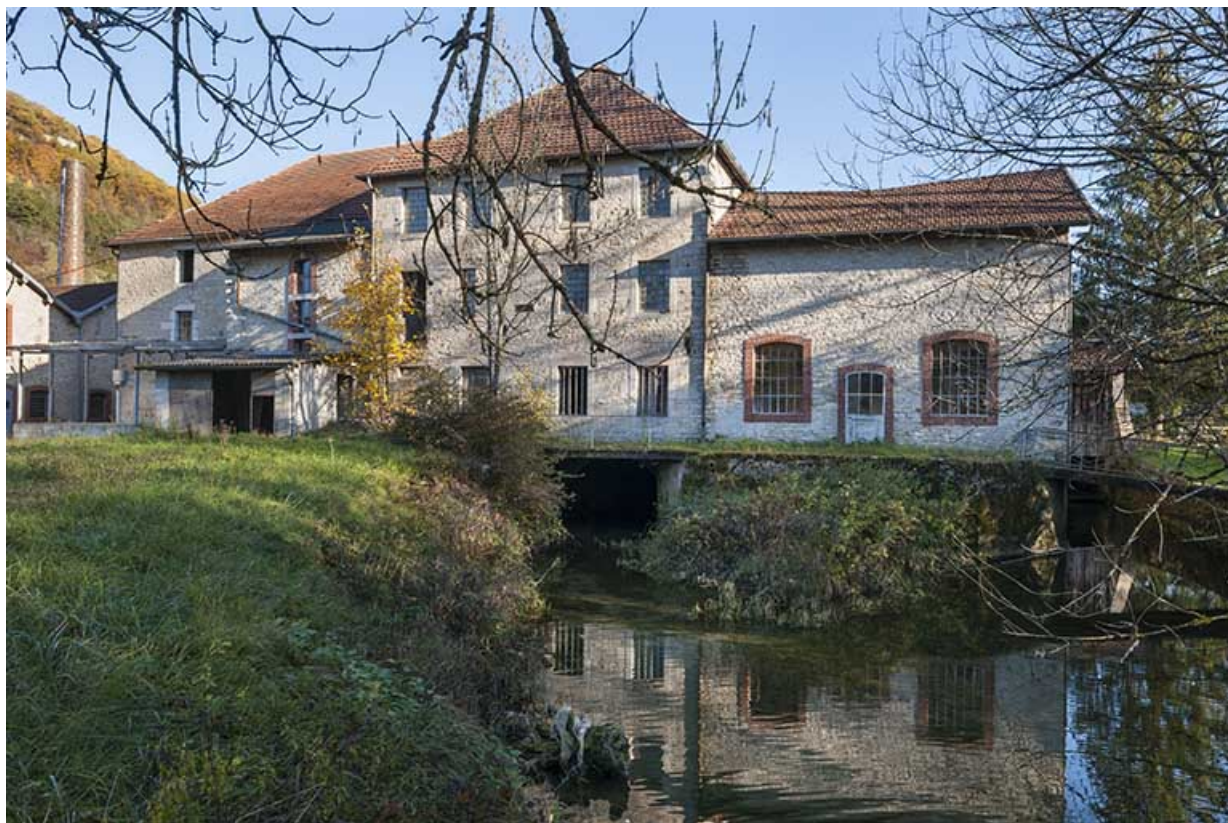
Vue d'ensemble depuis le nord.