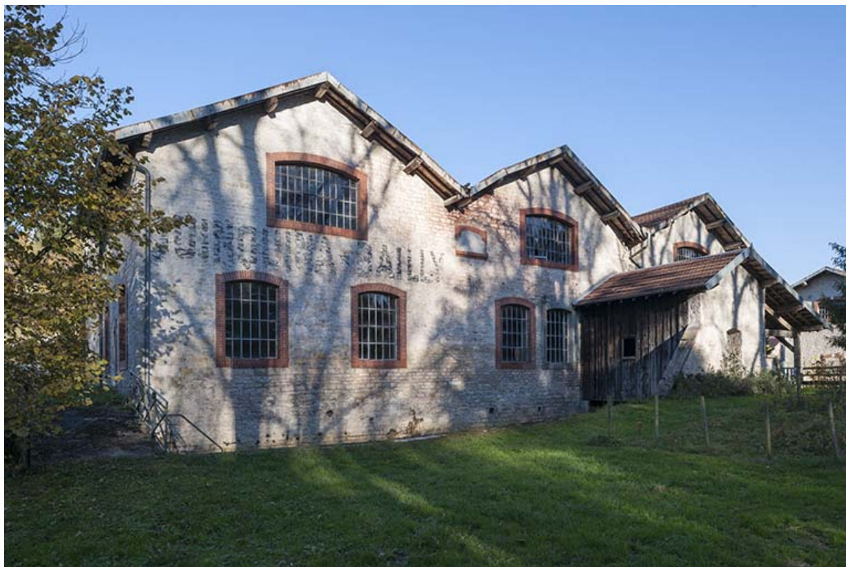
Ateliers ouest vus de trois quarts droite.