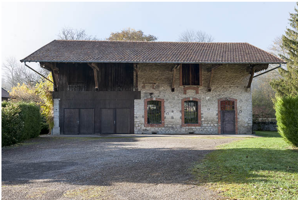
Entrepôt industriel. Face est. 25, Montgesoye rue du Moulin