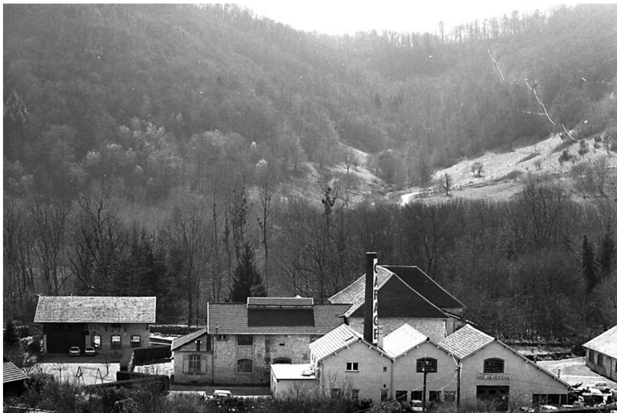
Vue plongeante depuis le nord en 2000.