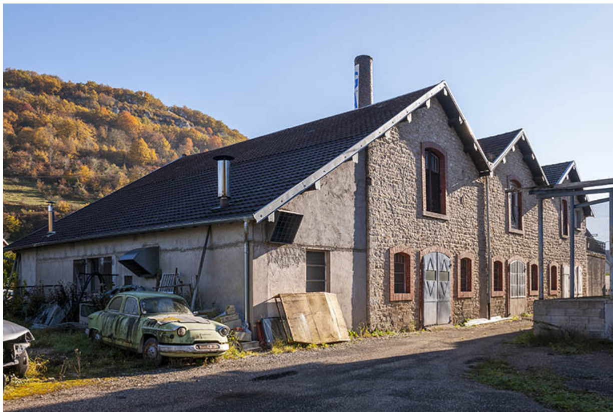
Vue de trois quarts arrière de la salle des machines.