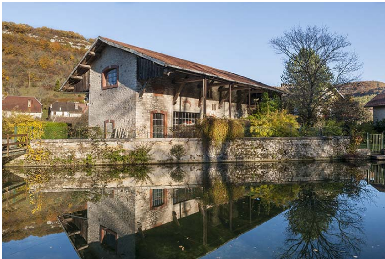
Entrepôt industriel vu depuis le nord-ouest. 25, Montgesoye rue du Moulin