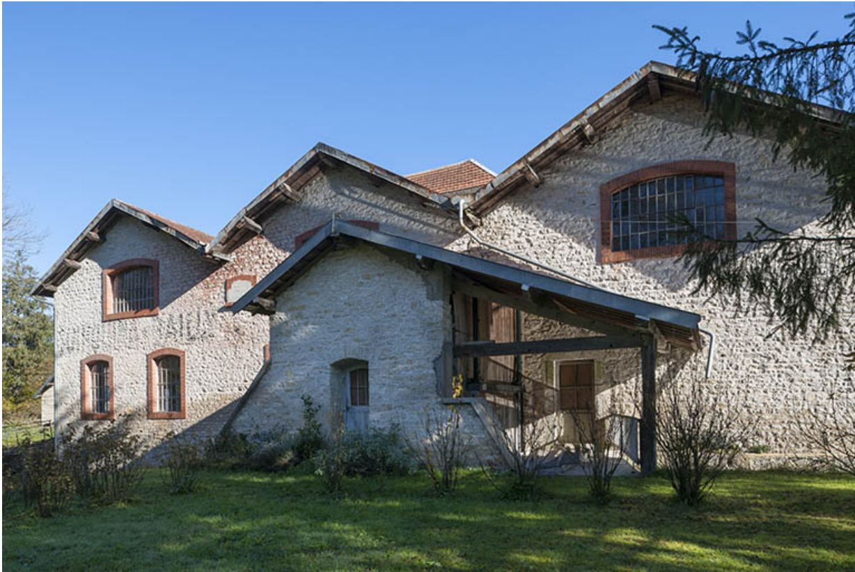
Pignons des bâtiments ouest.