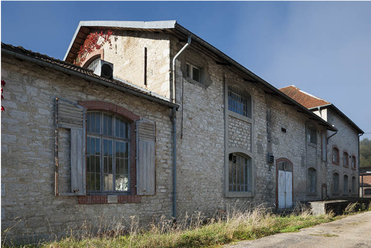
Façades est de l'atelier principal.