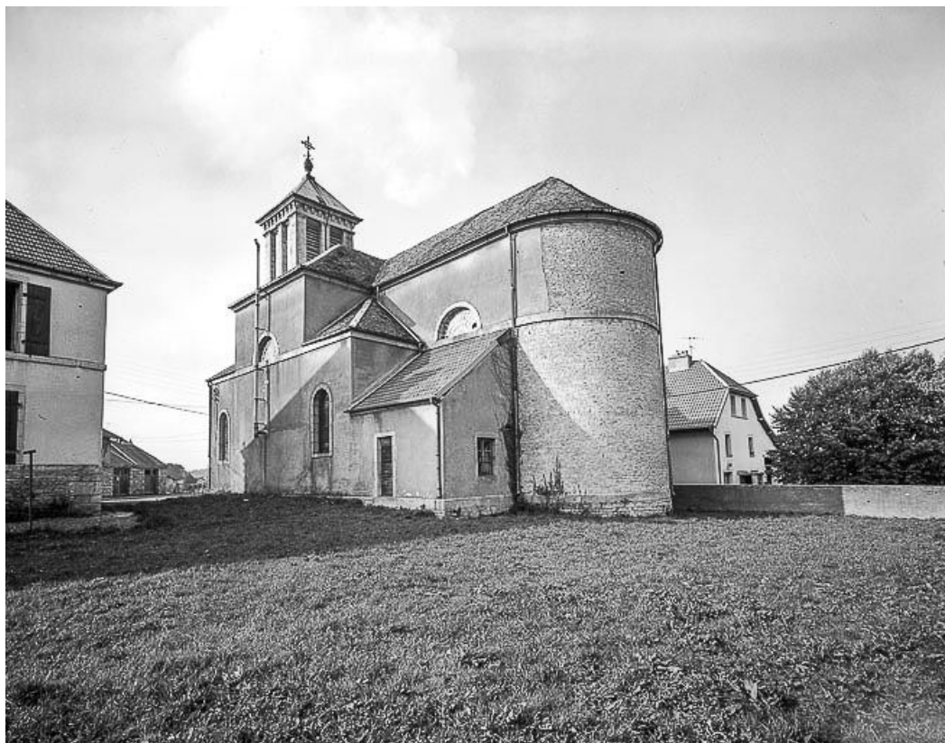
Chevet et face latérale droite.

25, Mérey-sous-Montrond place de l' Eglise