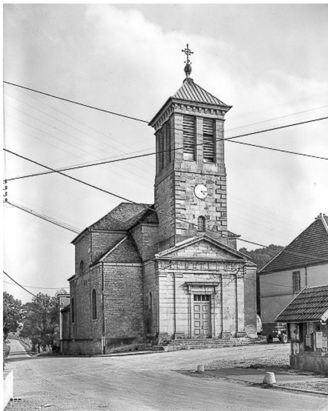
Façade antérieure de trois quarts gauche. 25, Mérey-sous-Montrond