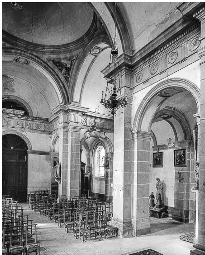
Intérieur : nef vue de trois quarts droit depuis le chœur.

25, Mérey-sous-Montrond place de l' Eglise