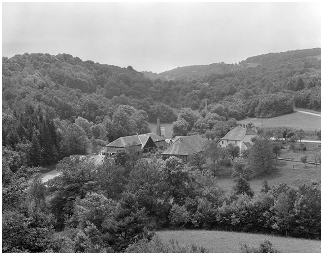
Vue générale du site depuis le nord-est. 25, Malbrans