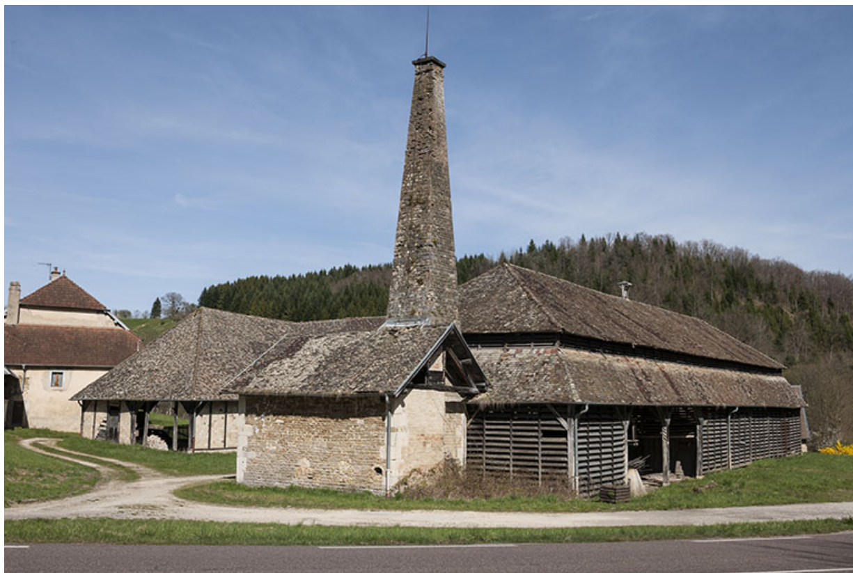
Vue rapprochée depuis le sud-ouest.