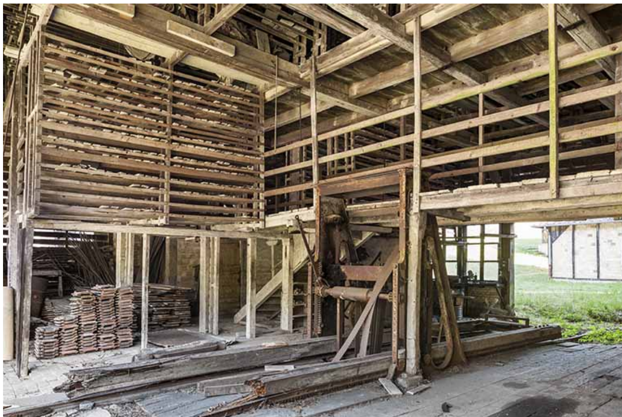
Le séchoir. Au premier plan, le châssis de scie.

25, Malbrans route départementale 67, lieudit : les Combes de Punay