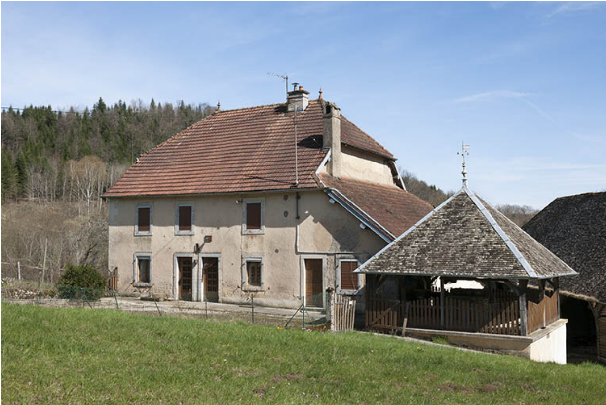
Logement vu de trois quarts droite.

25, Malbrans route départementale 67, lieudit : les Combes de Punay