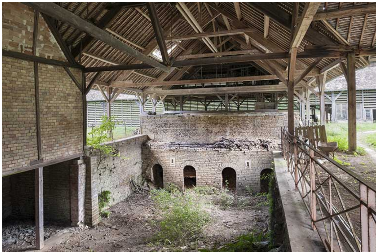
Aire d'enfournement et gueules de charge des fours.