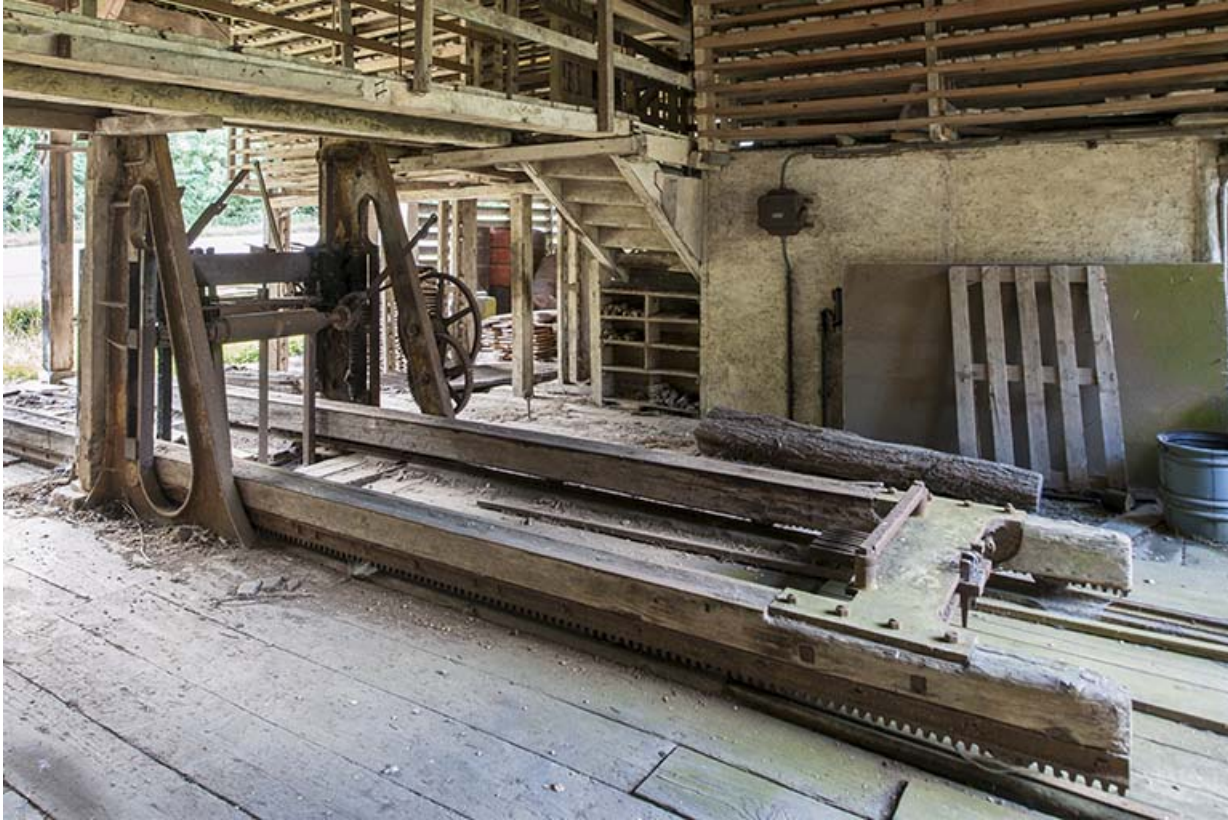
Châssis de scie et son chariot à grumes.

25, Malbrans route départementale 67, lieudit : les Combes de Punay