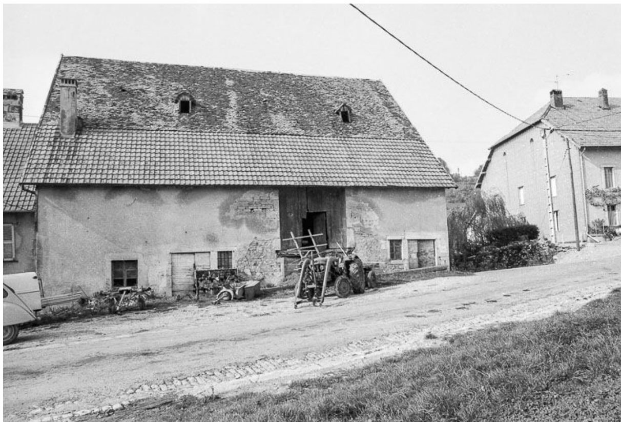
Ferme située rue de la Fontaine : façade postérieure sur la place de l'Eglise. 25, Malbrans