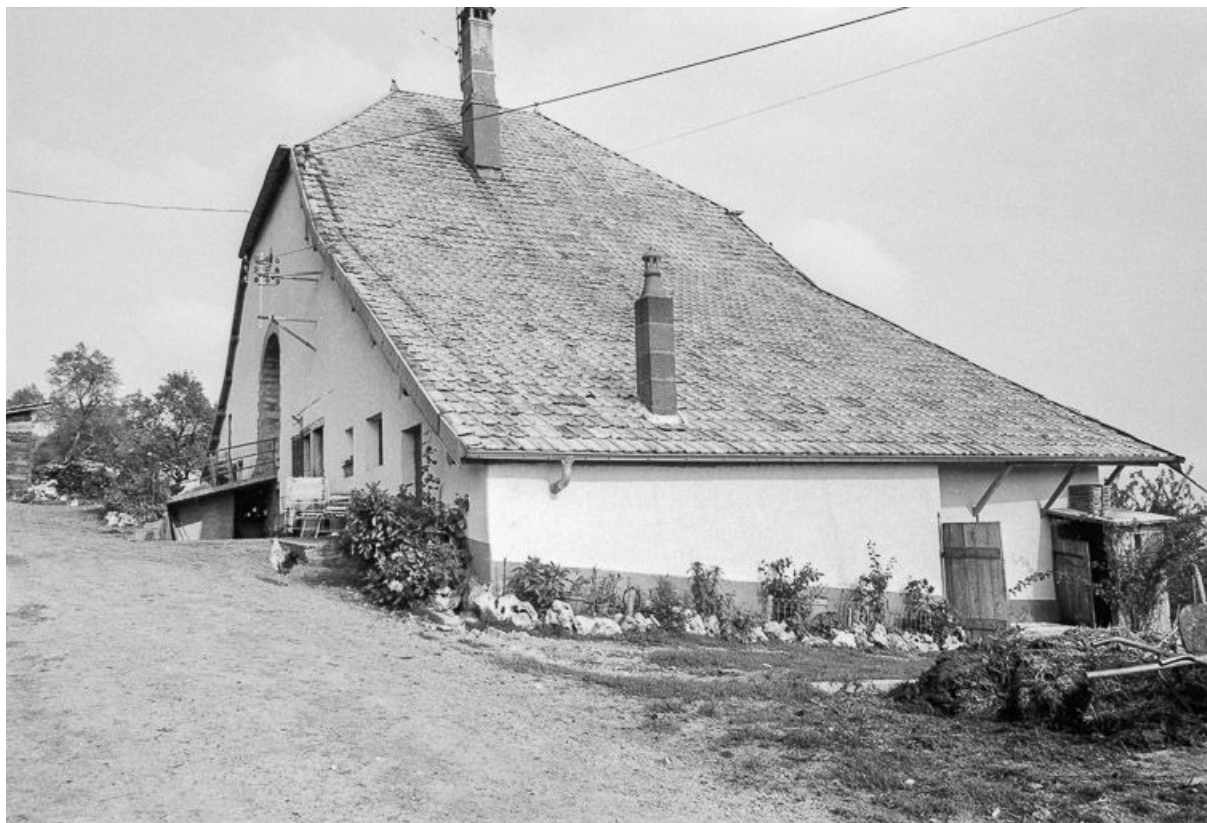
Ferme située chemin de la Vierge (?) : façades antérieure et latérale droite. 25, Malbrans