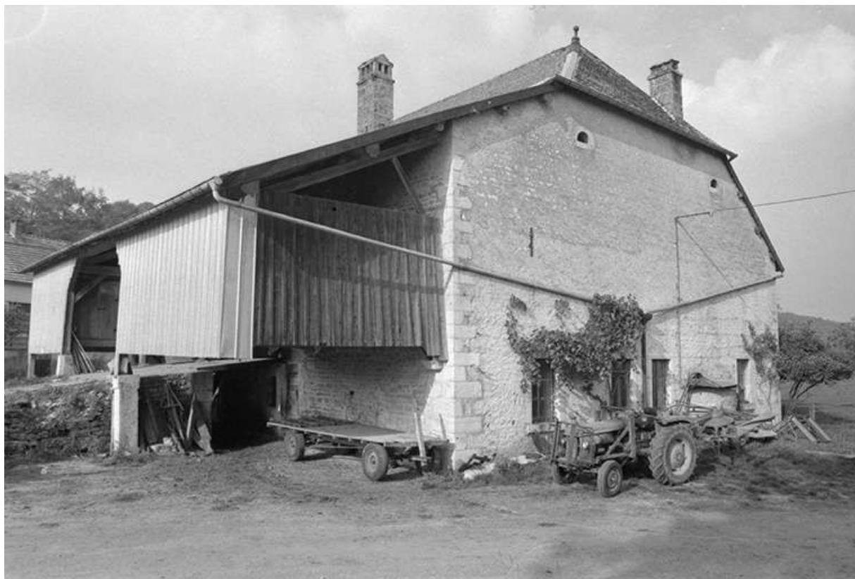
Ferme située rue des Vignes : vue générale. 25, Malbrans