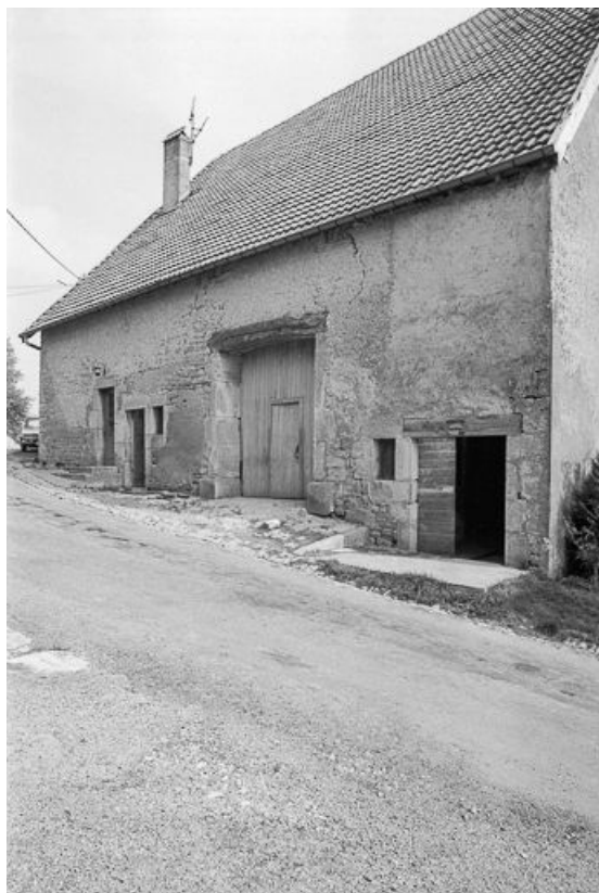
Ferme située Grande Rue : vue générale. 25, Malbrans