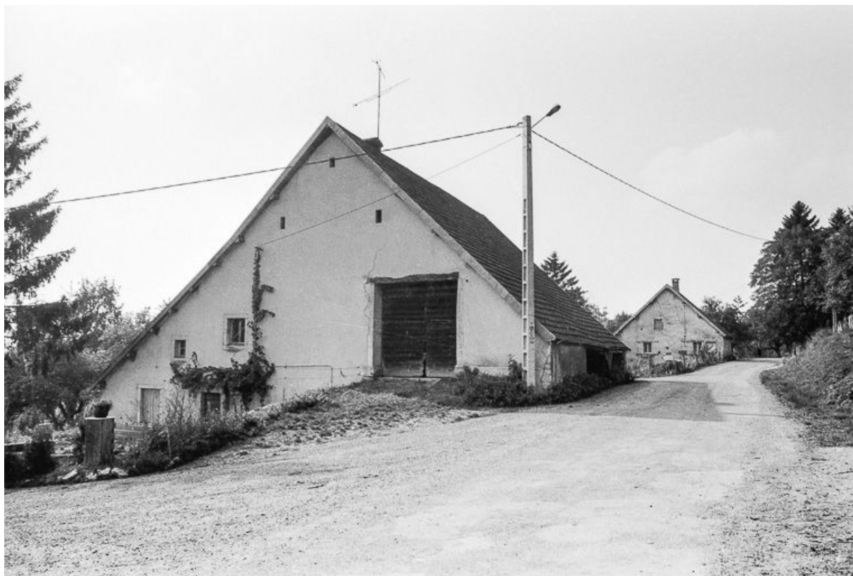
Ferme située rue de la Fontaine : vue générale. 25, Malbrans