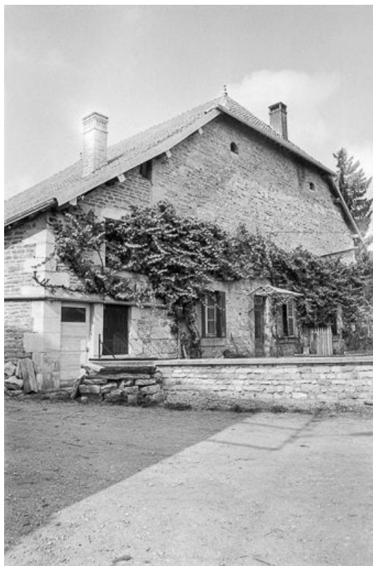
Ferme située rue des Vignes : façade antérieure. 25, Malbrans