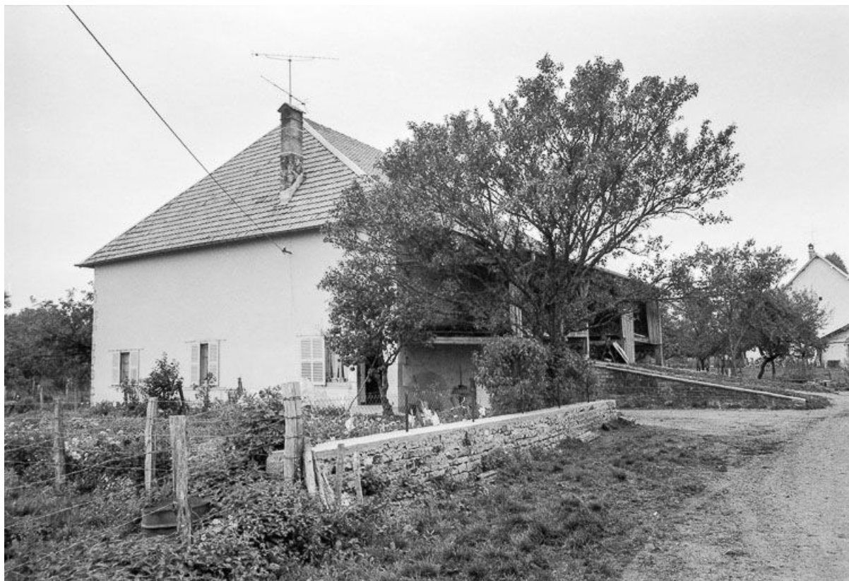
Ferme située rue du Grand Courtil : vue de trois quarts gauche. 25, Malbrans