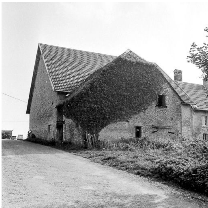
Ferme située rue de la Fontaine : façade antérieure. La façade postérieure donne sur la place de l'Eglise. 25, Malbrans