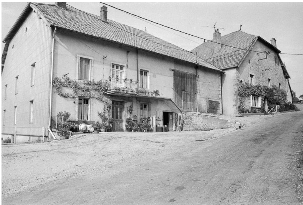
Ferme située Grande Rue : vue générale.