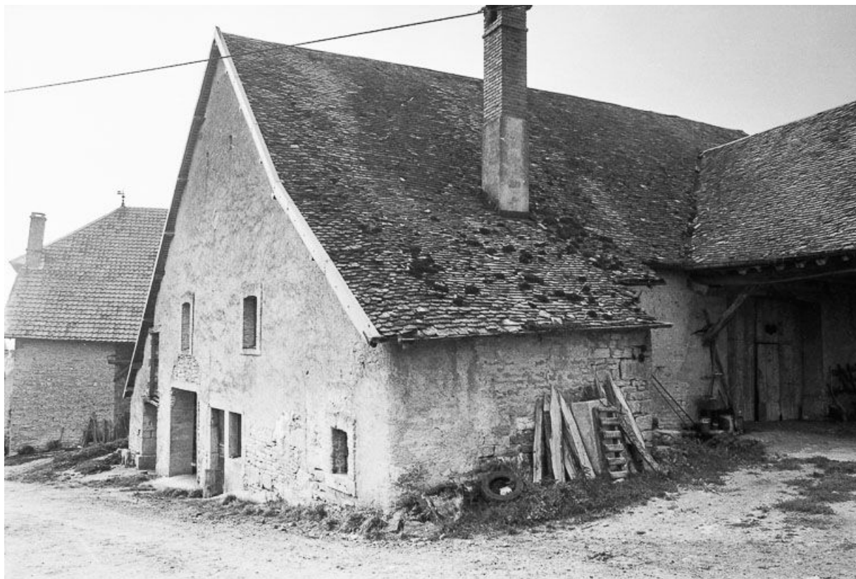
Ferme : vue de la partie habitation. 25, Malbrans