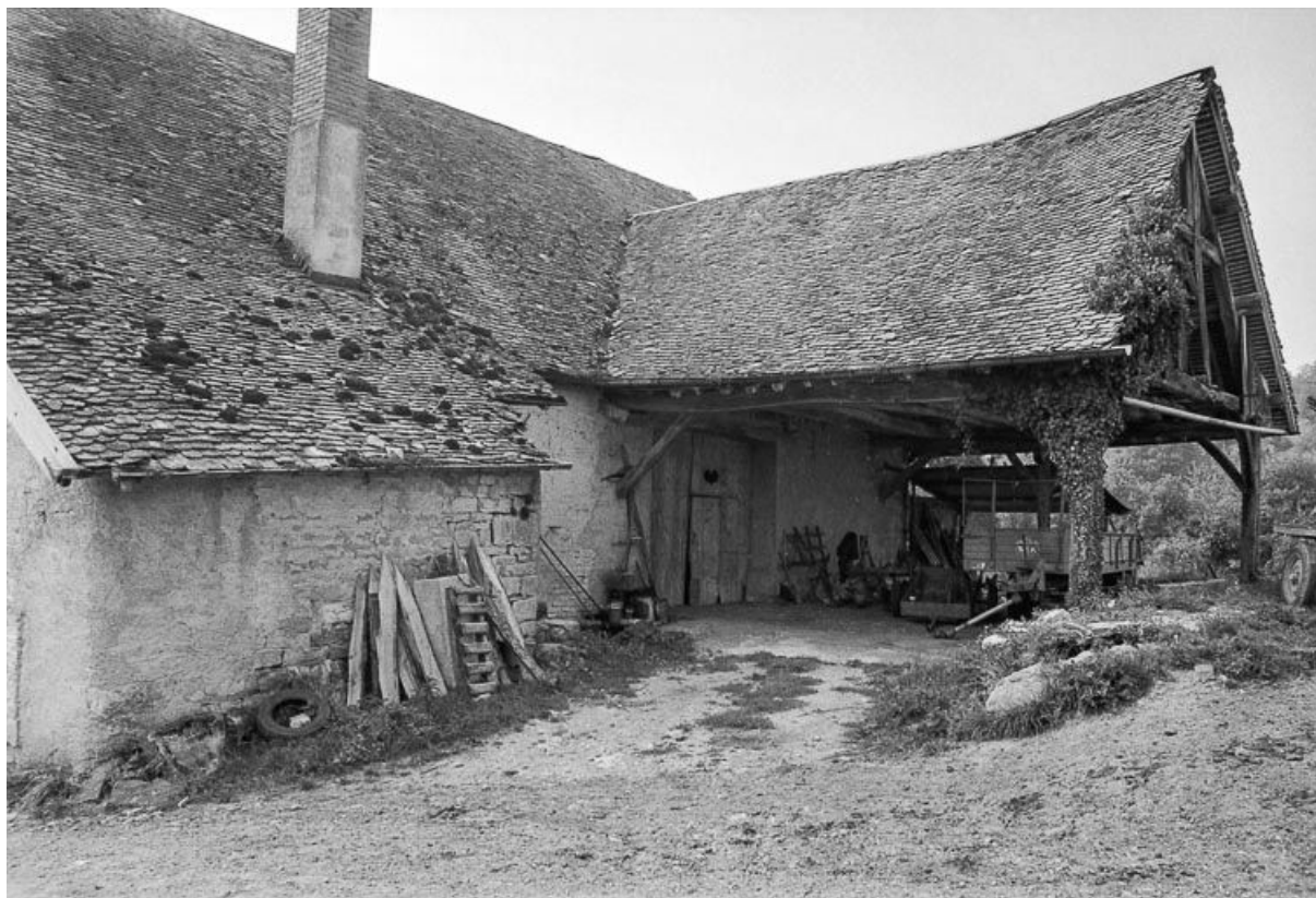
Ferme : vue de la partie agricole. 25, Malbrans