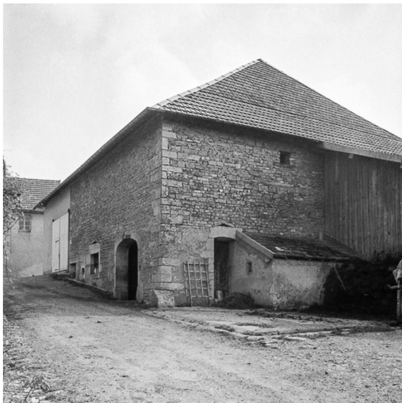
Ferme située rue du Lavoir : vue générale. 25, Malbrans