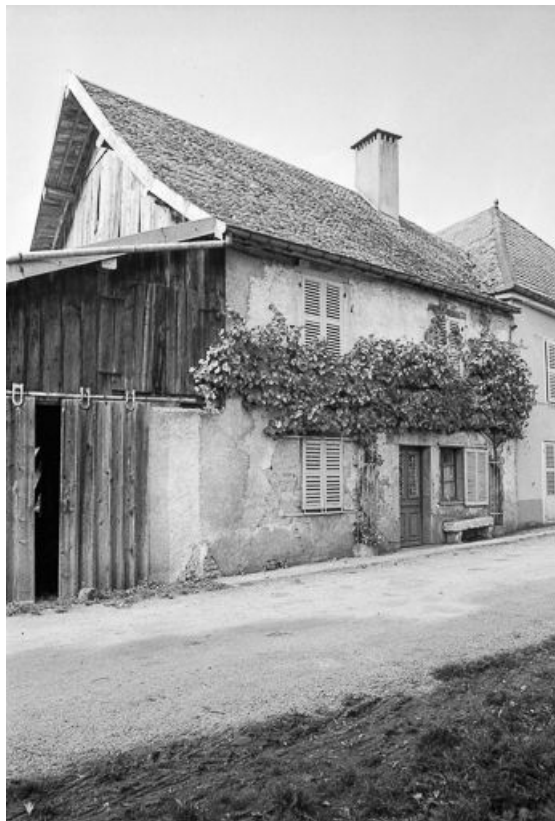
Ferme cadastrée 1971 AB 74 : vue générale. 25, Malbrans