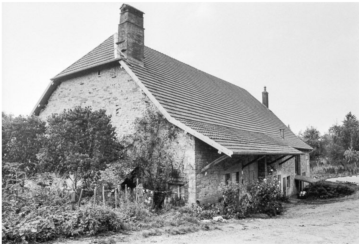
Vue de trois quarts gauche. 25, Malbrans