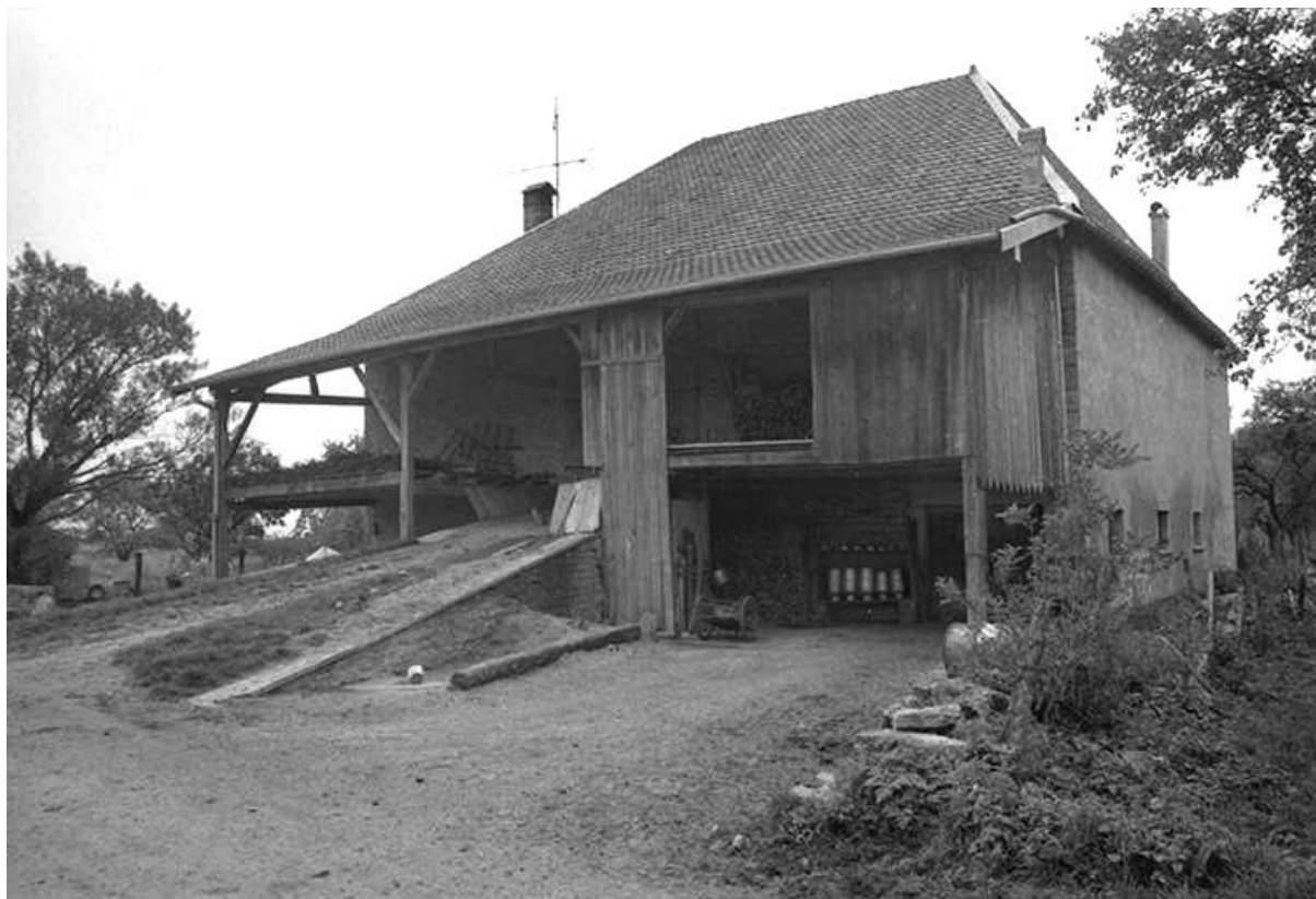
Ferme située rue du Grand Courtil : vue de trois quarts droit. 25, Malbrans