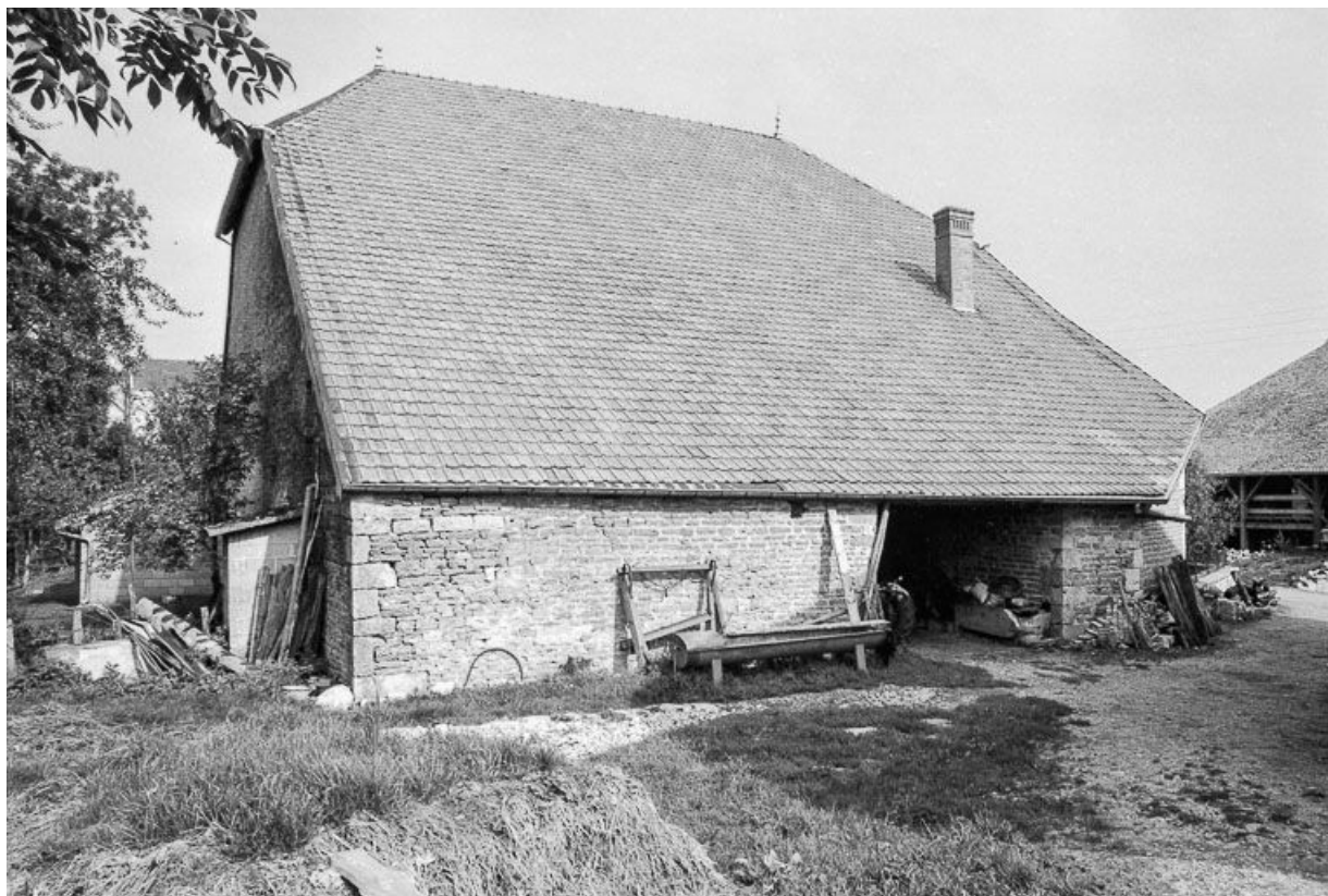
Ferme située rue des Vignes : façade latérale gauche. 25, Malbrans