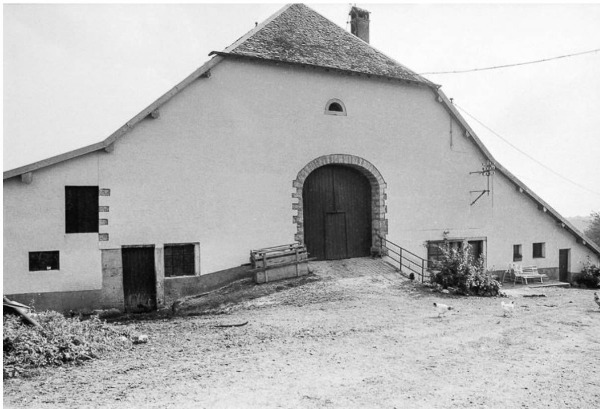
Ferme située chemin de la Vierge (?) : façade antérieure. 25, Malbrans