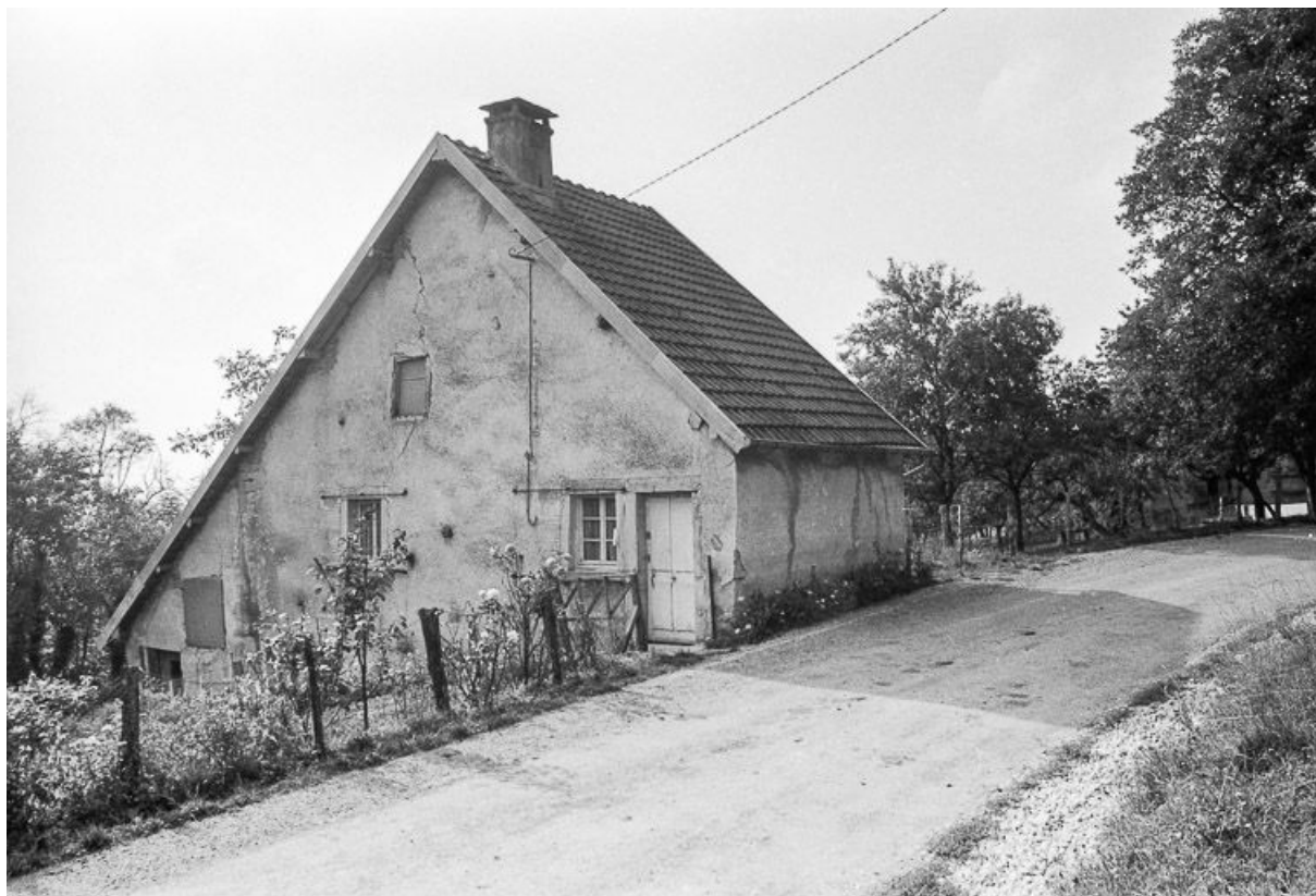
Maison située route de Cléron : vue générale. 25, Malbrans