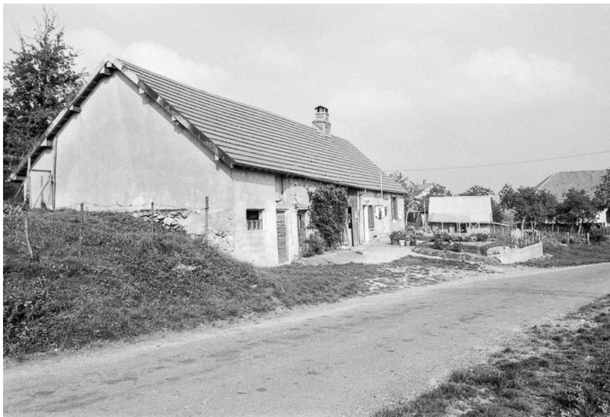
Ferme située 5 Grande Rue : vue générale. 25, Malbrans