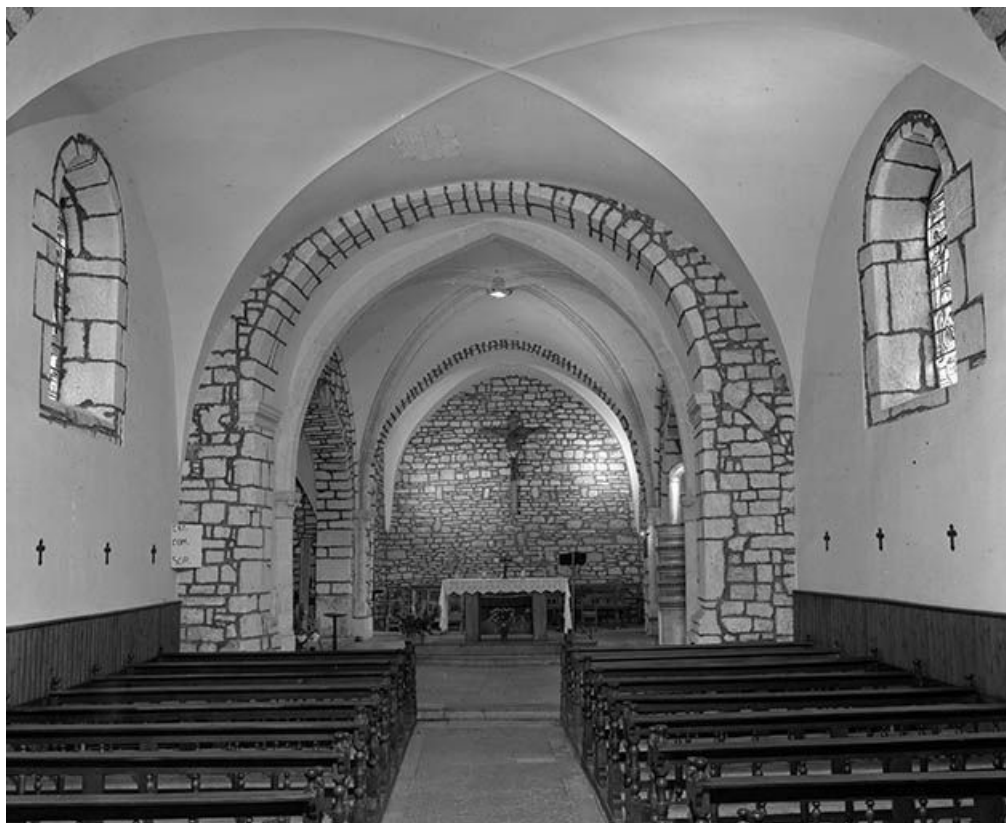
Intérieur : le chœur et la nef vus depuis l'entrée.