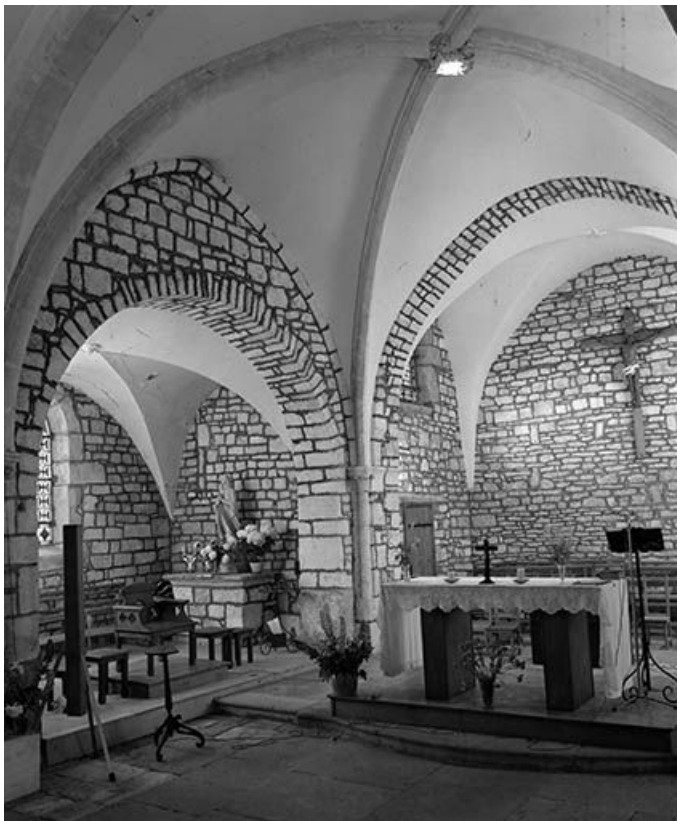
Intérieur : le chœur vu de trois quarts gauche.