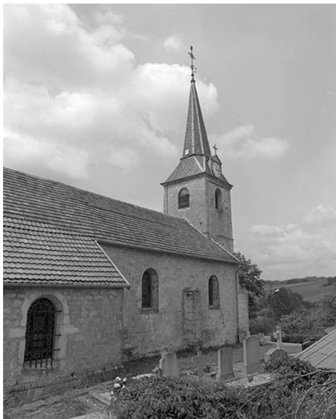
Face latérale gauche vue de trois quarts gauche.