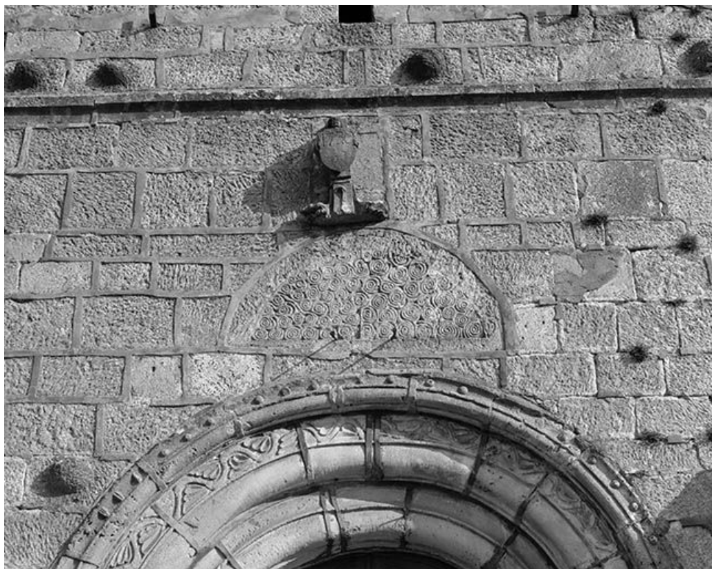
Vue de l'ancien tympan.