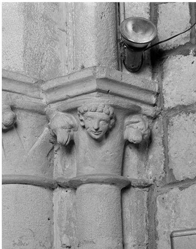
Chapiteau du choeur à tête humaine et têtes de chien.