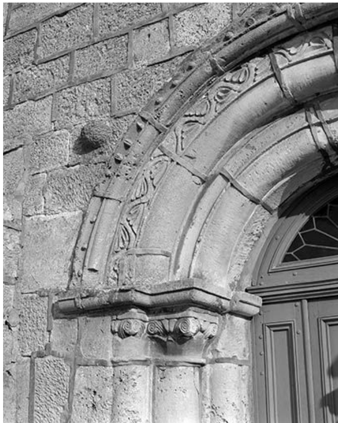
Détail du portail : voissure vue de la partie gauche.