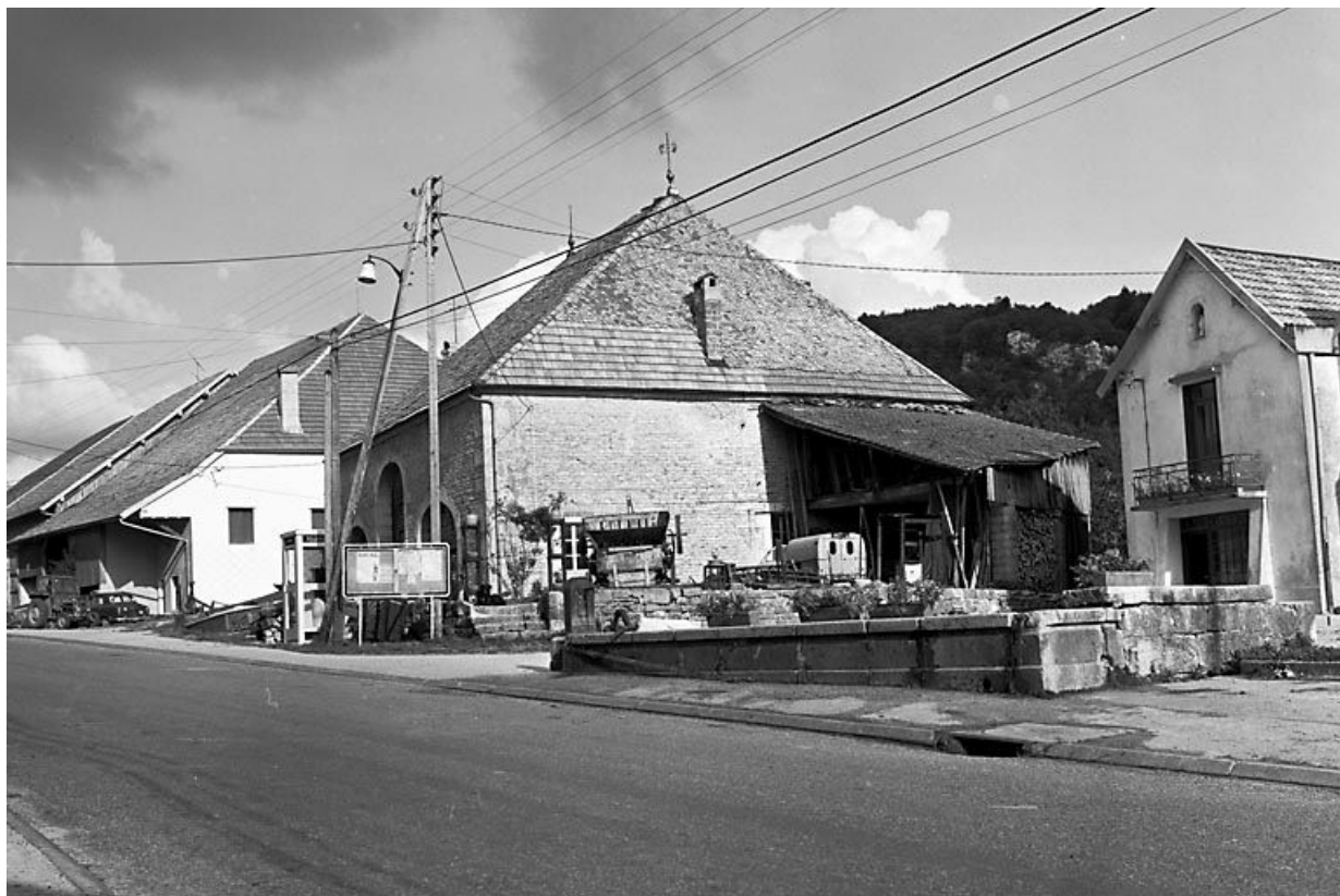
Vue de trois quarts droit..