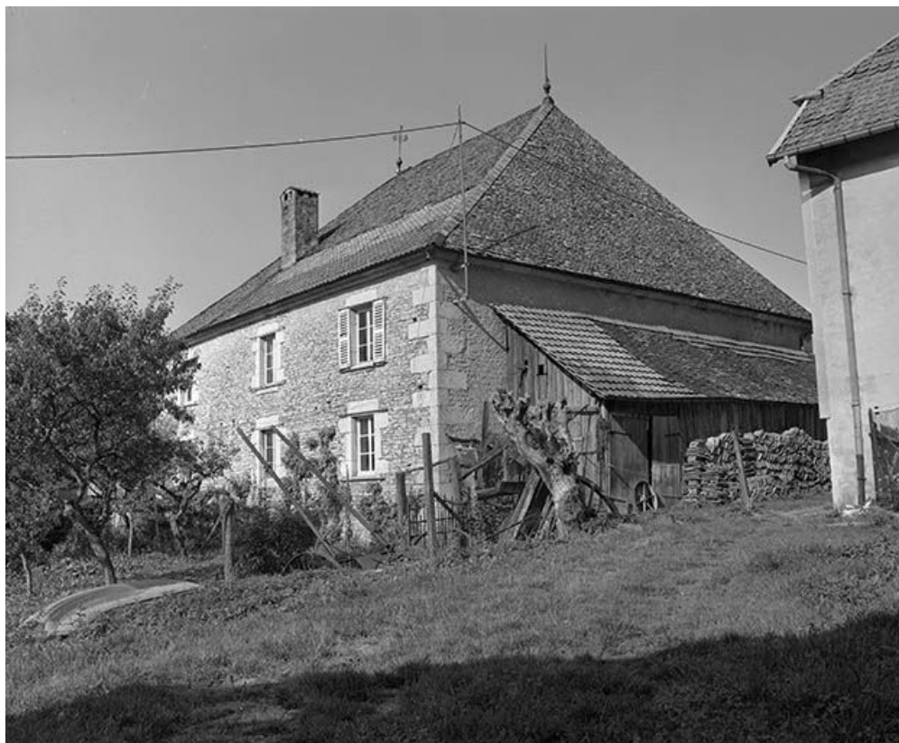
Façade postérieure vue de trois quarts droit.