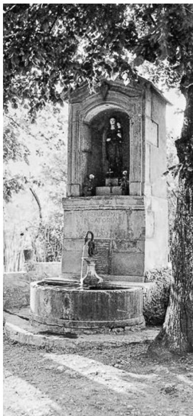
Vue générale, vers 1965.