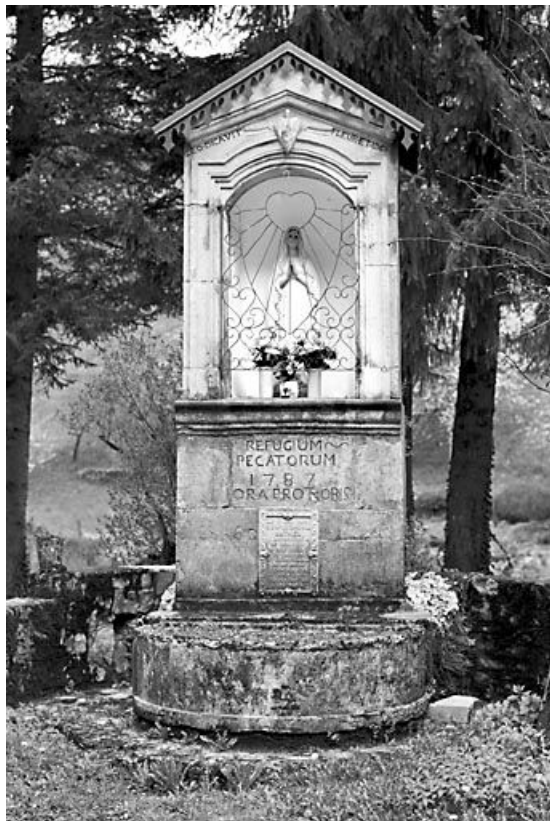
Vue de face.