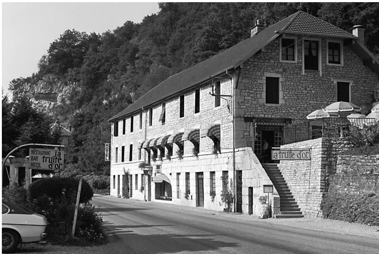
Façade antérieure de trois quarts droit. 25, Lods