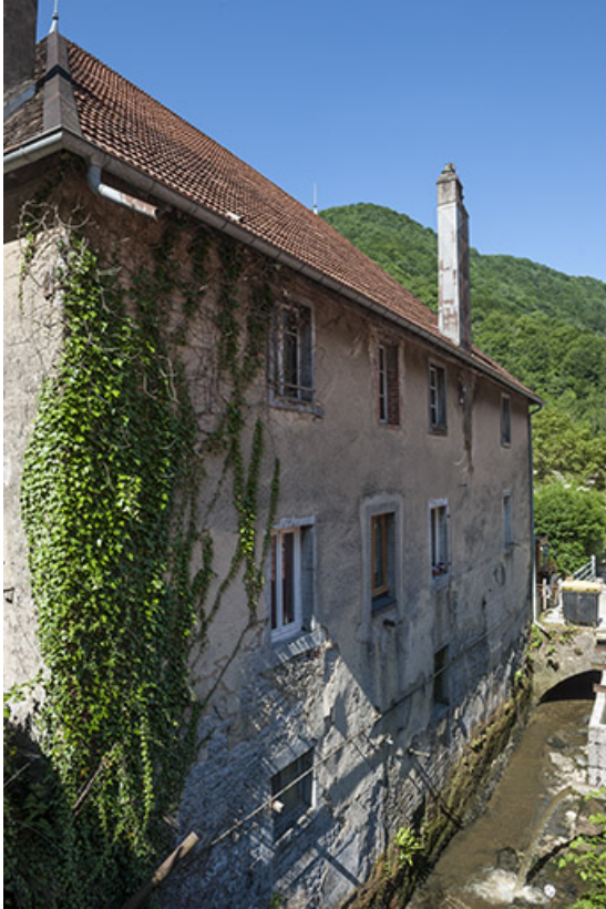
Façade nord du logement (ancien atelier). 25, Lods, 48 route de Besançon