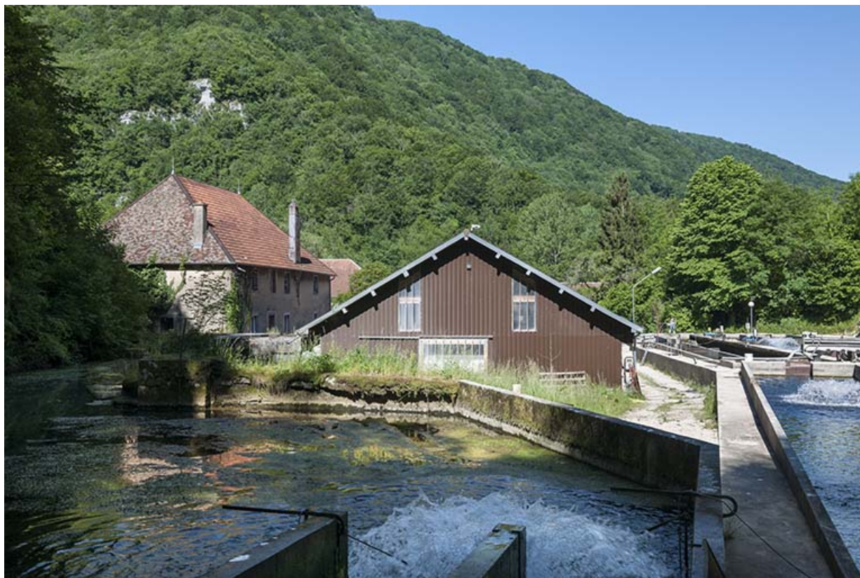
Vue depuis l'emplacement du bassin de retenue.