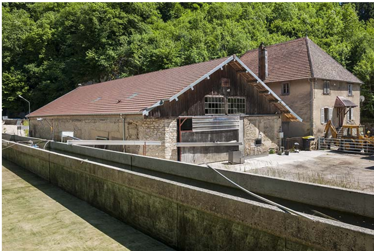
Atelier de scierie et logement vus de trois quarts.