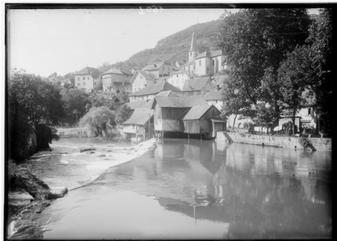
Le village vu depuis la rive gauche de la Loue.