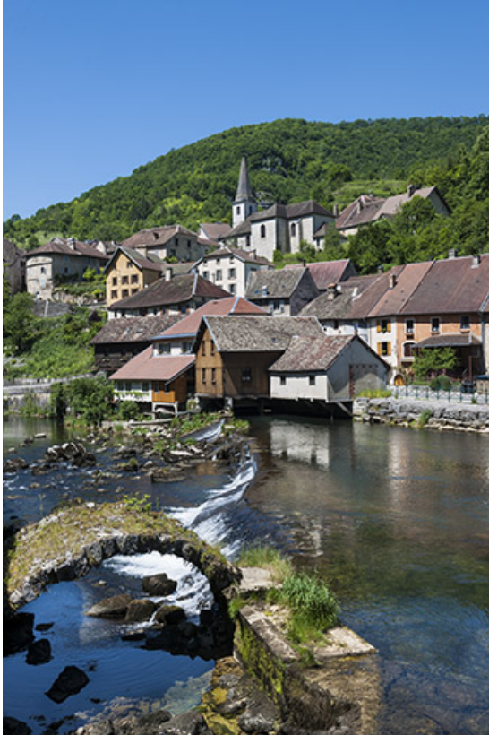
Vue générale, avec le village au second plan.