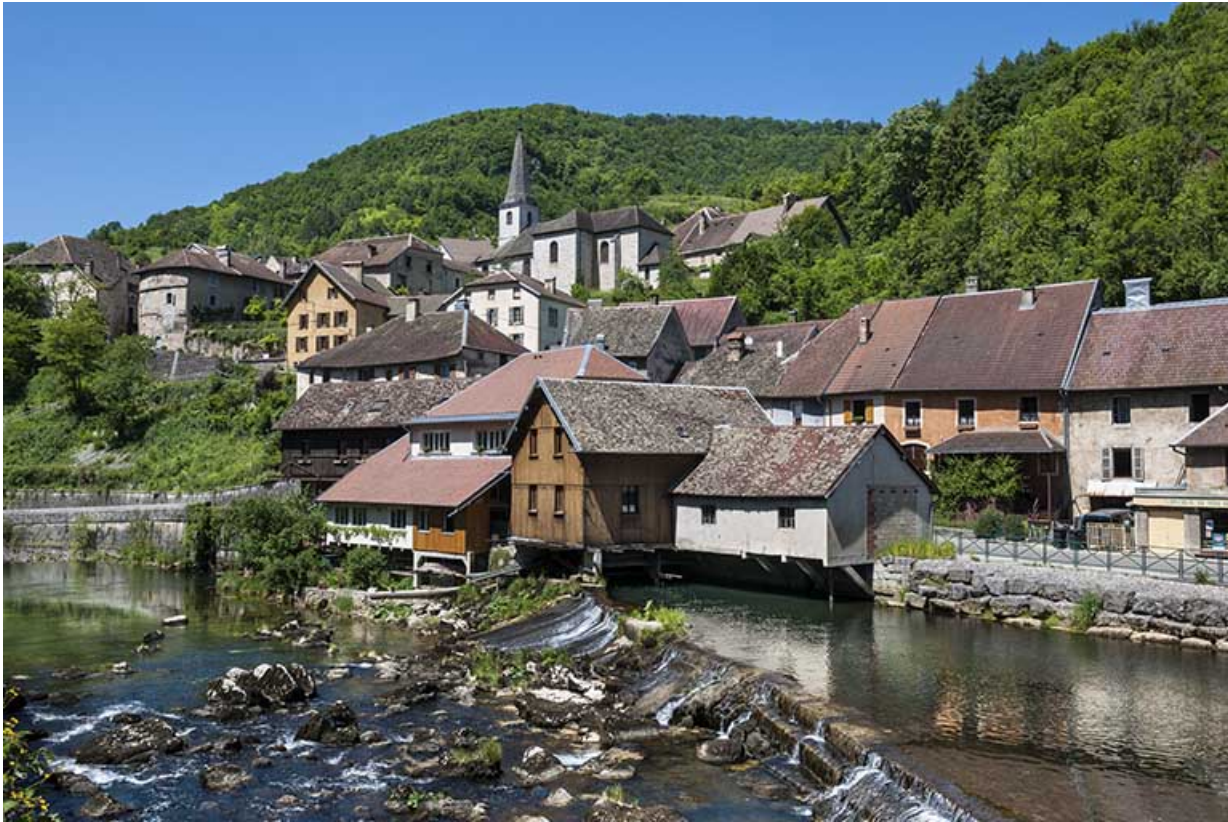
Vue d'ensemble depuis la rive gauche, en amont.