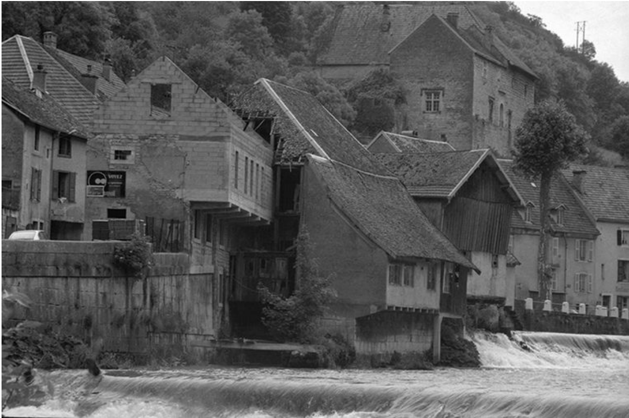
Vue générale, angle sud-ouest.