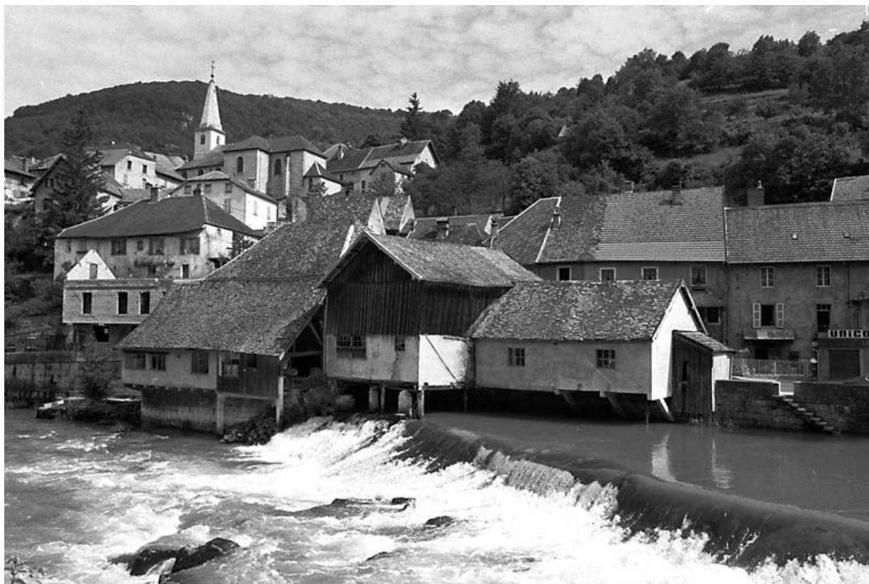
Vue générale depuis la rive gauche de la Loue. 25, Lods