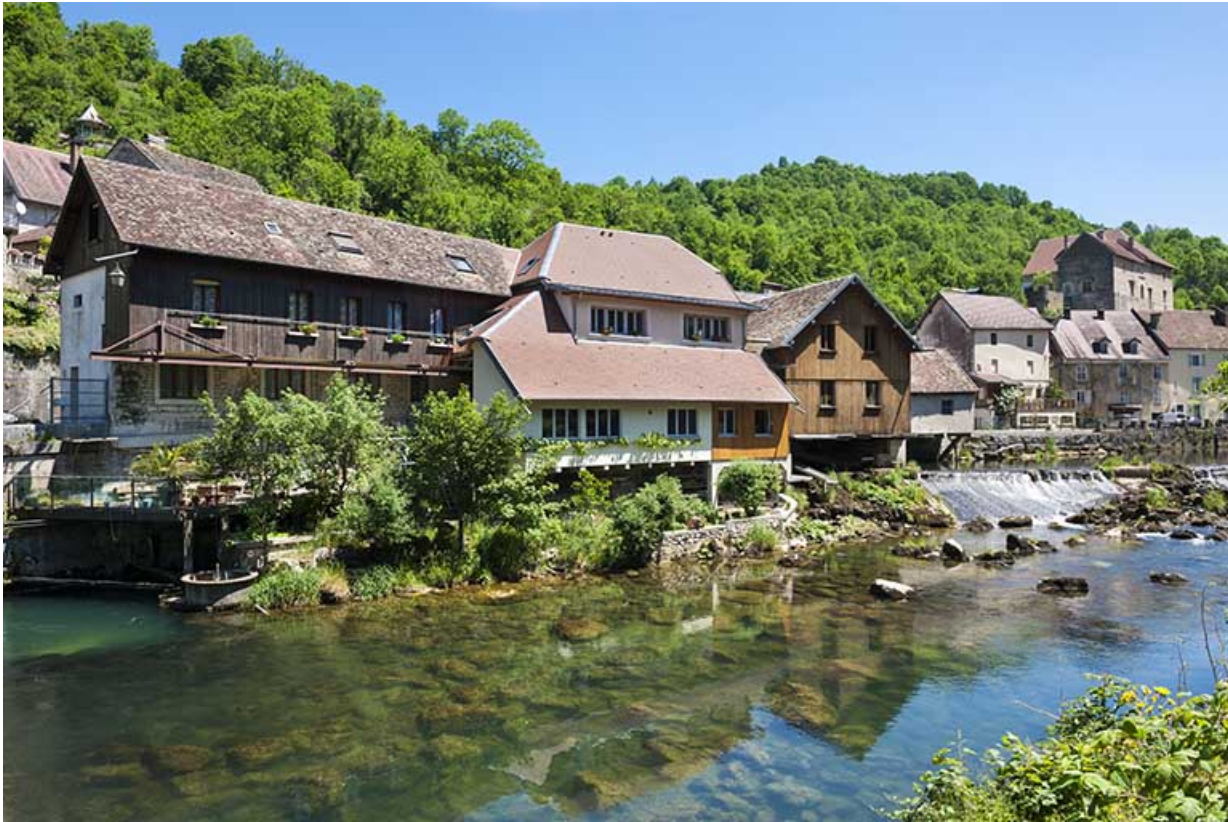
Vue d'ensemble depuis l'aval.