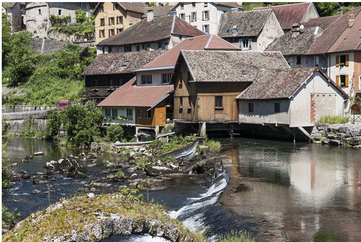
Vue depuis la tête amont du barrage.