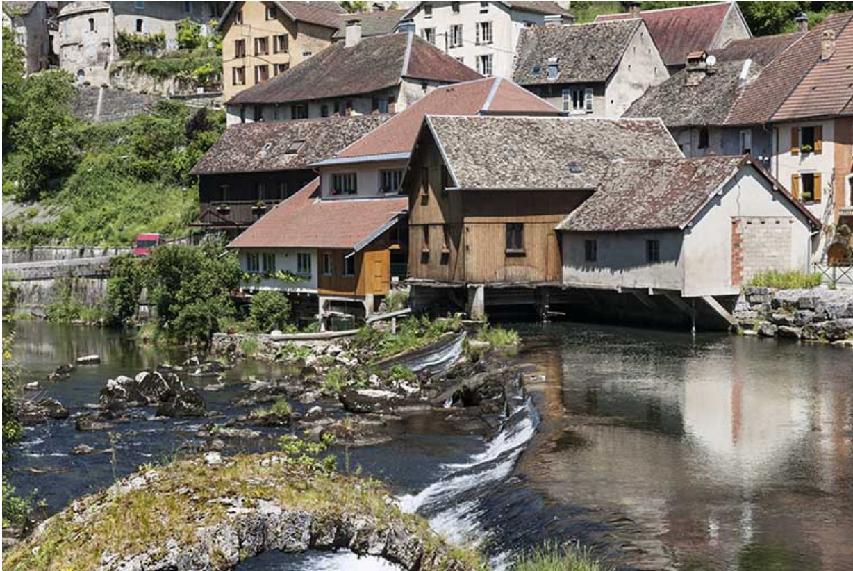
Vue depuis la tête amont du barrage.