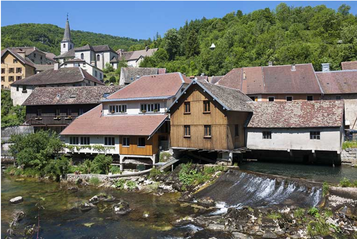
Vue rapprochée, depuis le sud-est.