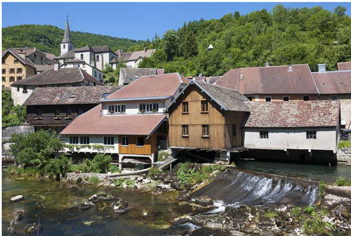
Vue rapprochée, depuis le sud-est.