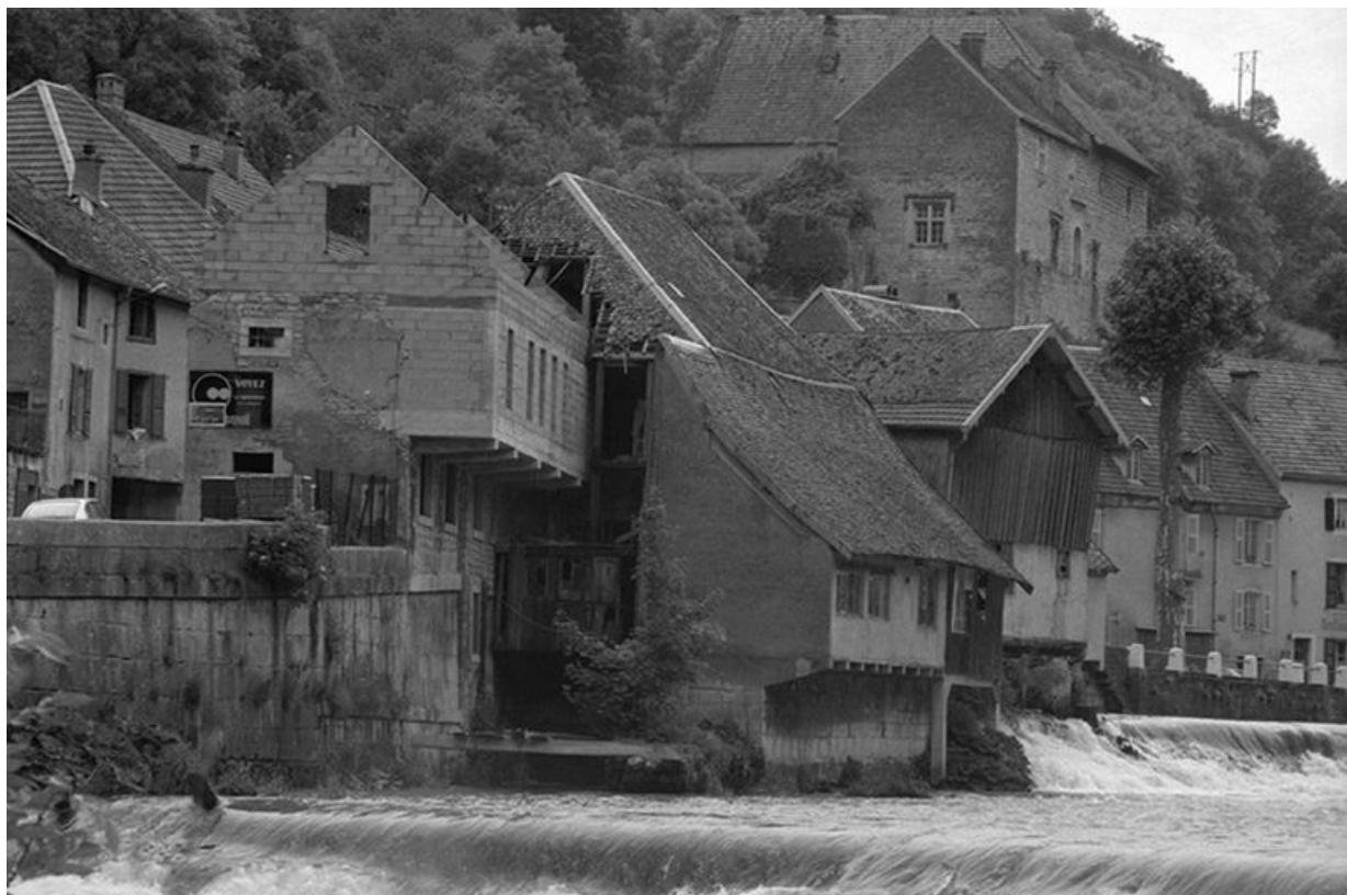
Vue générale, angle sud-ouest.