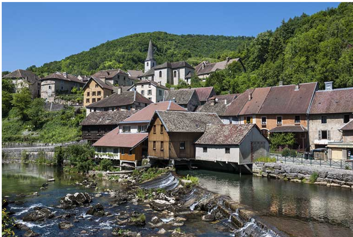
Vue d'ensemble depuis la rive gauche, en amont.