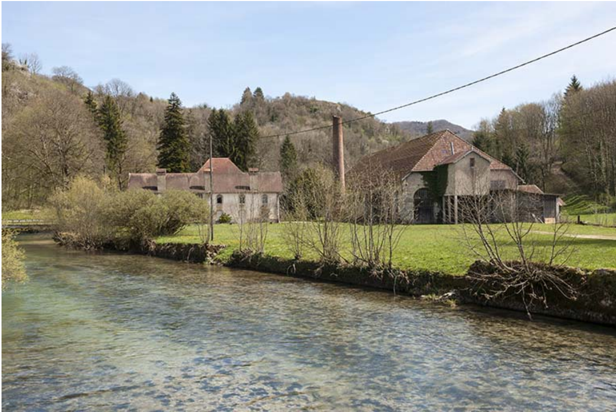
Vue d'ensemble depuis la rive droite de la Loue, à l'ouest.

25, Lods route départementale 67, lieudit : le Schiste