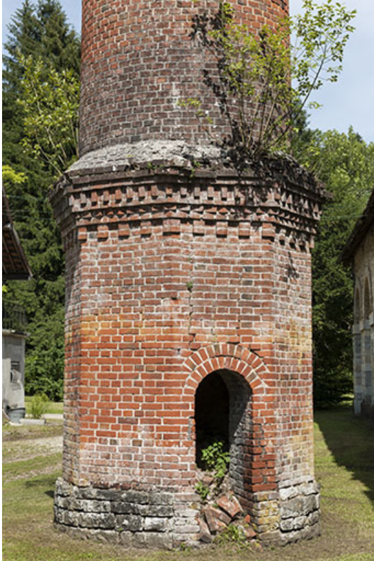
Base de la cheminée.

25, Lods route départementale 67, lieudit : le Schiste