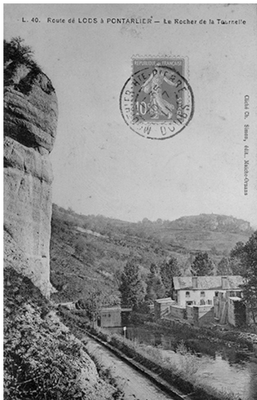
Route de Lods à Pontarlier. Le Rocher de la Tournelle, limite 19e siècle 20e siècle.

25, Lods route départementale 67, lieudit : le Schiste