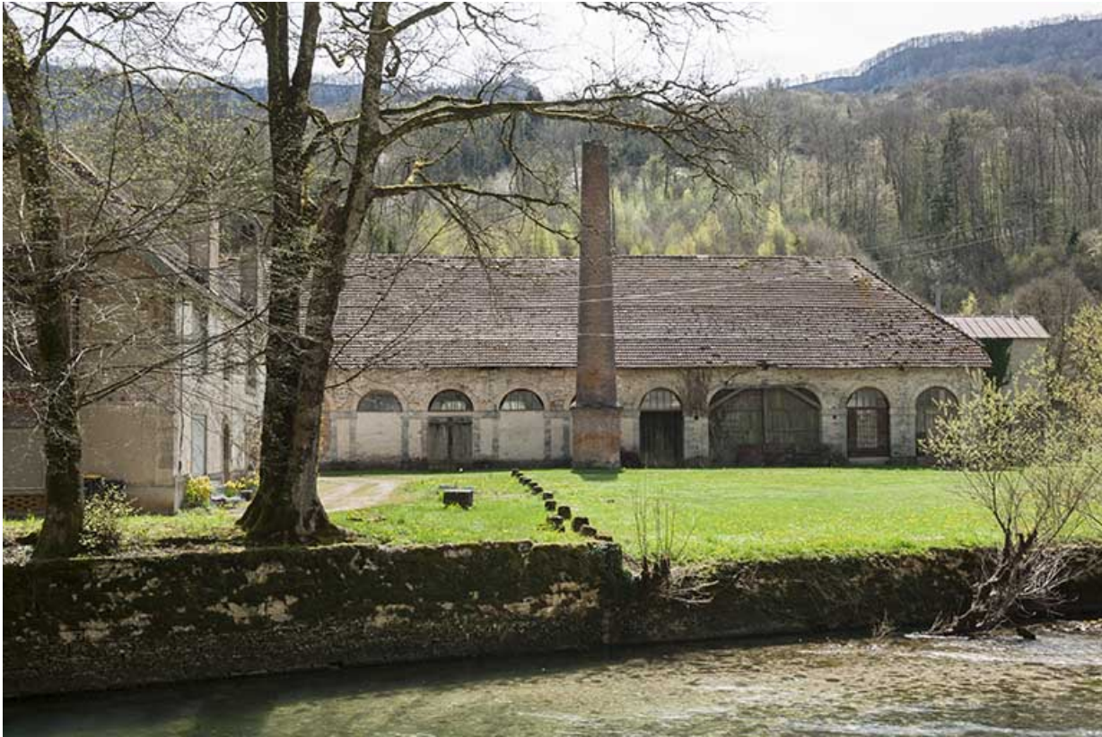
Façade nord de l'atelier de fabrication.

25, Lods route départementale 67, lieudit : le Schiste