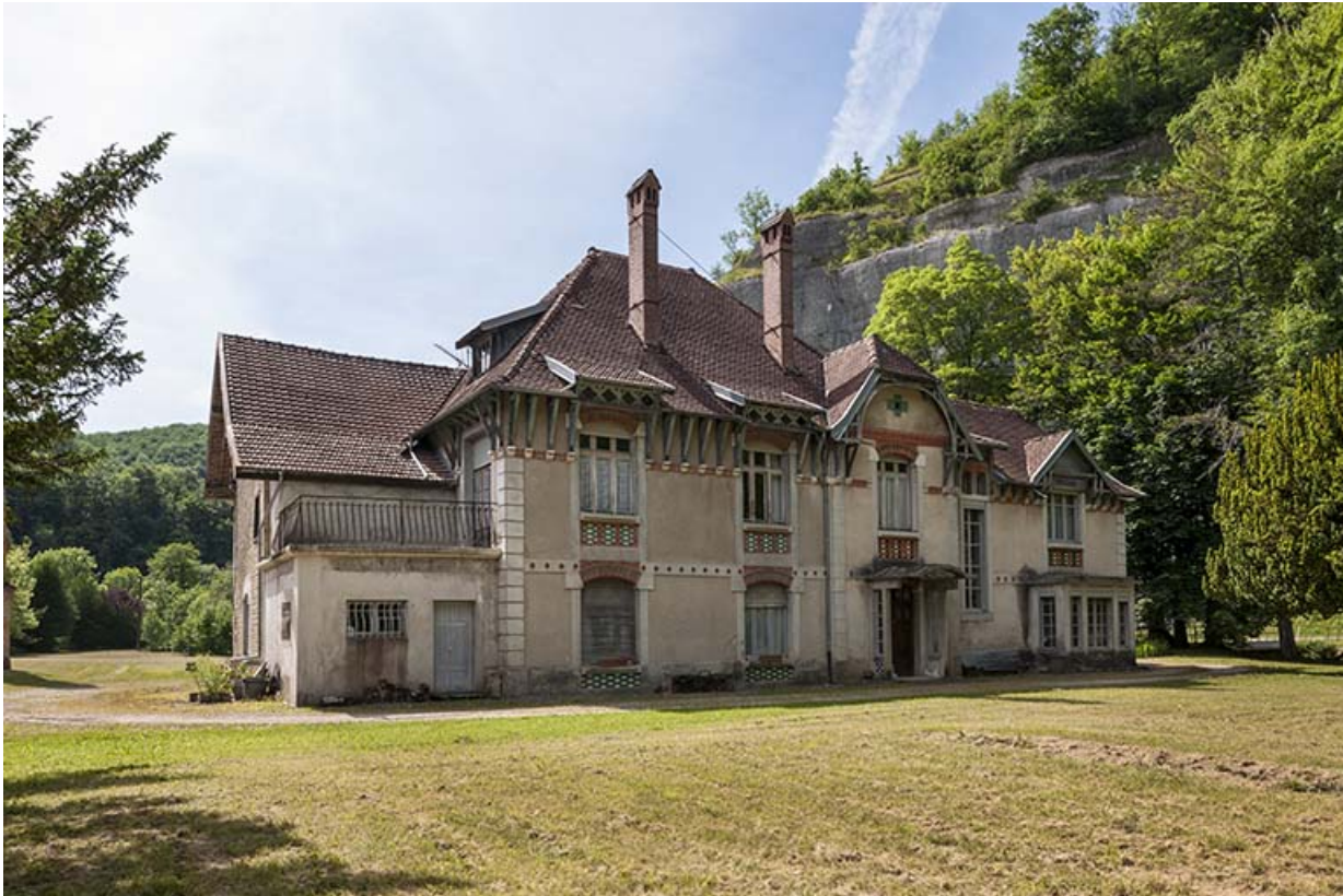
Façade est du logement patronal.

25, Lods route départementale 67, lieudit : le Schiste