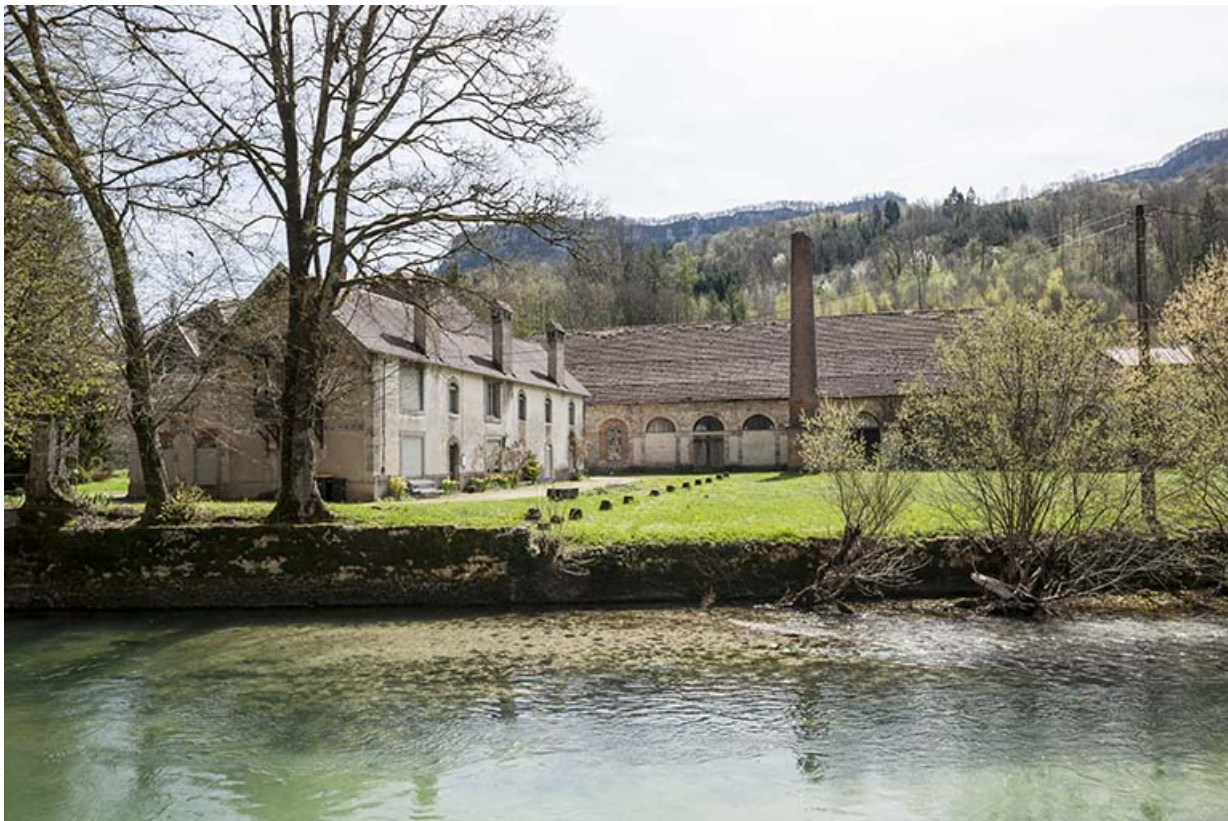
Logement et atelier depuis le nord.