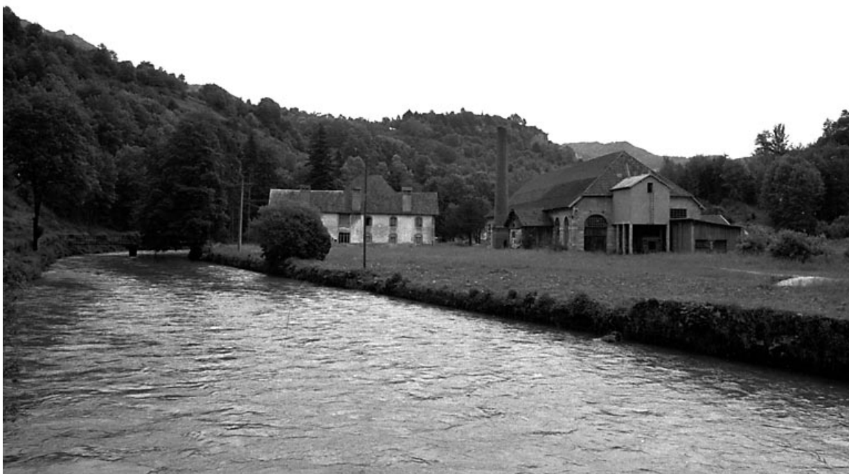
Vue générale du site.