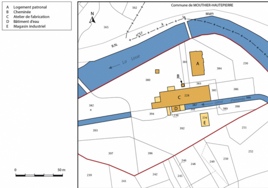
Plan-masse et de situation. Extrait du plan cadastral, 2016, section C. 25, Lods route départementale 67, lieudit : le Schiste