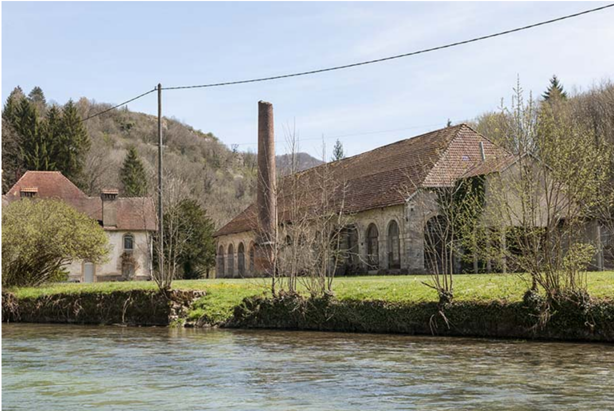
Logements et atelier de fabrication vus de trois quarts.

25, Lods route départementale 67, lieudit : le Schiste