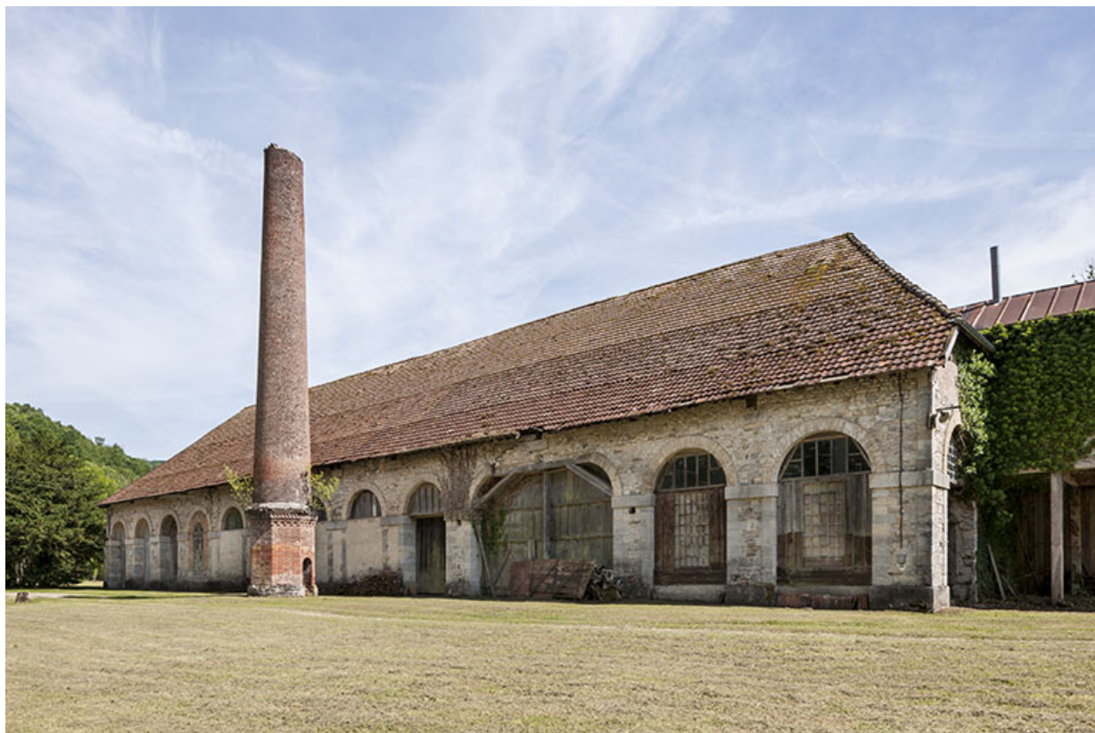
Atelier de fabrication vu de trois quarts droite.