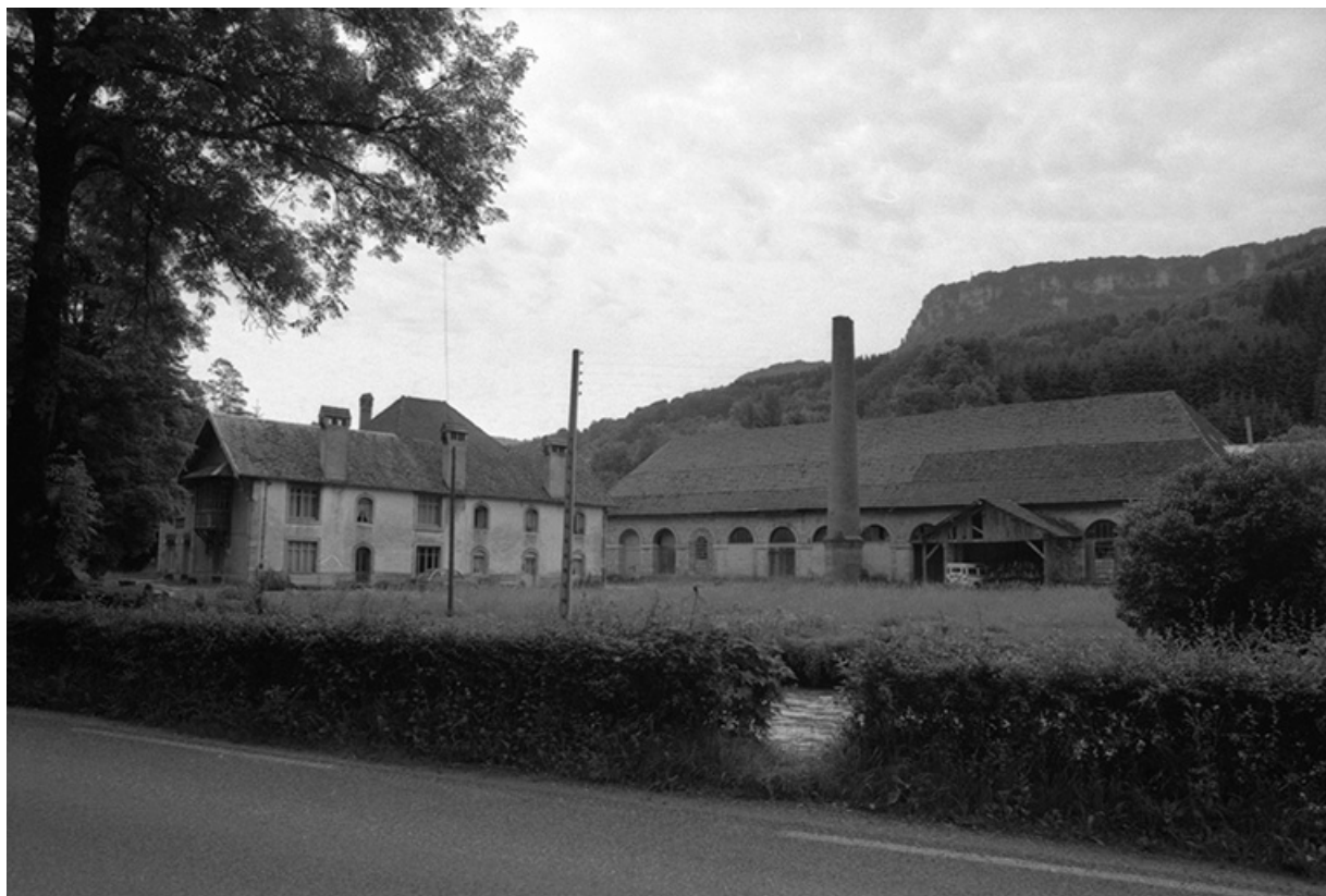
Vue d'ensemble depuis la rive droite de la Loue.

25, Lods route départementale 67, lieudit : le Schiste