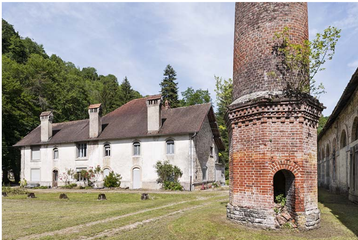
Logement patronal et base de la cheminée depuis l'ouest.

25, Lods route départementale 67, lieudit : le Schiste