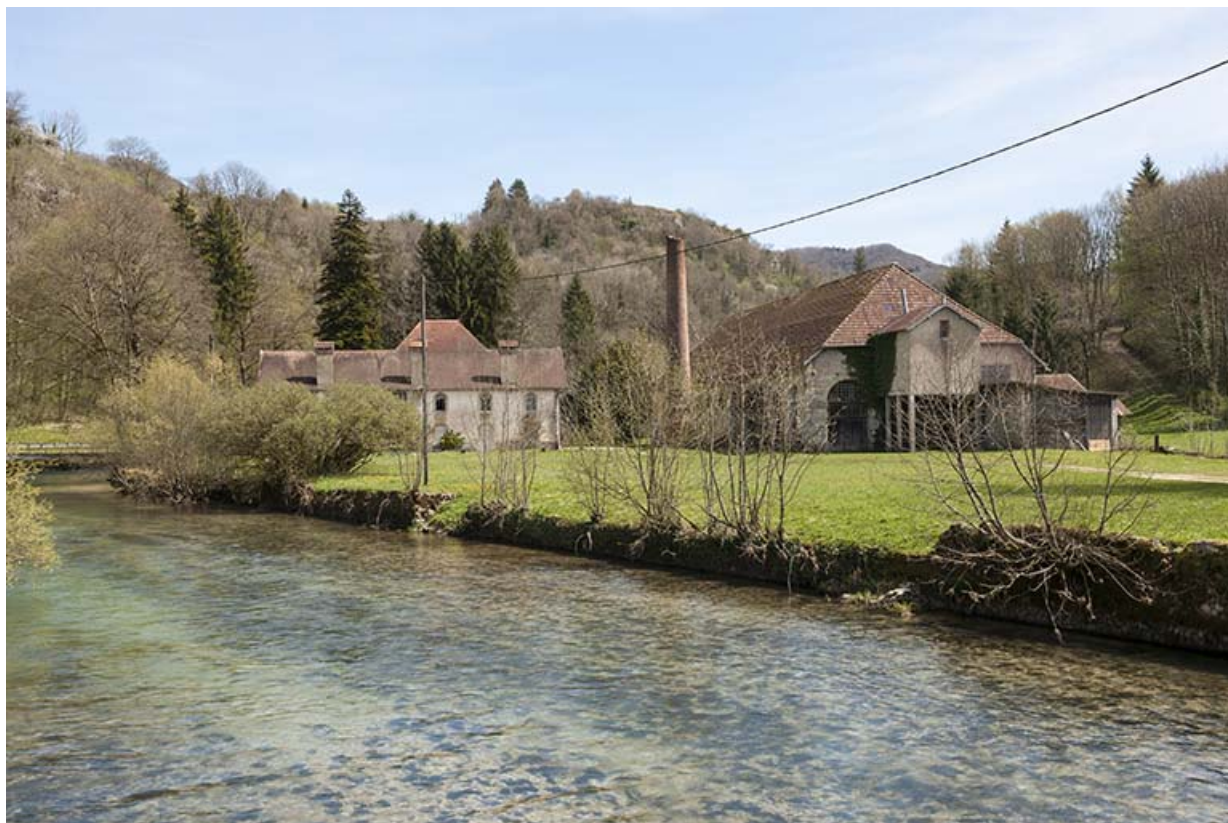
Vue d'ensemble depuis la rive droite de la Loue, à l'ouest.

25, Lods route départementale 67, lieudit : le Schiste