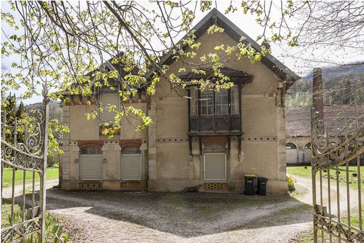
Pignon nord du logement patronal.

25, Lods route départementale 67, lieudit : le Schiste