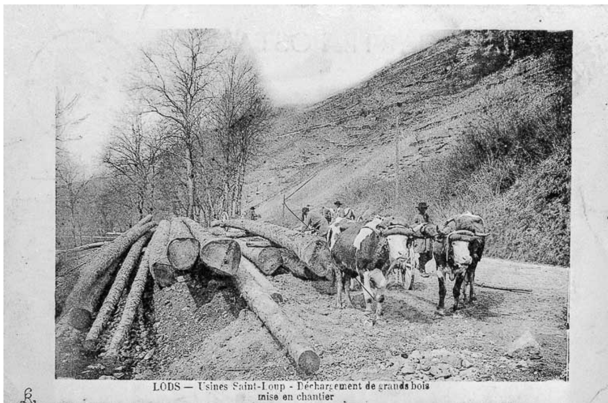
Lods - Usines Saint-Loup - Déchargement de grands bois mise en chantier, limite 19e siècle 20e siècle.

Carte postale, s.d. [limite 19e siècle 20e siècle]. Lieu de conservation : Collection particulière