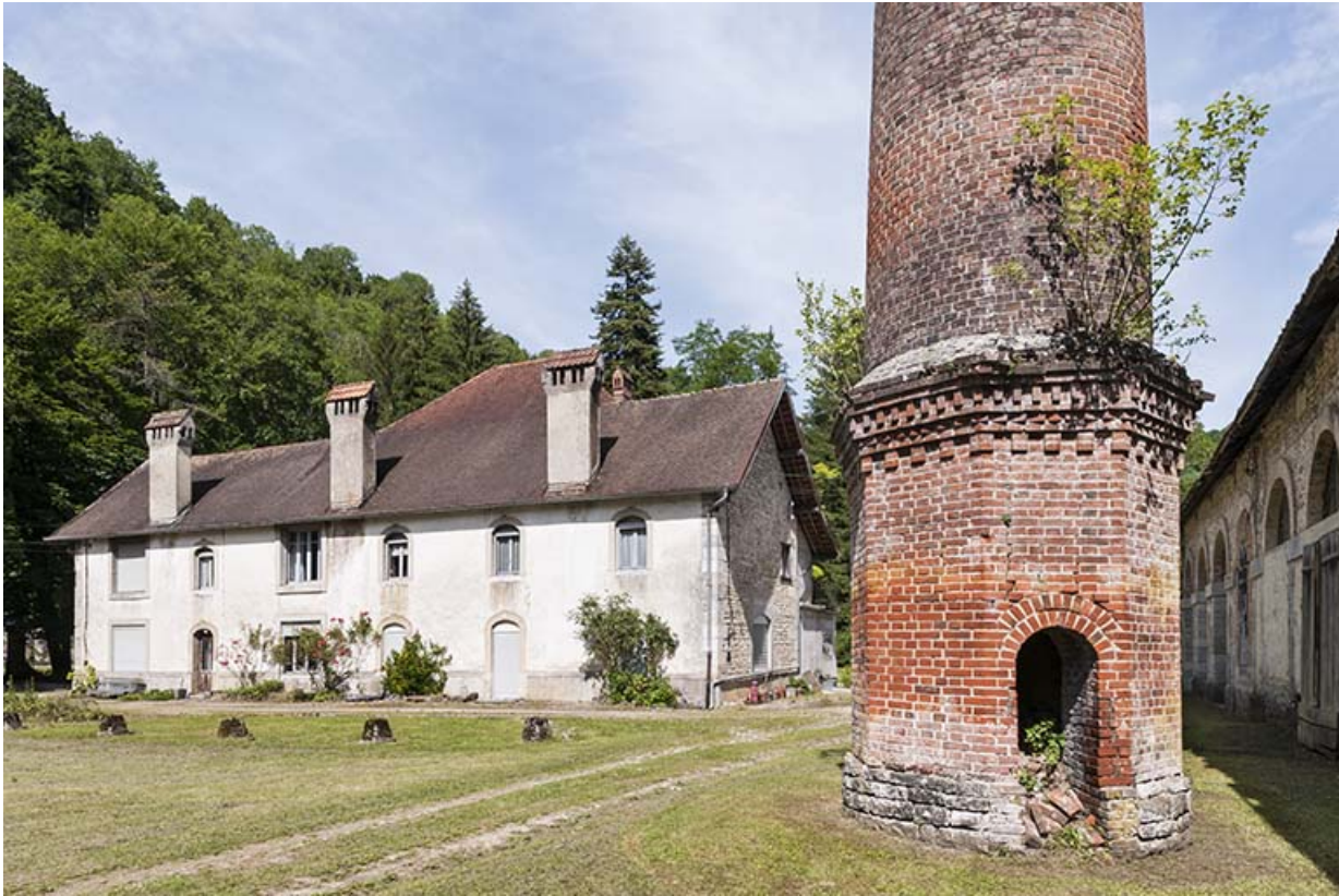
Logement patronal et base de la cheminée depuis l'ouest.

25, Lods route départementale 67, lieudit : le Schiste