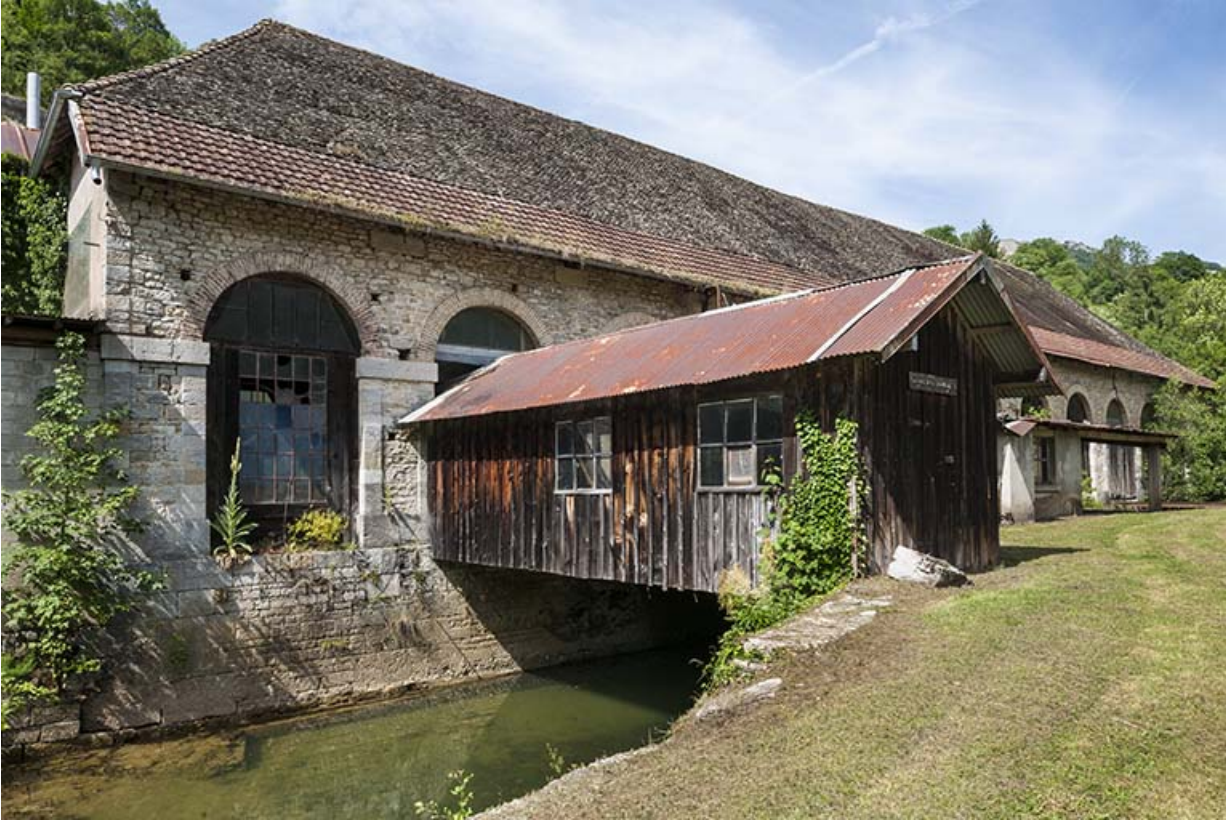
Façade sud de l'atelier de fabrication et passage couvert sur le bief.

25, Lods route départementale 67, lieudit : le Schiste