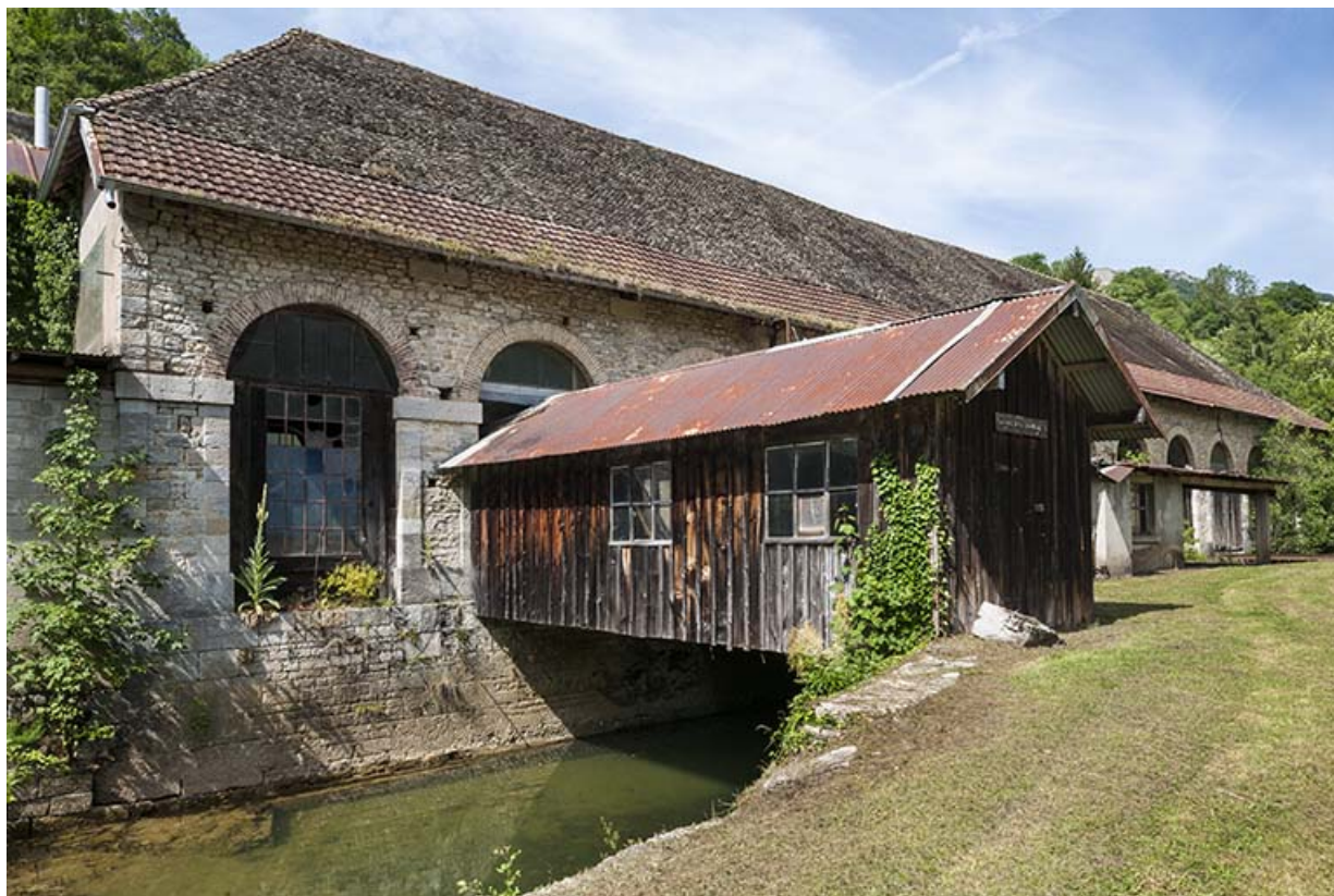
Façade sud de l'atelier de fabrication et passage couvert sur le bief.

25, Lods route départementale 67, lieudit : le Schiste