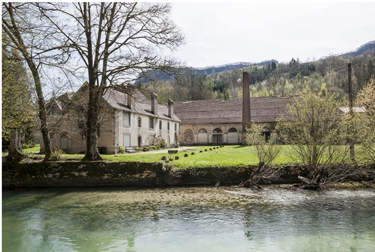
Logement et atelier depuis le nord.