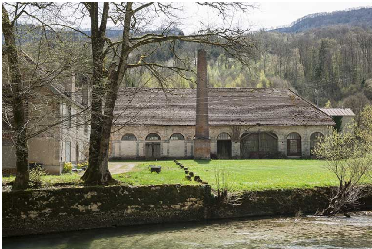
Façade nord de l'atelier de fabrication.

25, Lods route départementale 67, lieudit : le Schiste