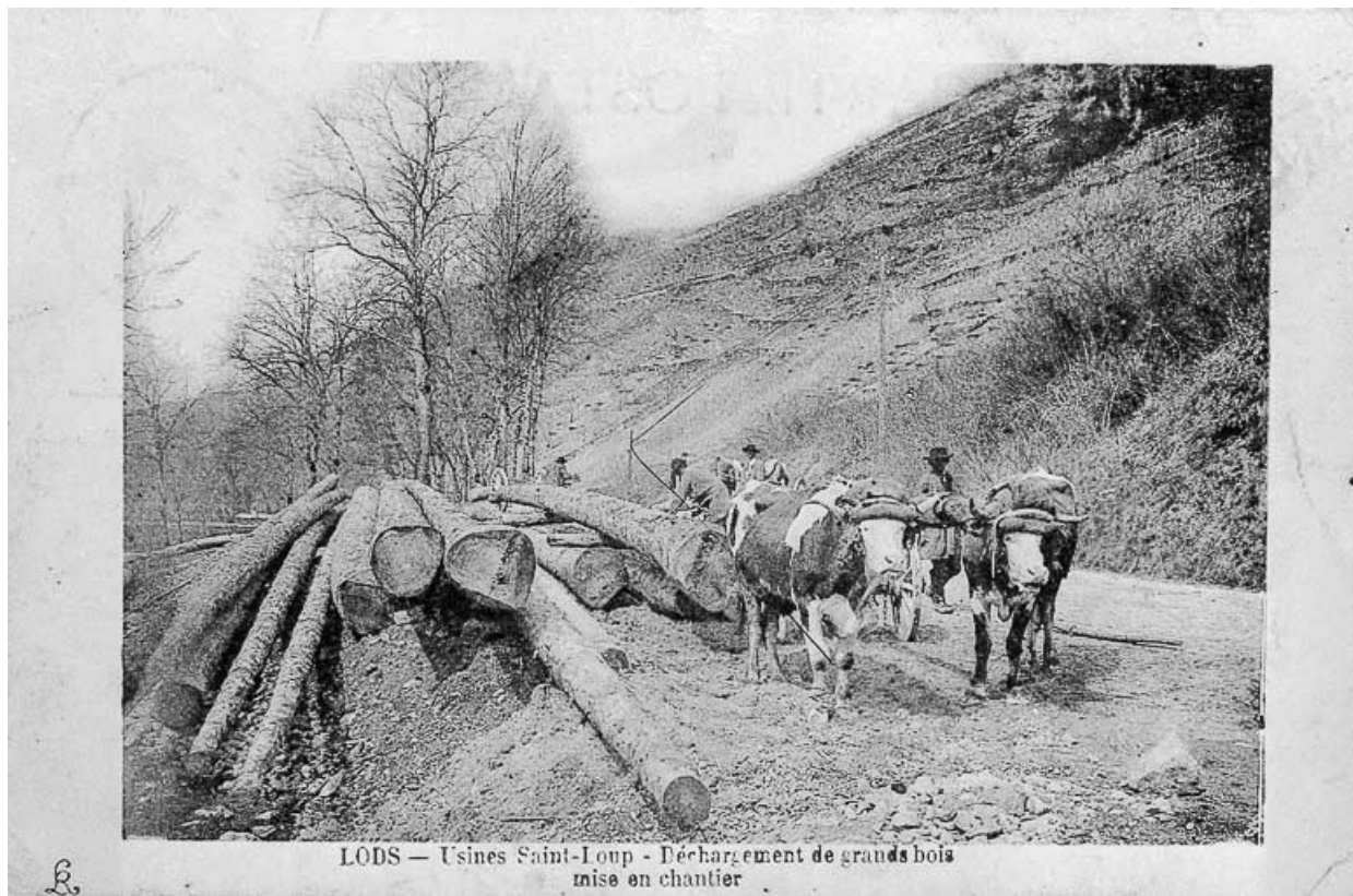
Lods - Usines Saint-Loup - Déchargement de grands bois mise en chantier, limite 19e siècle 20e siècle.