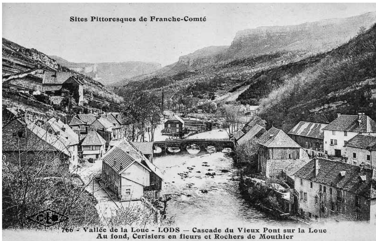
766. Vallée de la Loue - LODS - Cascade du Vieux Pont sur la Loue. Au fond, Cerisiers en fleurs et Rochers de Mouthier 25, Lods rue du Bief Poutot