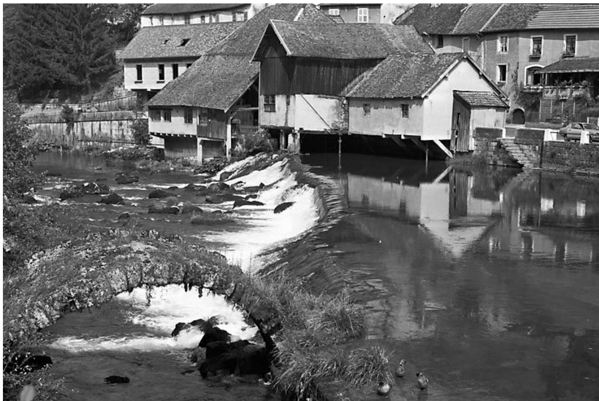
Vestiges : une arche. 25, Lods