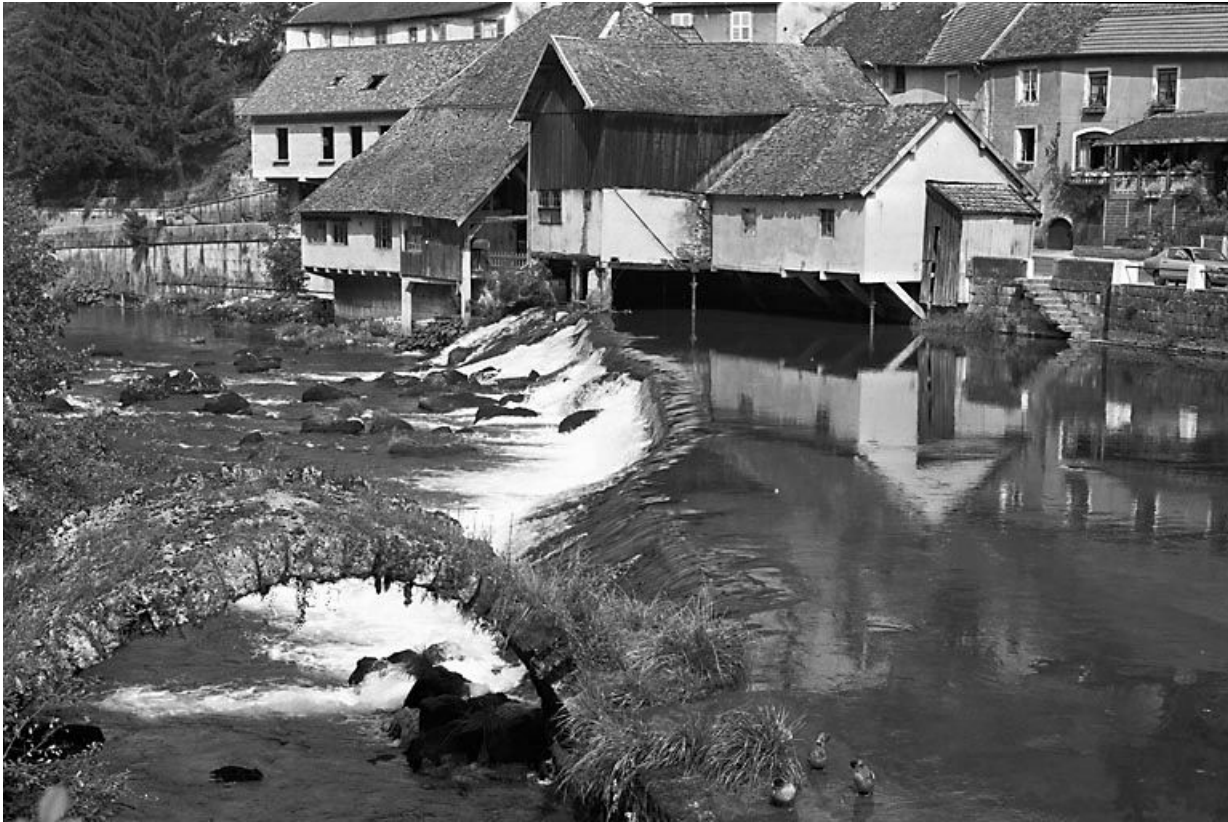
Vestiges : une arche.