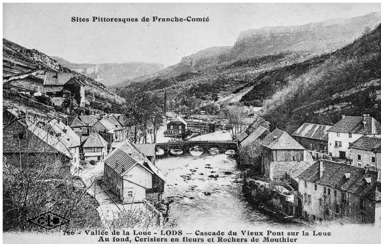
766. Vallée de la Loue - LODS - Cascade du Vieux Pont sur la Loue. Au fond, Cerisiers en fleurs et Rochers de Mouthier 25, Lods rue du Bief Poutot