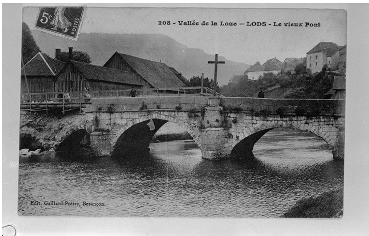
Vallée de la Loue. Lods. Le Vieux Pont, limite 19e siècle 20e siècle. 25, Lods rue du Bief Poutot

Carte postale, s.d. [limite 19e siècle 20e siècle], Gaillard-Prêtre éd., Besançon. Lieu de conservation : Collection particulière