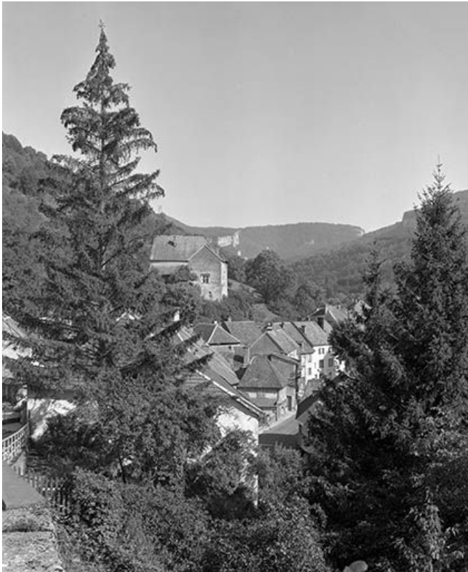
Vue générale depuis l'ouest.