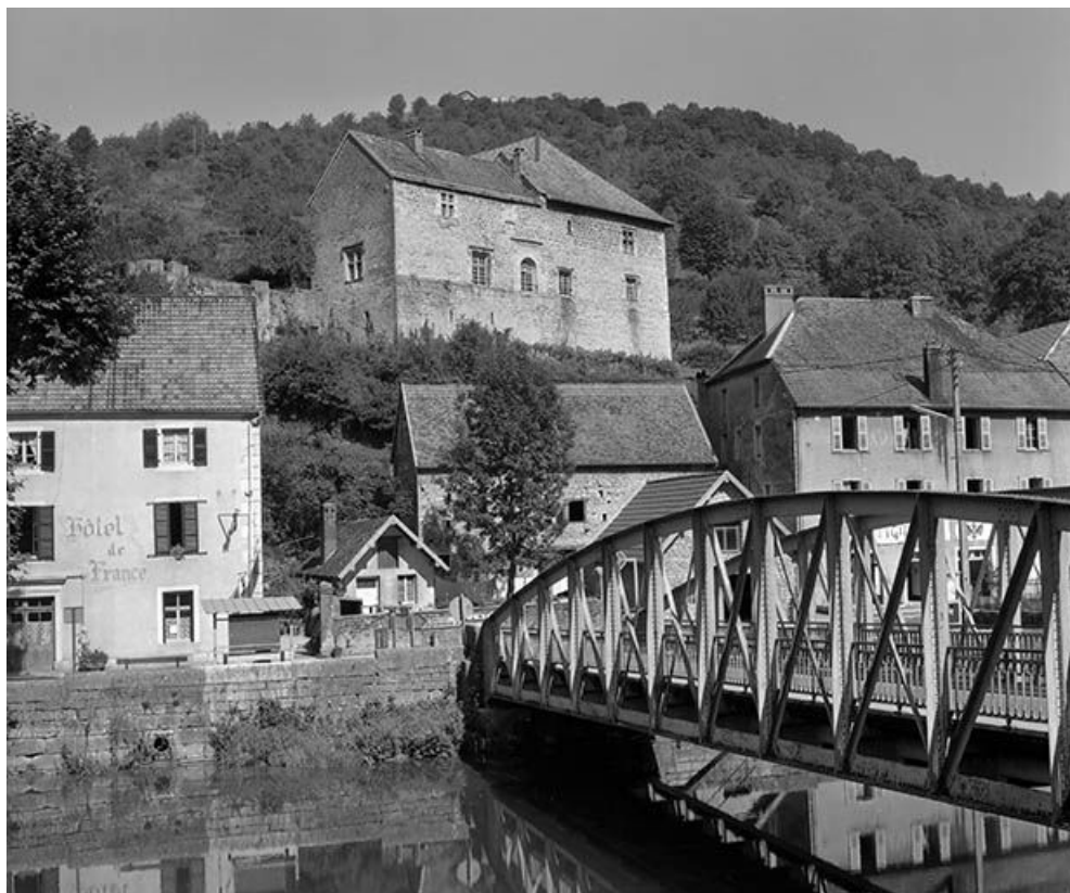
Vue générale depuis la rive gauche de la Loue.