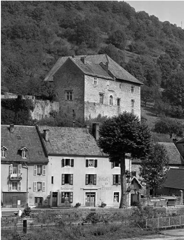
Vue générale, angle sud-ouest.