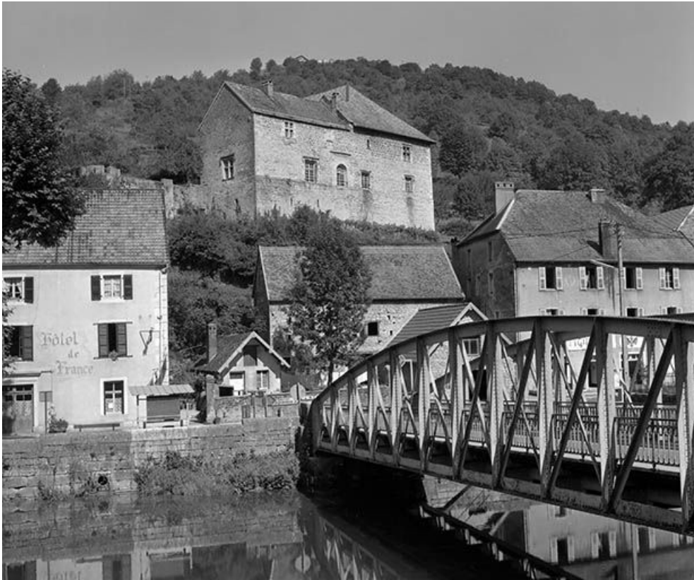
Vue générale depuis la rive gauche de la Loue.