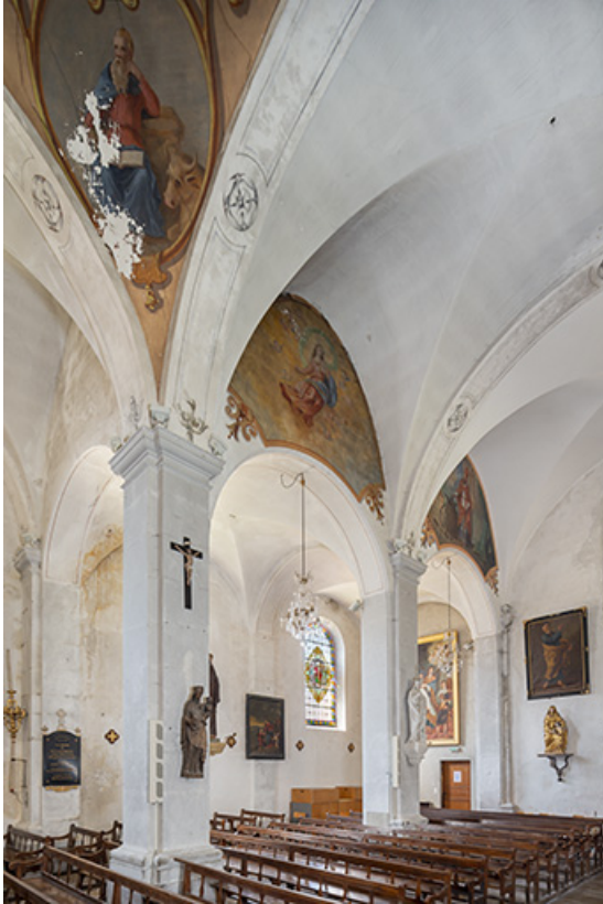
Bas-côté en 2021.