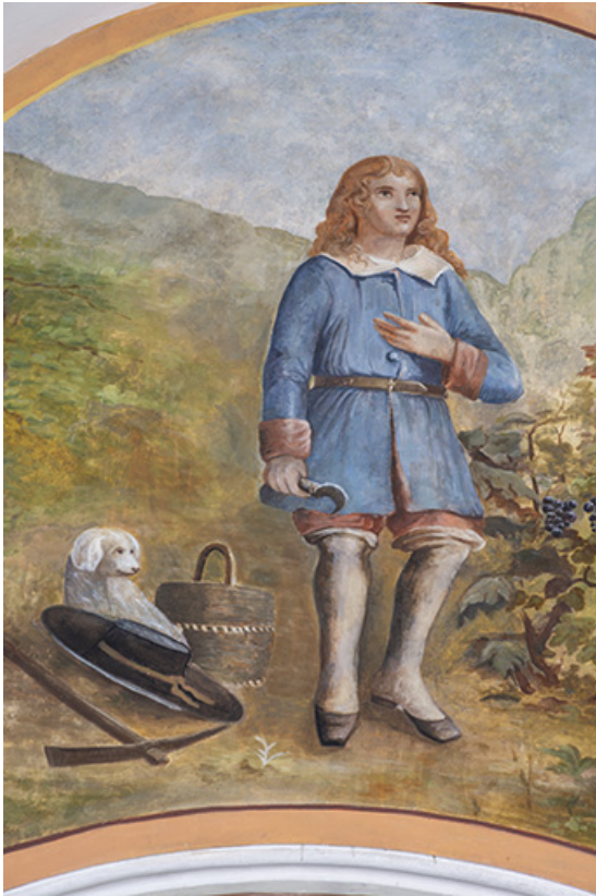
Peinture monumentale : saint Vernier, détail en 2021. 25, Lods