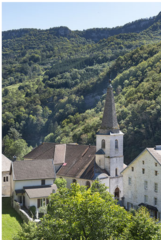
Vue rapprochée depuis le nord-ouest en 2021.