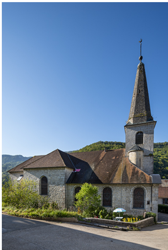
Façade latérale gauche en 2021.