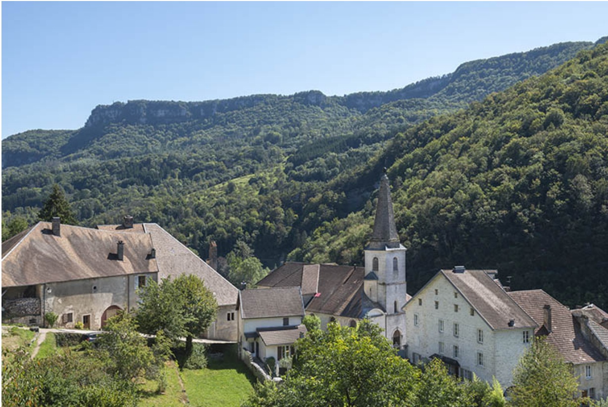
Vue depuis le nord-ouest en 2021.