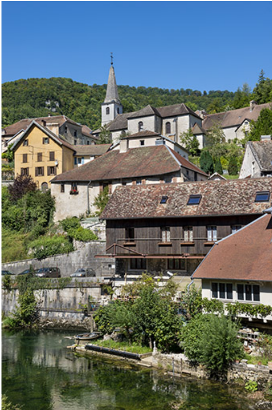
Vue de situation en 2021.