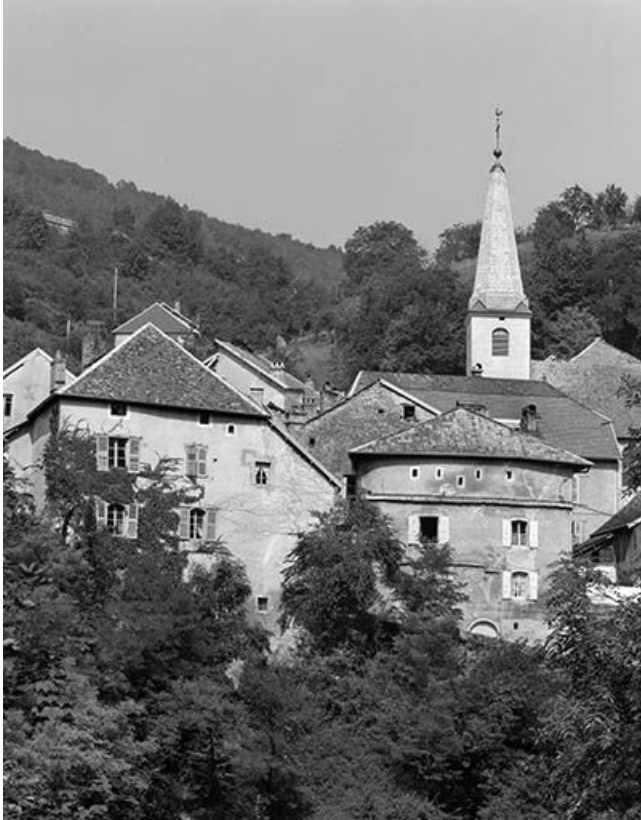
Vue générale du site depuis le sud.