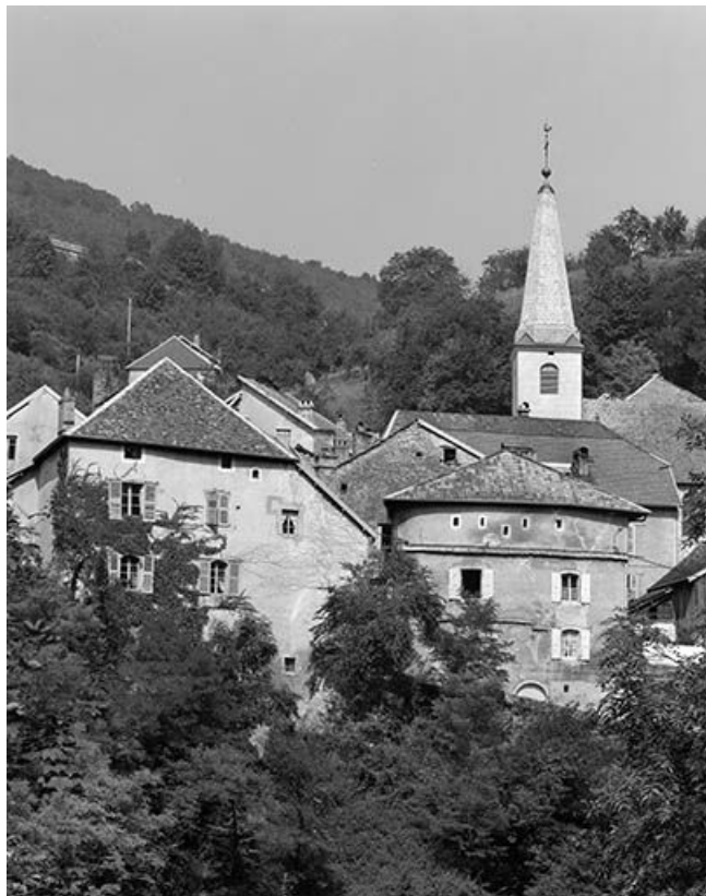
Vue générale du site depuis le sud.