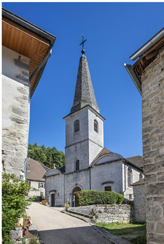
Façade antérieure vue de trois quarts droit en 2021. 25, Lods rue de l' Eglise