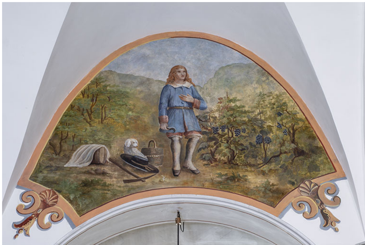
Peinture monumentale : saint Vernier, en 2021. 25, Lods