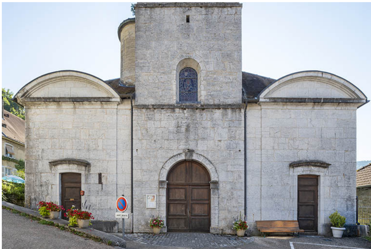
Façade antérieure en 2021.