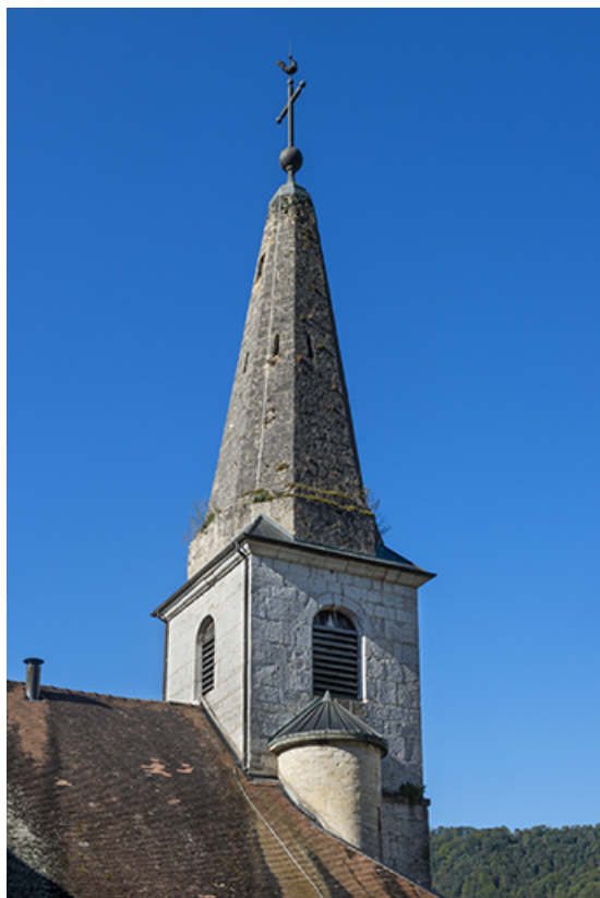
Le clocher en 2021.