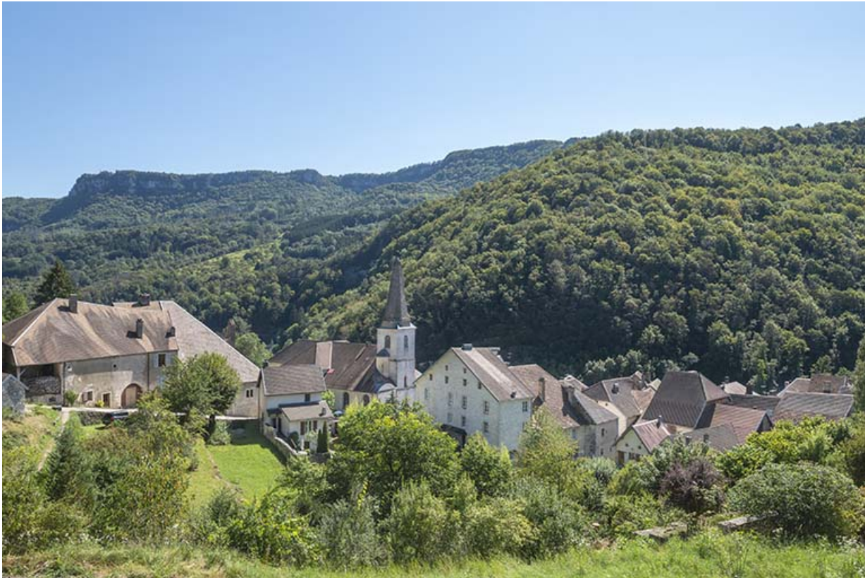
Vue générale du site depuis le nord-ouest en 2021.