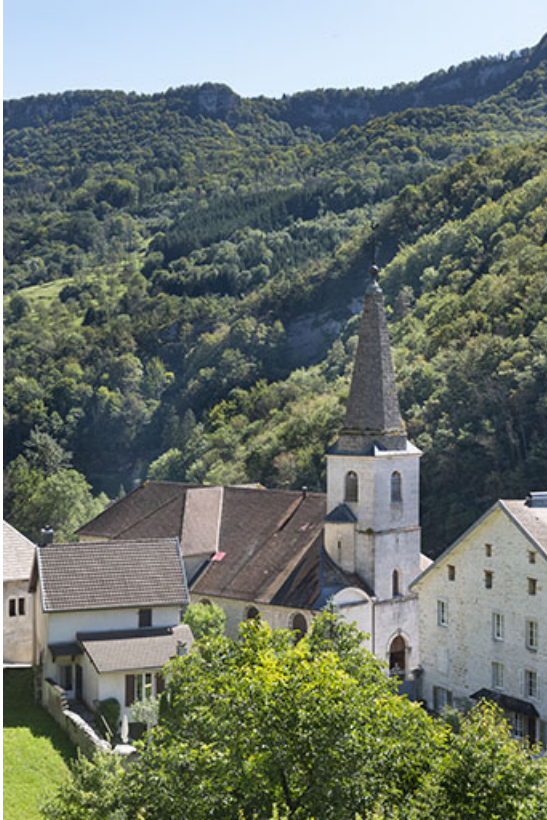
Vue rapprochée depuis le nord-ouest en 2021.