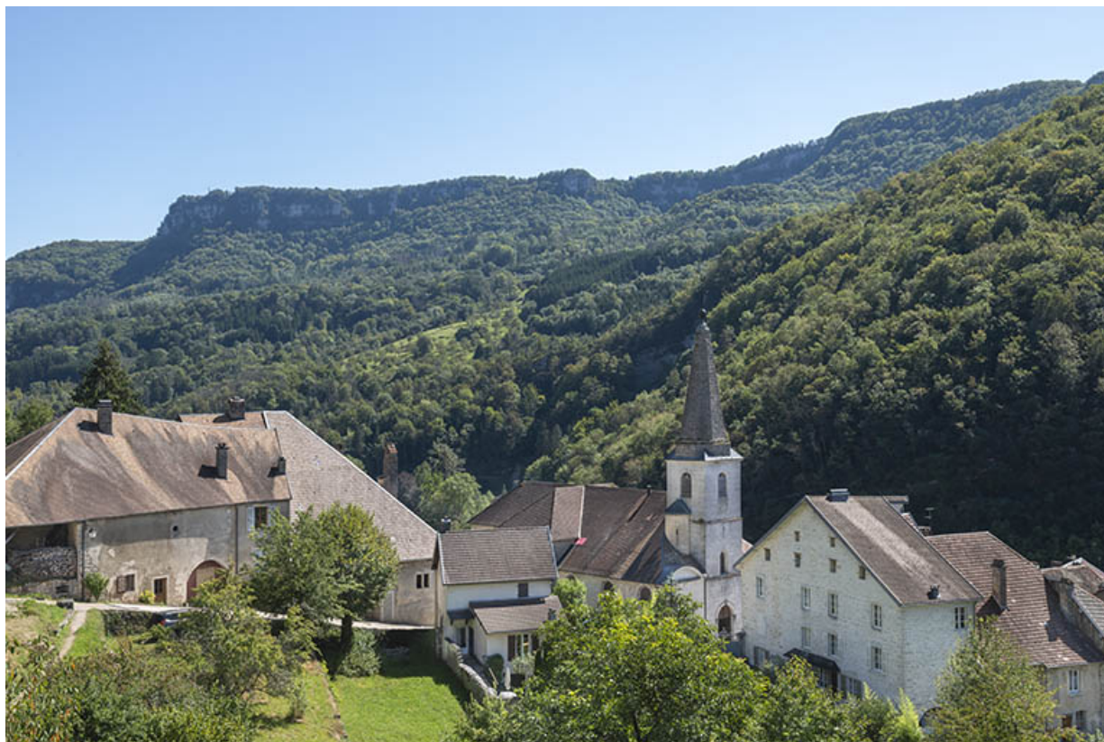
Vue depuis le nord-ouest en 2021.