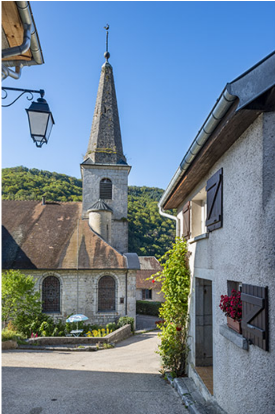
Le clocher en 2021