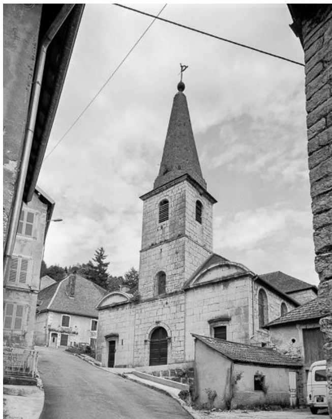
Façade antérieure de trois quarts droit.