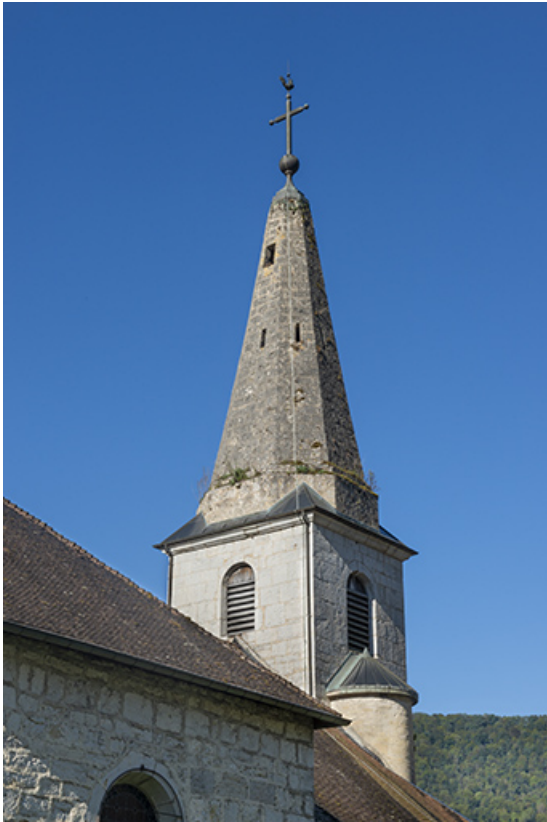
Le clocher en 2021.