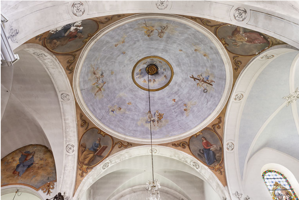
La coupole à la croisée du transept en 2021. 25, Lods