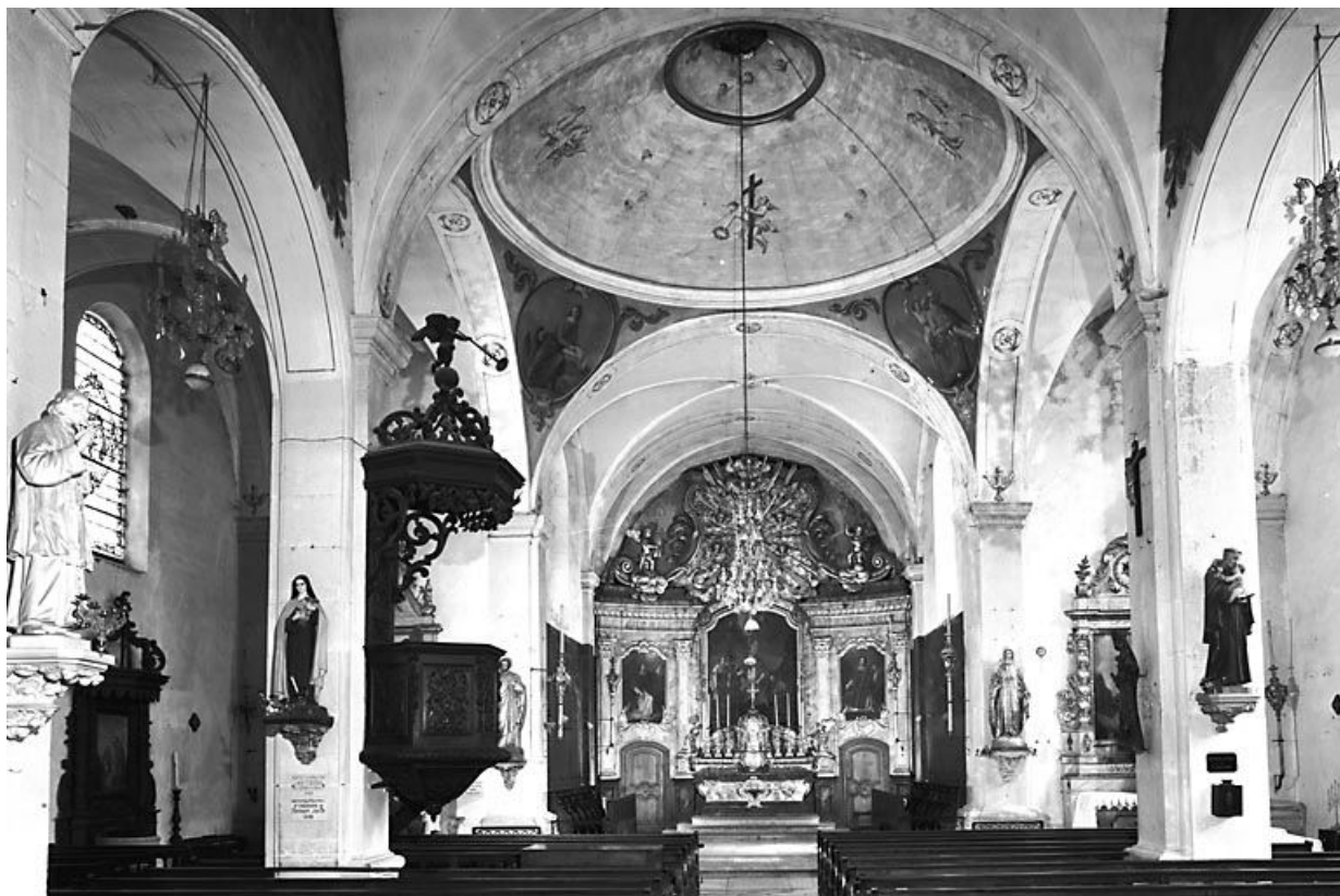
La croisée du transept. 25, Lods rue de l' Eglise