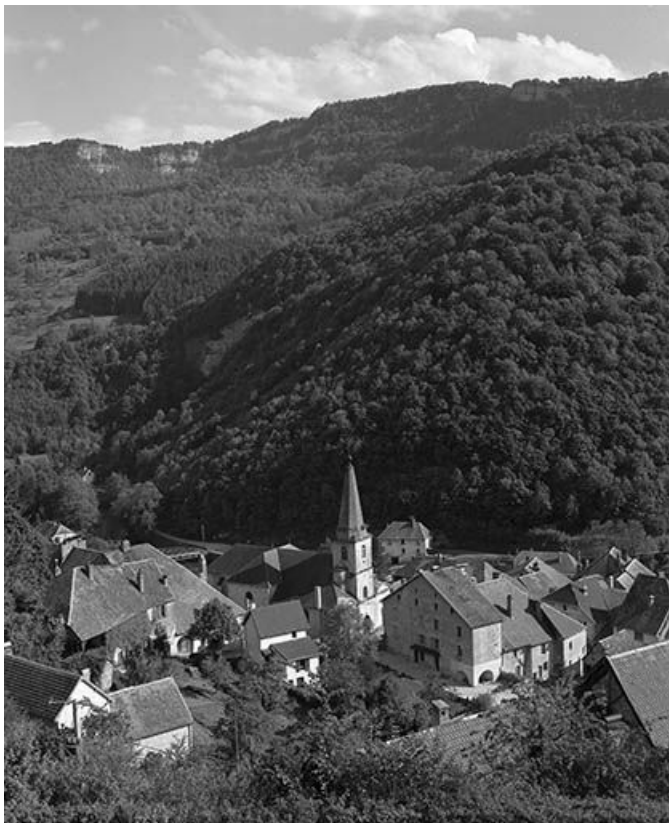
Vue générale du site depuis le nord-ouest.