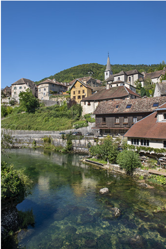
Vue de situation en 2021.