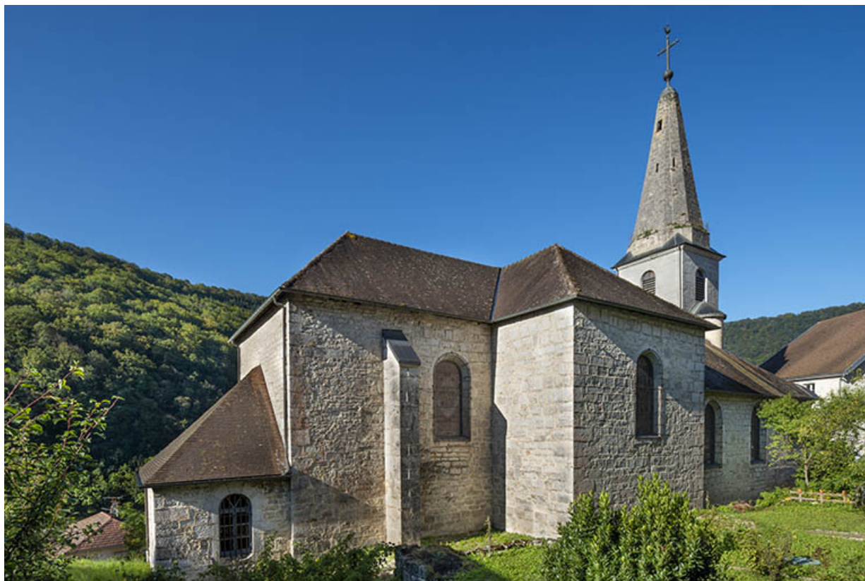
Façade latérale gauche en 2021.