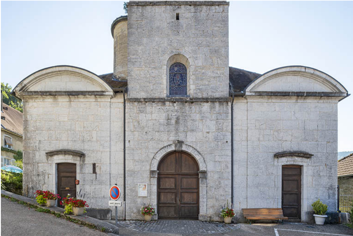
Façade antérieure en 2021.