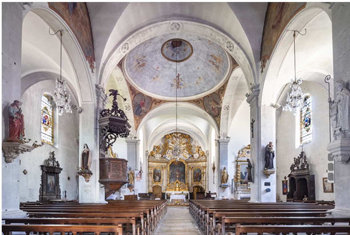
La nef et le chœur vus depuis l'entrée en 2021.