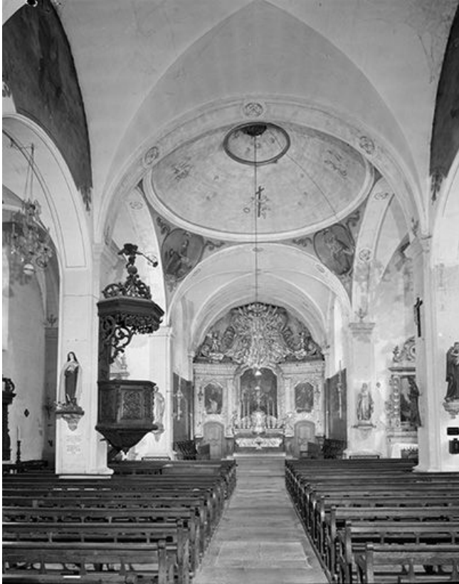
Vue de la nef et du chœur depuis l'entrée.