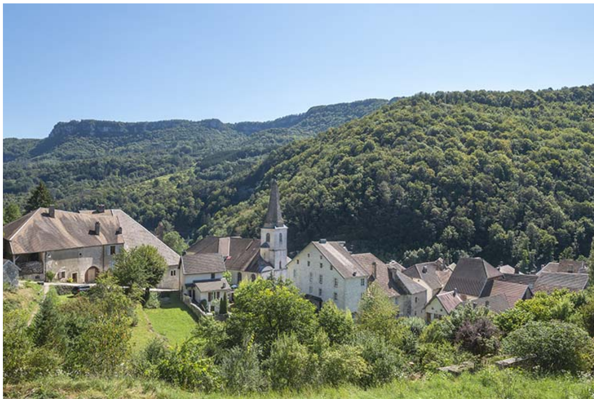
Vue générale du site depuis le nord-ouest en 2021.