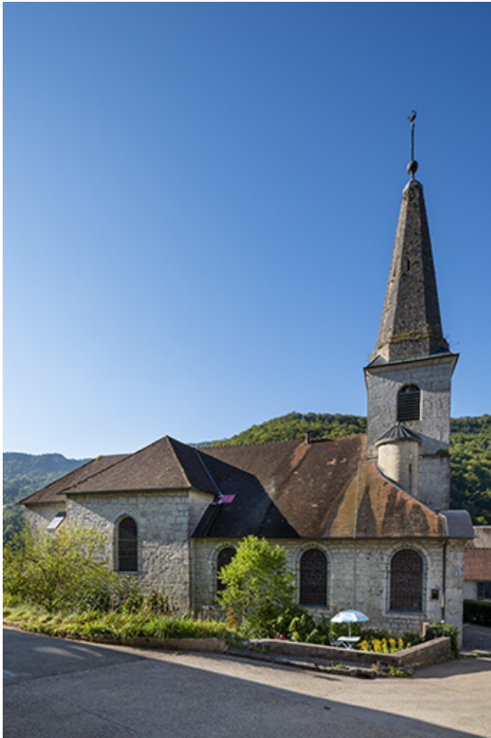
Façade latérale gauche en 2021.