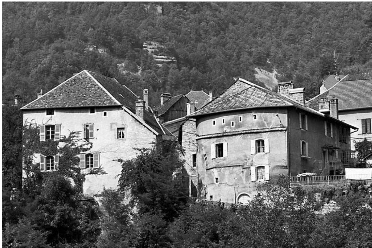
Elévation depuis le sud.