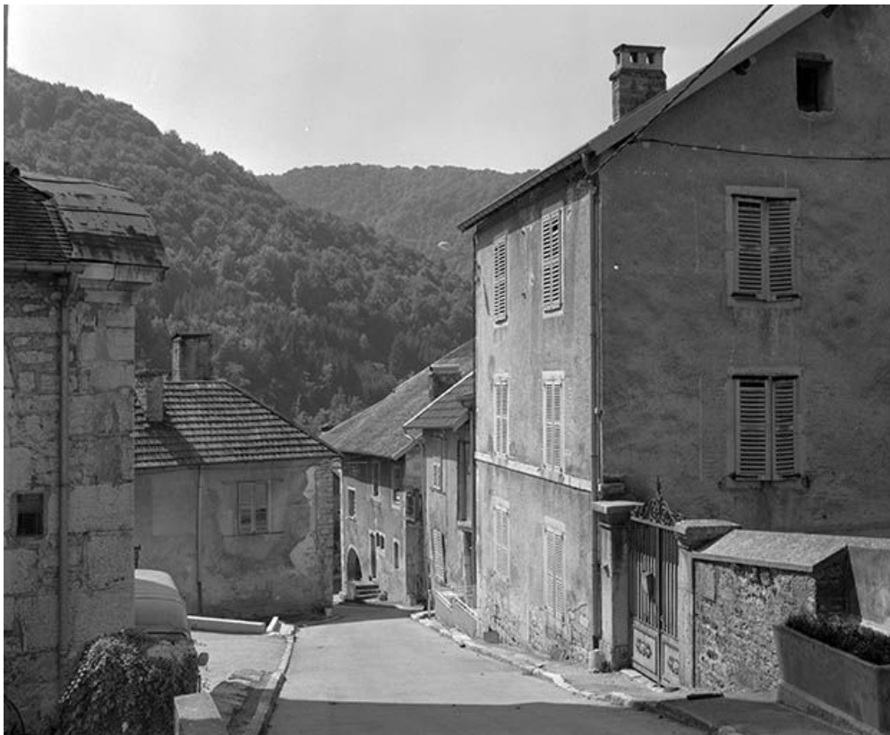
Face latérale gauche.