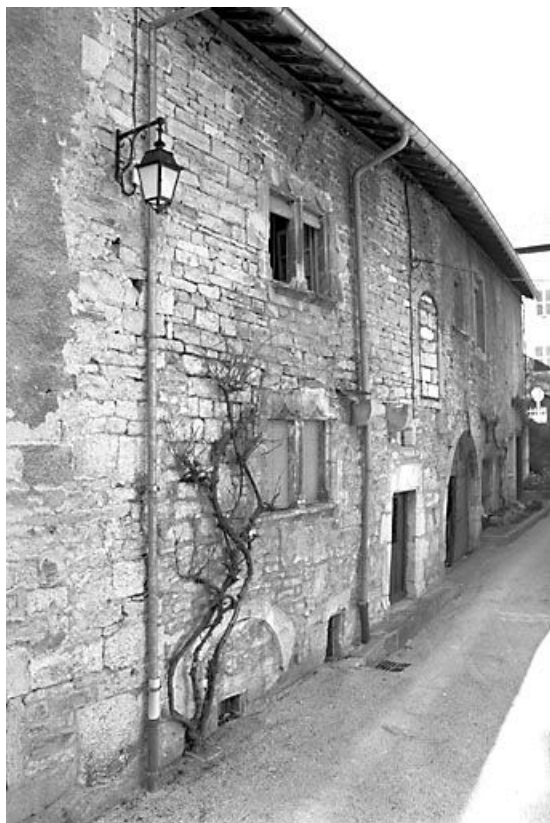
Façade antérieure de trois quarts gauche. 25, Lods