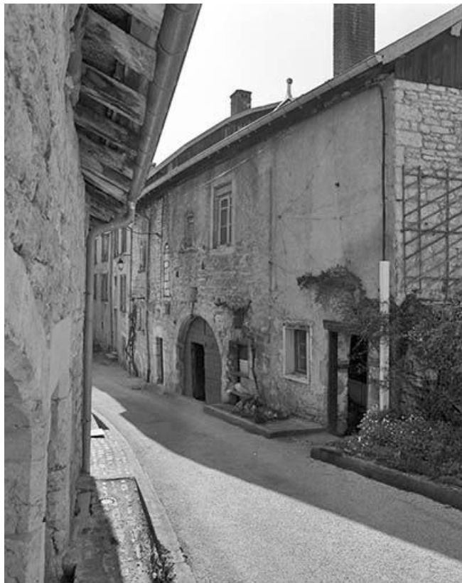
Façade antérieure de trois quarts droit. 25, Lods rue Rote